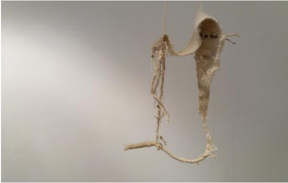
Valjastettu/ girded, 2018, Textiles Galerija, Vilna.