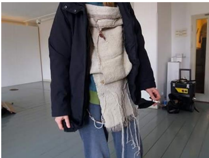
Neris-kudonta ja valmistautuminen Neris-joen varrelta kerättyjen askelten laskemiseksi Aurajoen ympäri, Raatihuoneen galleria, Turku, 2018.