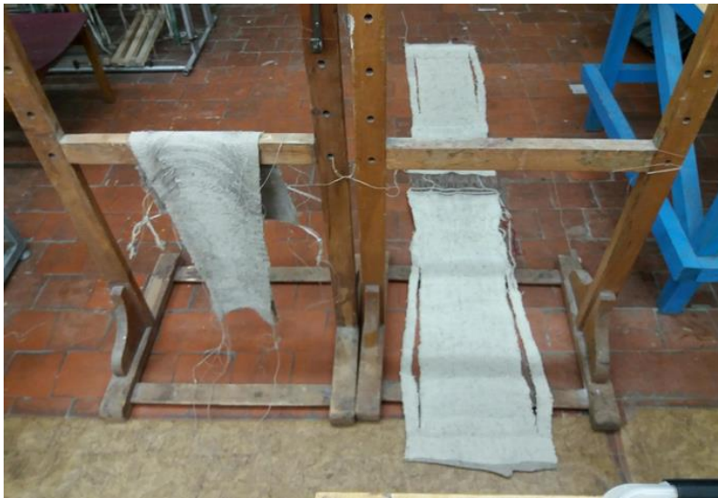
Vilnan kudonnat maaliskuussa, 2018.