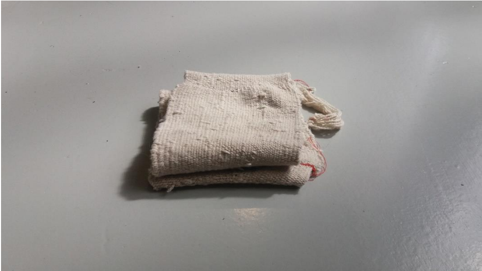
Jerusalemien kudonta, 2017-2018. Exhibition Laboratory. Helsinki.