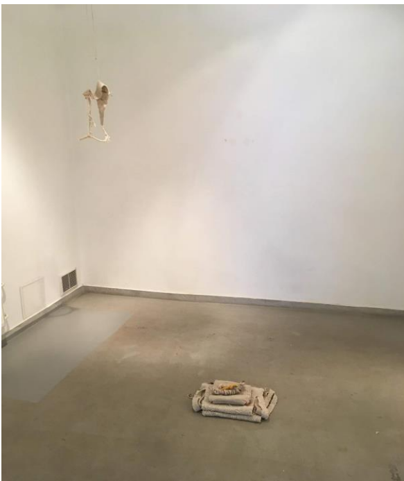
Kuva: Näyttelytilan perimmäinen, ensimmäisestä huoneesta suoraan eteenpäin aukeava tila. Teokset "Valjastus" vasemmassa yläkulmassa, ja alhaalla Neris ja Jerusalemin vyö.