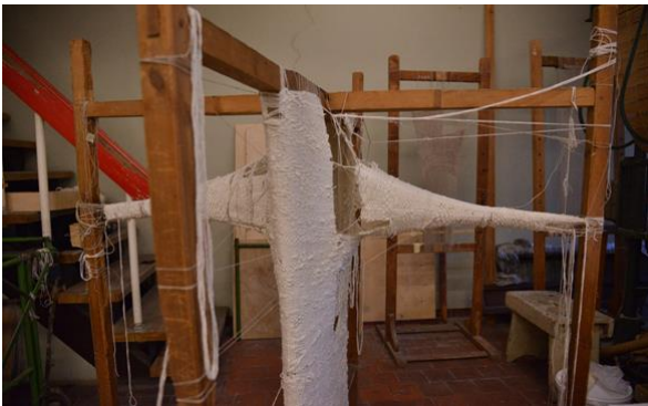
Yarning with in a cross, 2018. Audykla. Kudontaluokka.