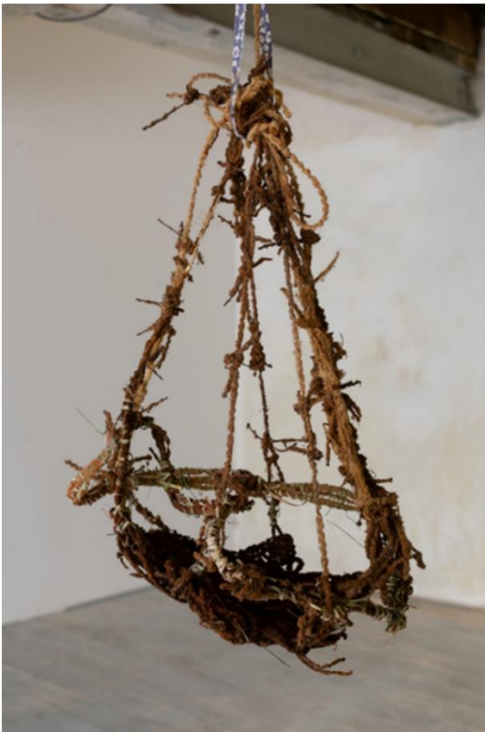
A Sieve, 2019, Treignac.

Olen myös pähkäillyt sitä, kuinka erotan nuo ”kudonnat”, joista puhun tuonnempana kahtena tai kolmena kudontana suhteessa ”laskettuihin kudontoihin” (Kuten Jerusalemin vyöhön). Jokin sai minut ajattelemaan niin, että nuo Vilnassa kutomani prosessin osat vastaavat enemmänkin sitä ruumiillista ”yhtä” askelta, tai jotain sitä ennen, ruumiin kykyä ja halua vastaanottaa ruumiin paino, ja sen jakautuminen keskivartalon ja raajojen varaan, mikä ylipäänsä mahdollistaa astujan ja astutun välisen vuorovaikutuksen.