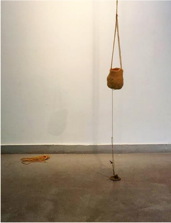
Maan uuma, 2018, Vilna.