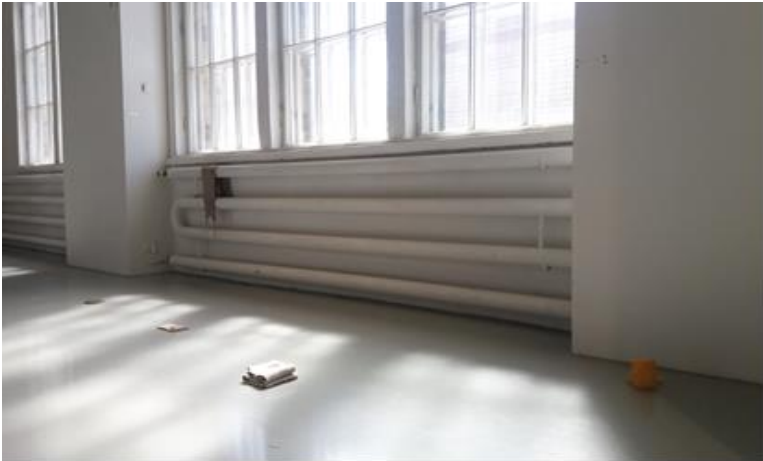
Teosnäkö (ensimmäisen ikkunan alle) Helsingissä Exhibition Laboratoryssa 2018.

Muutenkin teokset asettuivat tilaan levollisesti. Toisaalta toiselle puolen päätyä, viereiselle ikkunalaudalle olin jättänyt jotain, joka enteili liikkumisen tarvetta – sekä päädyssä oleva seinän ja näyttelyseinän välinen kulma, johon teos tuossa sisätilassa levittyi, mutta mikä tarkoituksen mukaisesti oli jätetty vielä sivuun.