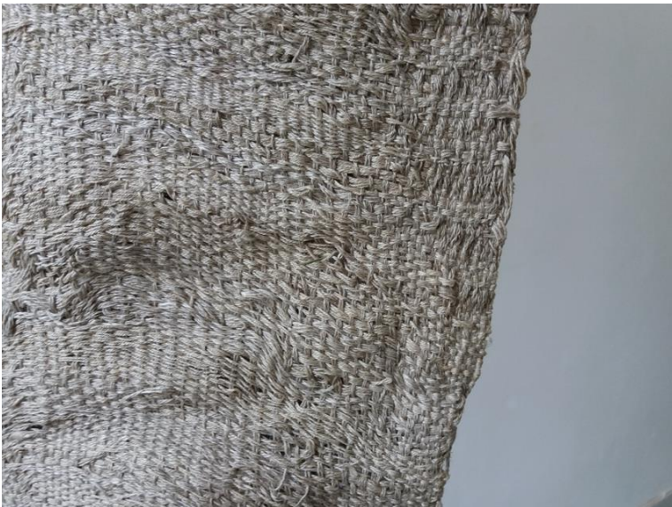
Yksityiskohta teoksesta "Vilnaus" (toinen kudonta), 2018, "Artifex Textiles Galerija".

Lopputyöhöni kuuluva kolmas näyttely oli heinäkuussa Vilnassa. Työt olivat esillä Vilnan akatemian tekstiiligalleriassa "Artifex" Textiles Galerija, jossa oli kolme huonetta. Kun huhtikuussa kuljetin irrottamiani kudontoja Vilnasta Turkuun, mietin jo niiden polkua takaisin. Kuvan kevään aikaisilla kävelyillä – ja kesäkuussa Helsingissä valmistunut kapeampi vyö nyt tuli osaksi Vilnan näyttelyä. Näyttelyssä käsittelin aikojen kerrostumaa, niin kuin aiemmassakin kahdessa.