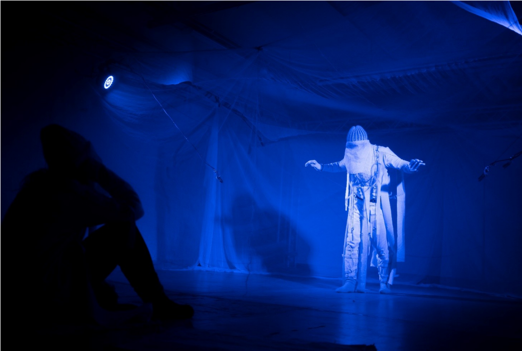
(Voyage esitys. Kuva: Teemu Ullgren)