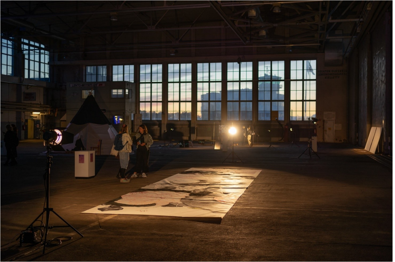
(Art for all – festivaali. Kuva: Kilian Kotmeier)