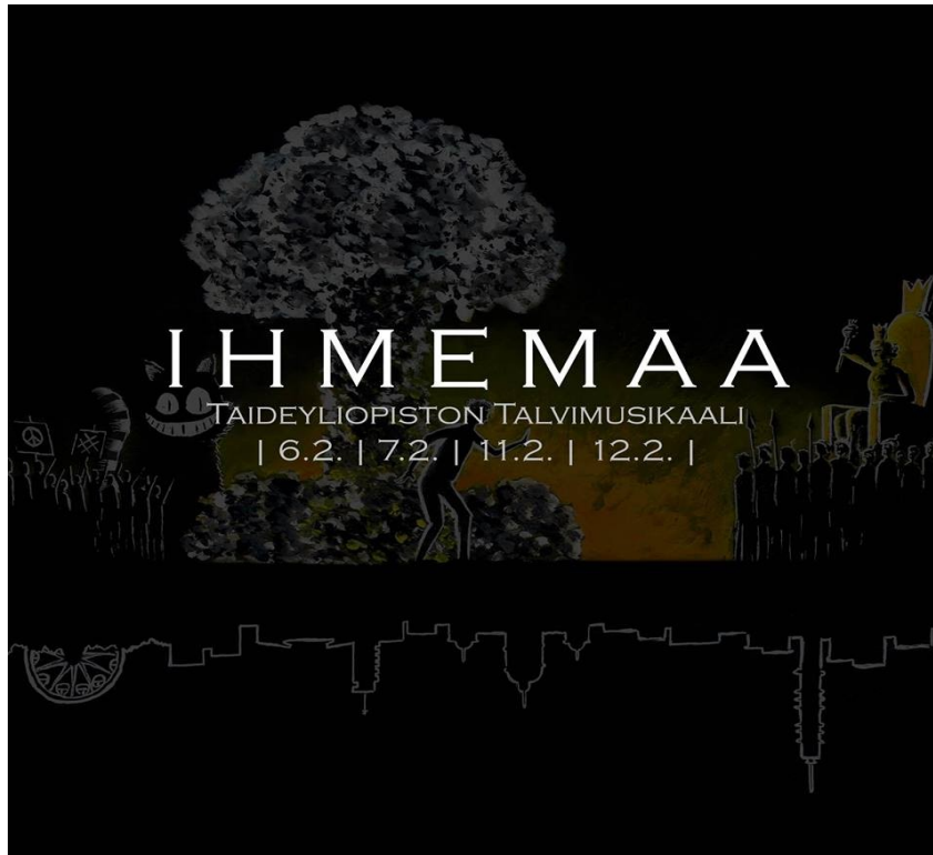
(Talvimusikaali- Ihmema )