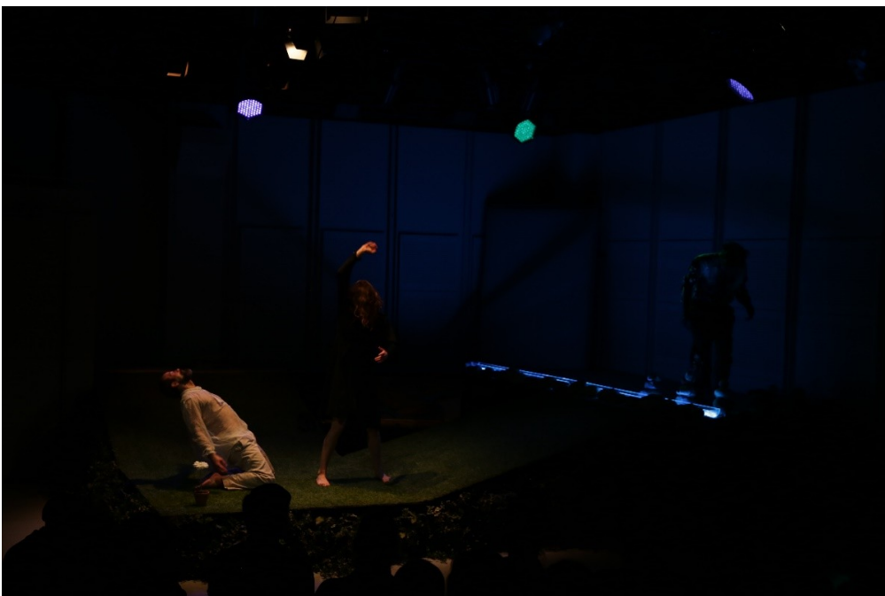
(Hiroshima, rakastettuni esitys.)