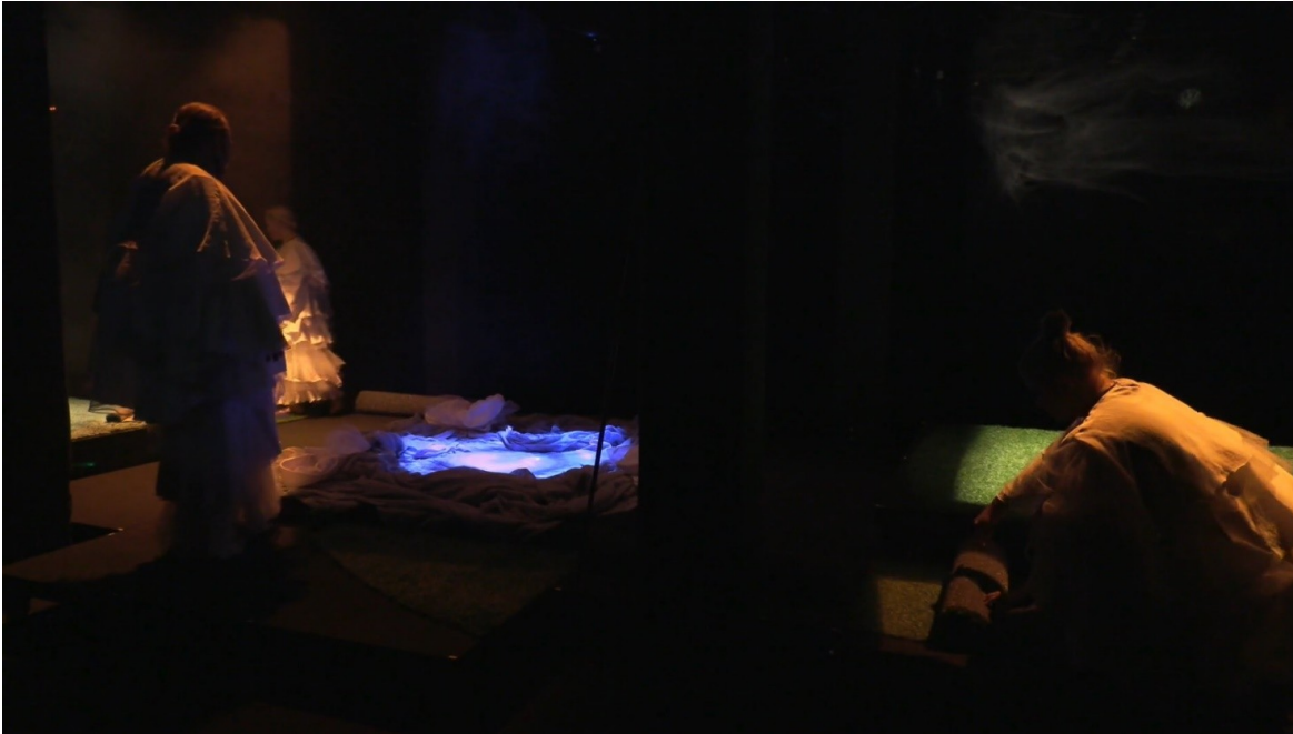
( Polku esitys. Kuva: Michael Panula-Ontto)

Vaikka taiteellisesti esitys ei kuulemani mukaan vastannut yleisön odotuksia, sen ollessa liian ”outo, erikoinen”, niin olen kokenut Polku -produktion yhdeksi tärkeimmistä prosesseista, sillä sen kautta pääsin toden teolla oppimaan asioita jotka koen tulevaisuudessa relevanteiksi. Ymmärsin myös production kautta, että aina se taiteellinen päämäärä ei ole se esitys mitä nähdään, vaan sitä pitäisi osata katsoa myös miten sitä on tehty, kuten ottaa huomioon ne kaikki haasteet mitä muun muassa koronapandemia oli antanut.