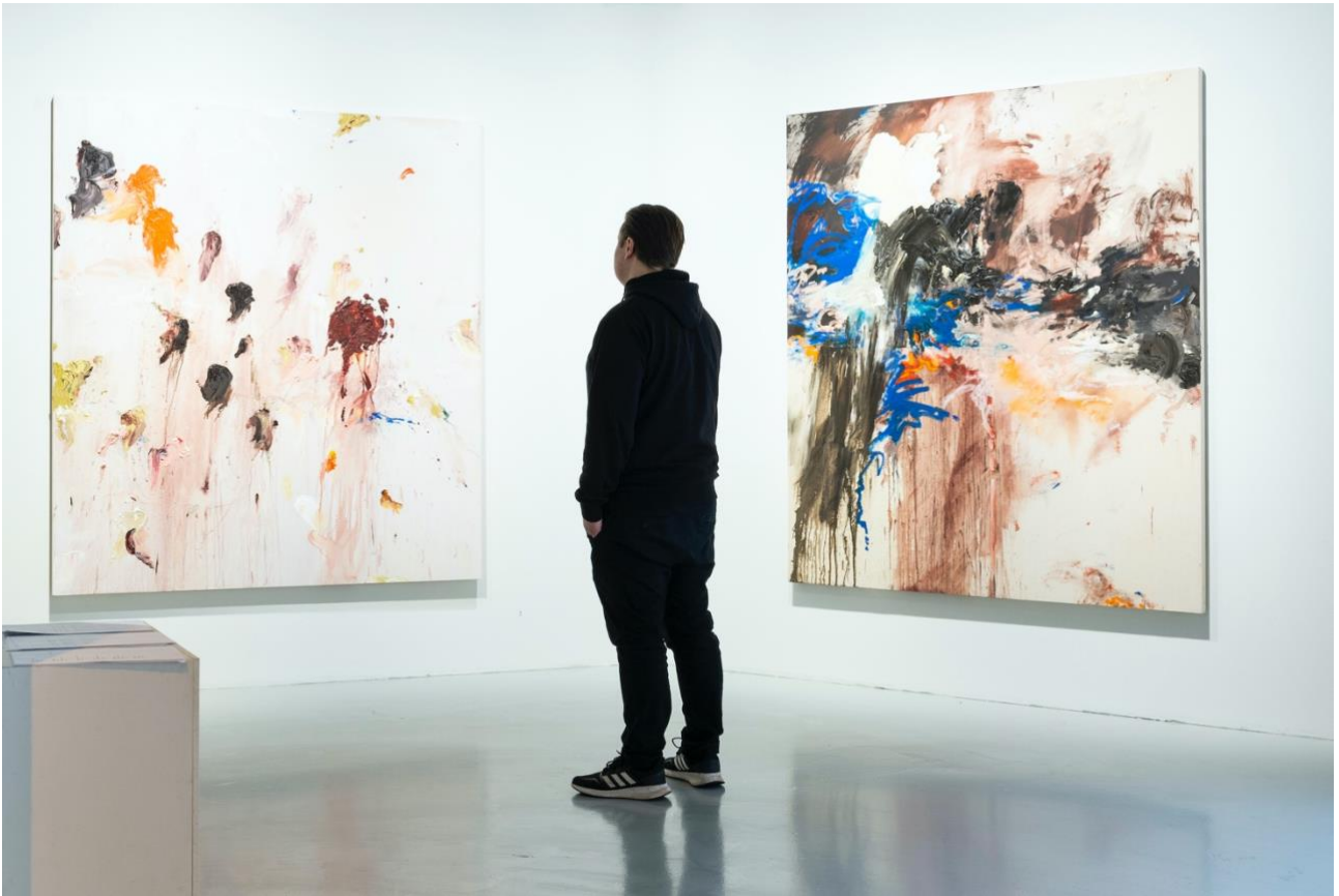
Maalaukset Bits (vas.) ja Not Trying (oik.). Minä seison keskellä.