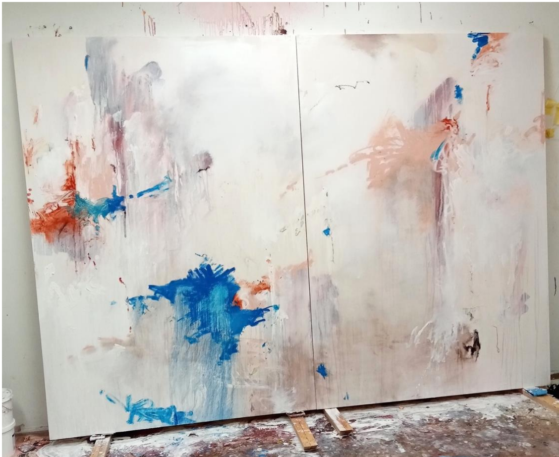
Lisää kerroksia. Kuva teoksen Eternal Back Pain tekoprosessista.

41. Ensimmäiset kerrokset ovat usein maalauksieni työläisimmät vaiheet. Kerrokset rakentuvat hitaasti, ja niiden täytyy kuivua aina ennen seuraavaa kerrosta. Jossain vaiheessa lisään maalauskerrokseen hieman hiekkaa, pientä kangassilppua ja vanhoja teipinpaloja. Nämä elementit ovat viitteitä rappauksista ja murenevista seinistä julkisessa tilassa, mutta samalla ne ovat jälkiä minun työhuoneeltani. Maalauksessa ne toimivat enimmäkseen vain struktuurina. Käsitteelliset viittaukset ovat oikeastaan vain minua varten, ikään kuin piilotettuja jälkiä minusta teoksen tekijänä. Näitä pieniä yksityiskohtia korostan tai häivytän lyijykynällä tai eri värisillä öljyliiduilla. Välillä saatan piirtää pieniä pisteitä ja viivoja melkein näkymättömästi maalauksen ensimmäisiin kerroksiin. Ne häviävät valumien, roiskeiden ja pesujälkien joukkoon, samalla korostaen niitä hennosti. Luon tällä tavoin illuusiota struktuurista ja kulumisesta.