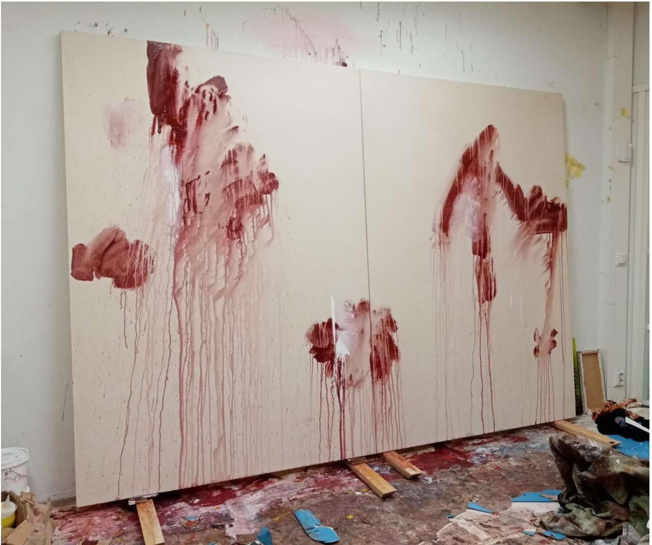
Ensimmäinen maalattu kerros teokseen Eternal Back Pain .

39. Ilman viimeisen opintovuoden ja aikaisemman maisterinäyttelyni valintoja ei olisi ollut mitään mitä järjestelmällisesti suorittaa. Vuoden 2020 maalausprosessi oli loppujen lopuksi niin intensiivinen, että siinä tapahtui koko henkilökohtaisen taiteentekohistoriani suurin harppaus. Koin kasvaneeni tietoisesti taiteen tekijäksi. Voisi sanoa, että ennen sitä olin onnistunut, ainakin maalauksissa, puolivahingossa tai että maalaukseni olivat vain eleitä eivätkä loppuun asti ratkaistuja teoksia. Syksyn ja talven 2020–2021 maalasin harjoitellen. Epäonnistuen ja onnistuen. Määrällisesti teoksia syntyi enemmän kuin koskaan aikaisemmin, noin kaksikymmentä, ja neljä niistä päättyi maisterinäyttelyyni. Tämän ansiosta