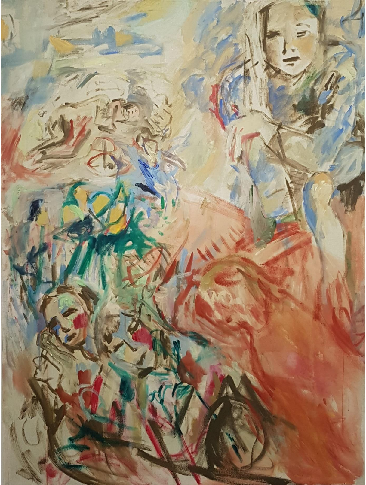
Niityllä, 2021, keltuaistempera sekä öljy (vesiliukoinen ja perus), n. 113 cm x 150 cm, Kuva: Shirin Hotta