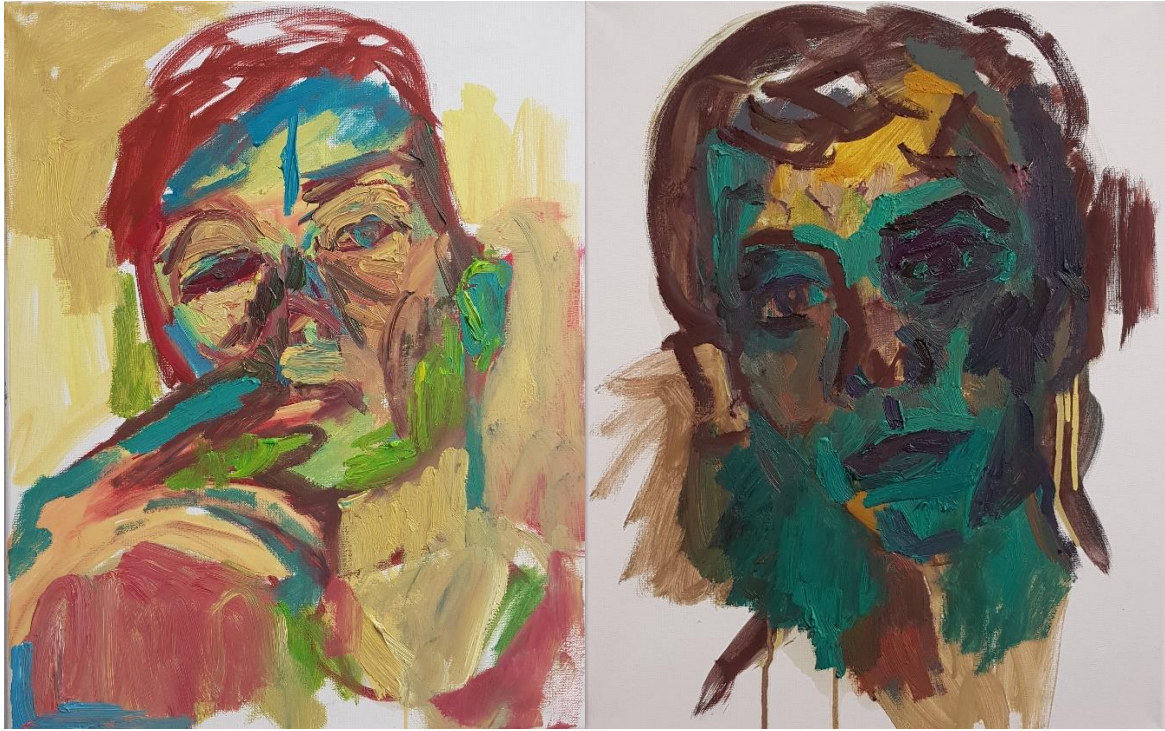
Mies 1 , 2021, vesiliukoinen öljyväri sekä kananmunatemperra, 40 cm x 50 cm (oikea), Mies 2 , 2021, vesiliukoinen öljyväri sekä kananmunatemperra, 40cmx50cm (vasen)