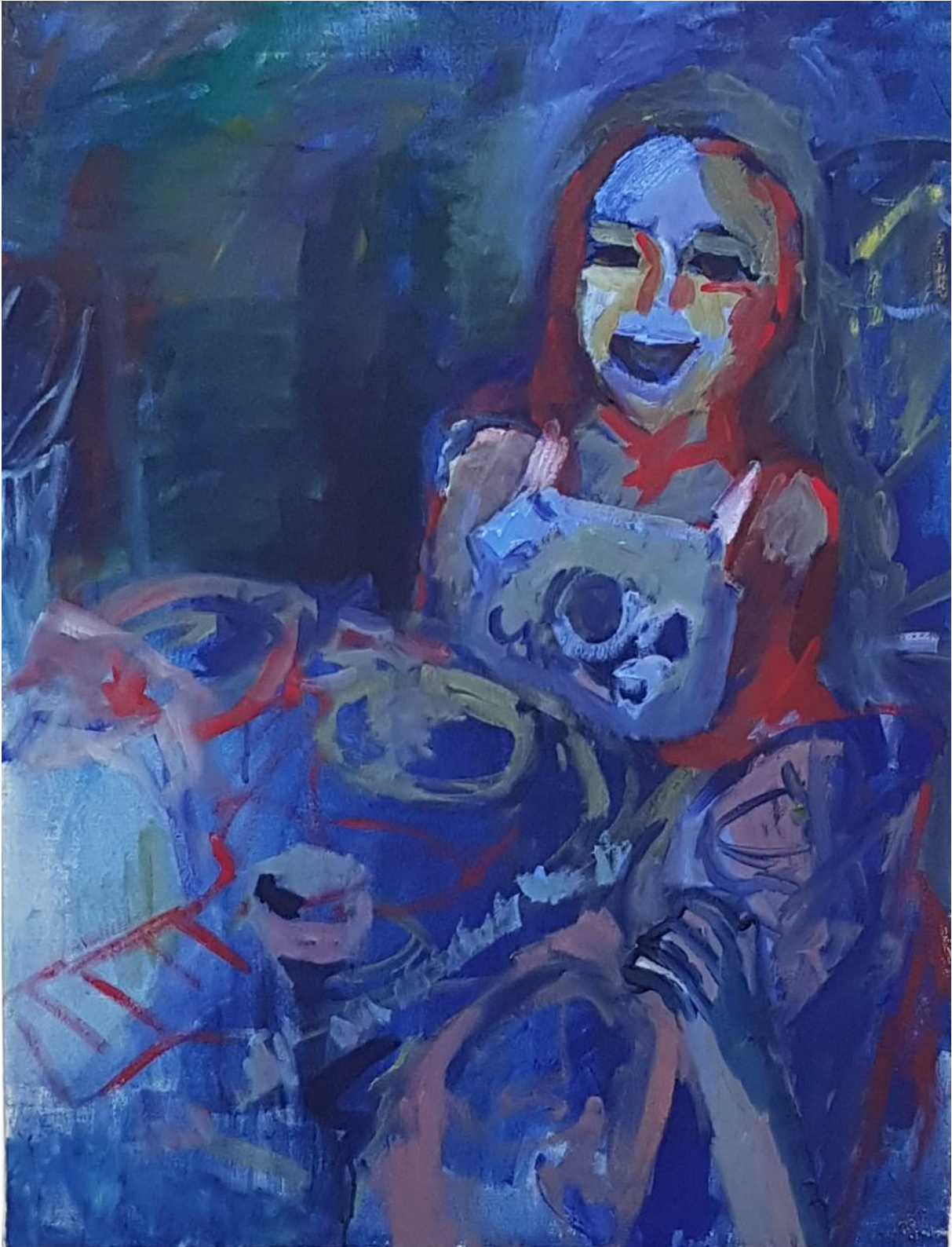
Nauru, 2021, keltuaistempera sekä öljy (vesiliukoinen ja perus), kankaalle, 65 cm x 84 cm.