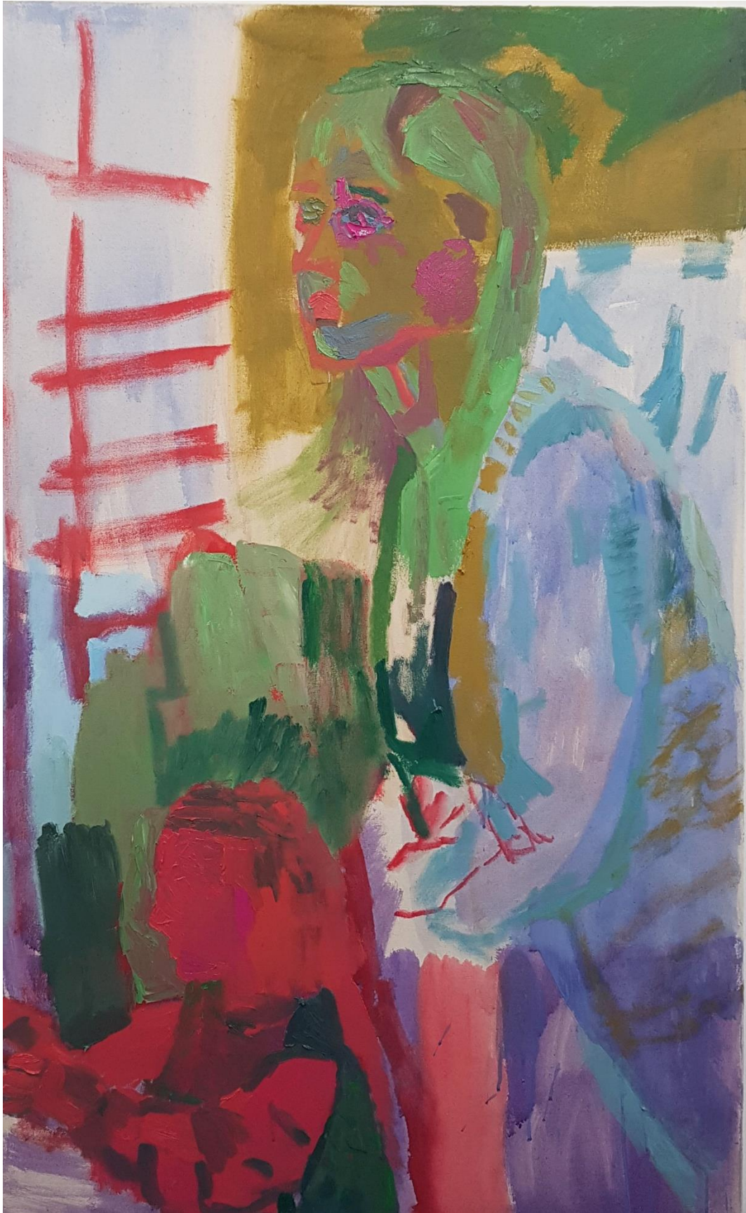
Äiti ja minä , 2020, vesiliukoinen öljyväri sekä kananmunatempera, sekä mahdollisesti kaseiinitempera, 80 cm x 125 cm