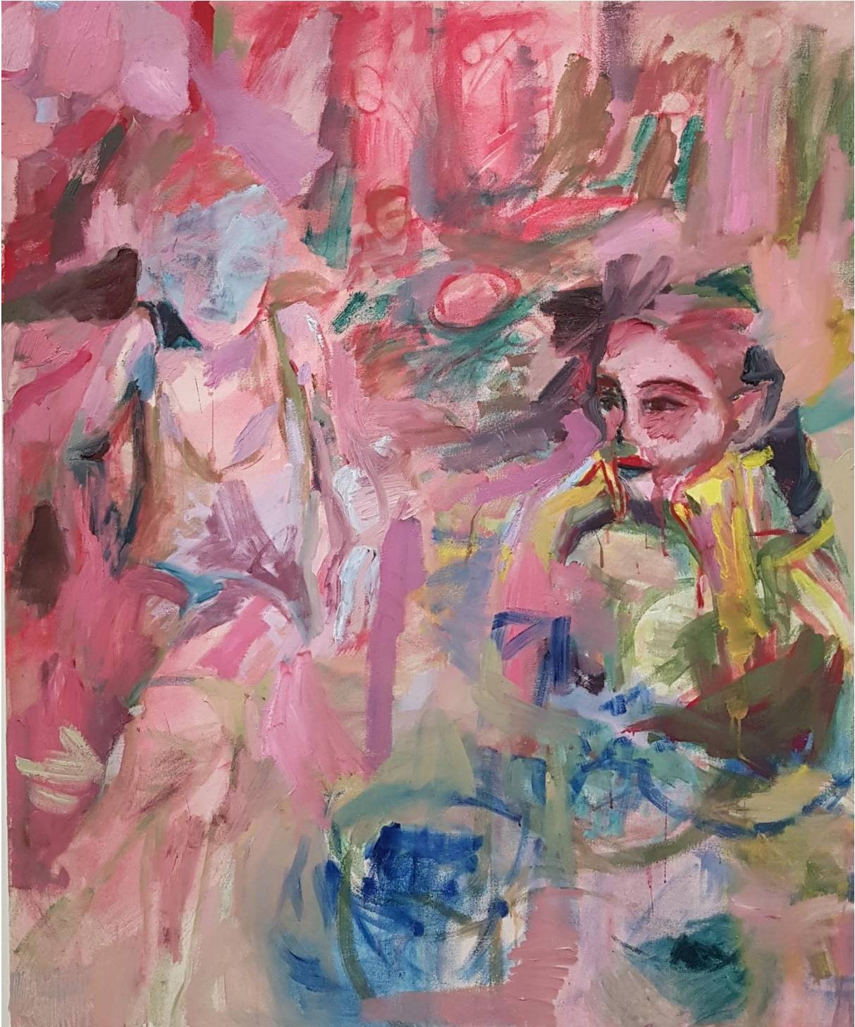
Vaaleanpunainen nainen, 2021, keltuaistempera sekä öljy (vesiliukoinen ja perus), 100 cm x 120 cm, Kuva: Shirin Hotta