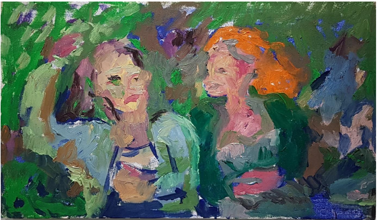
Kesäpäivä 2, 2021, keltuaistempera sekä öljy (vesiliukoinen ja perus) kankaalle, n. 60 cm x 30 cm.