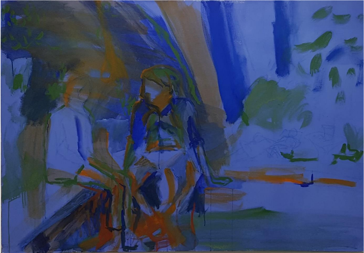
Kesäyö, 2021, keltuaistempera sekä öljy (vesiliukoinen ja perus) kankaalle, 130 cm x 90 cm