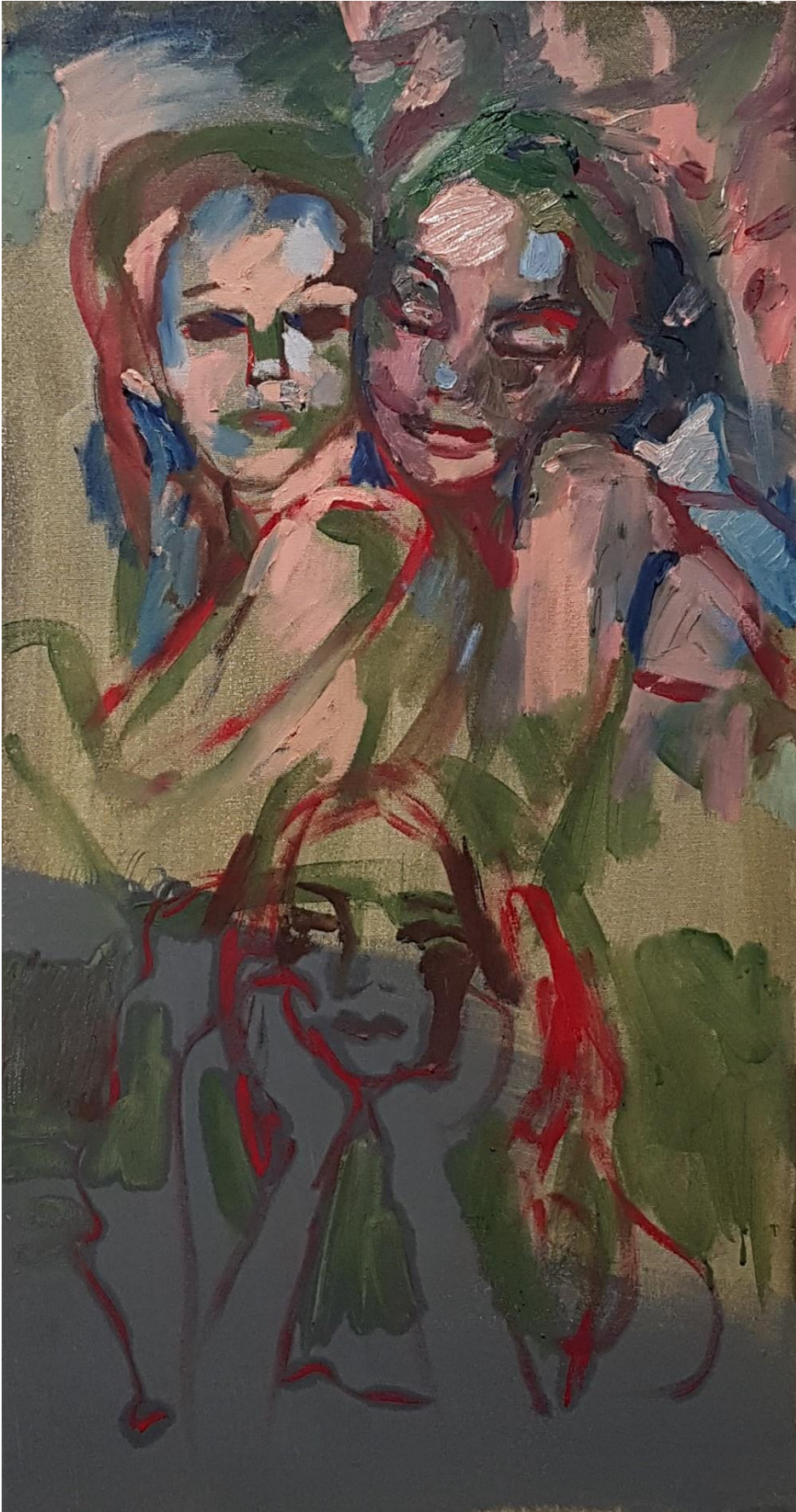
Kolmas, 2021, keltuaistempera sekä öljy (vesiliukoiset ja perus) kankaalle, 50 cm x 95 cm