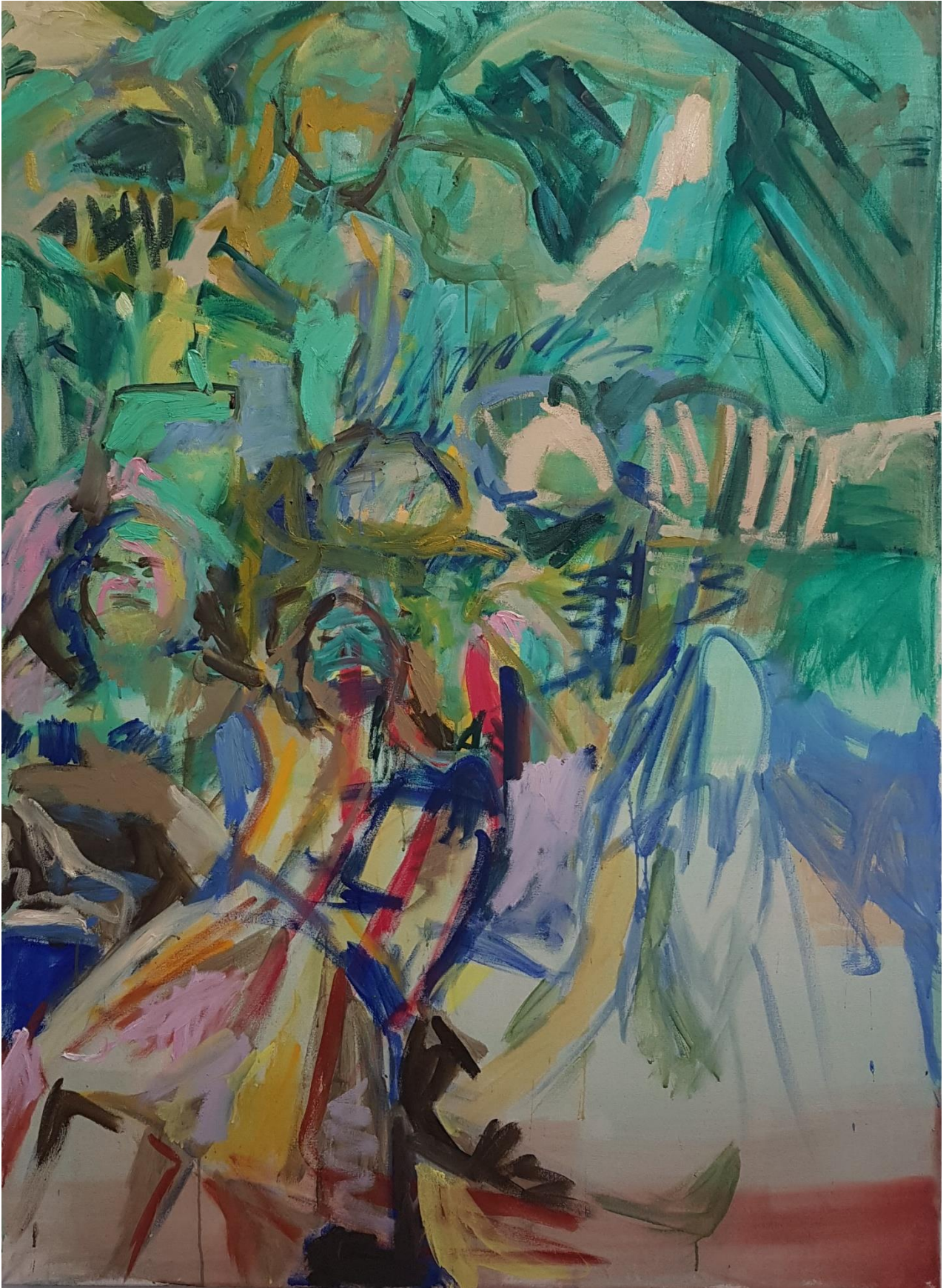
Yhdessä , 2021, vesiliukoinen öljyväri sekä kananmunatempera, 116 cm x 158 cm