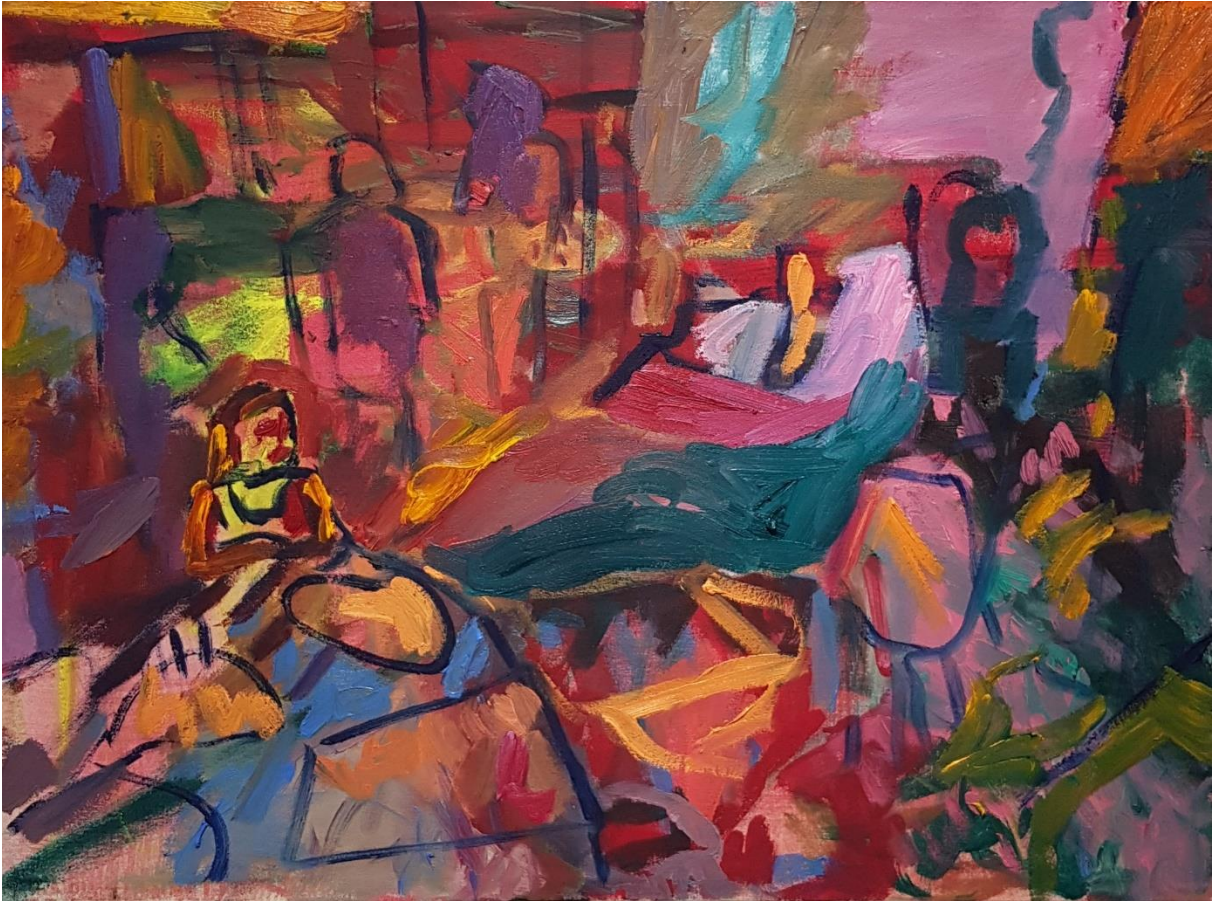
Juhlat, 2021, keltuaistempera sekä öljy (vesiliukoinen ja perus) kankaalle, n. 70 cm x 53 cm, Kuva: Shirin Hotta