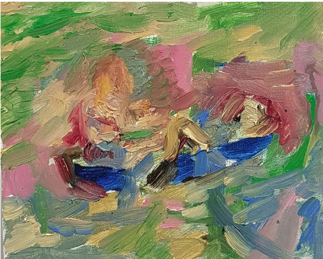
Kesäpäivä 1, 2021, keltuaistempera sekä öljy (vesiliukoinen ja perus), 25 cm x 21 cm