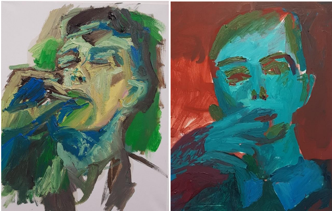
Mies 3 , 2021, vesiliukoinen öljyväri sekä kananmunatemperra, 40 cm x 50 cm (vasen), Aviomies , 2021, vesiliukoinen öljyväri ja kaseinitemperra, 40cmx50cm (oikea)