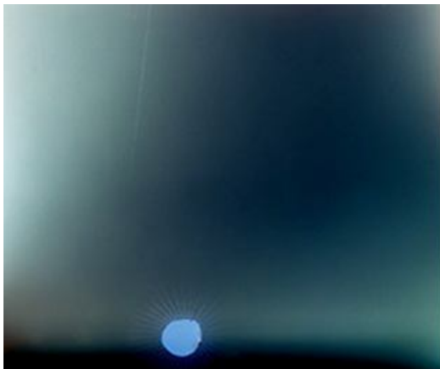
Kuva 3: Taivas