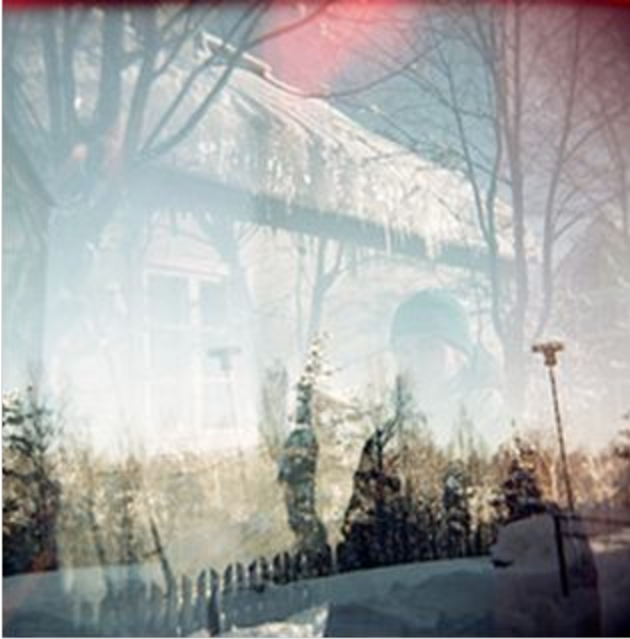
Kuva 5: Arabia talvella