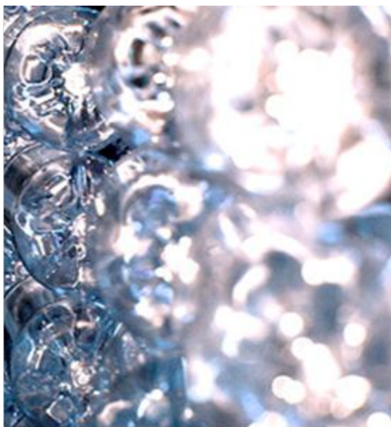
Kuva 4: pullot