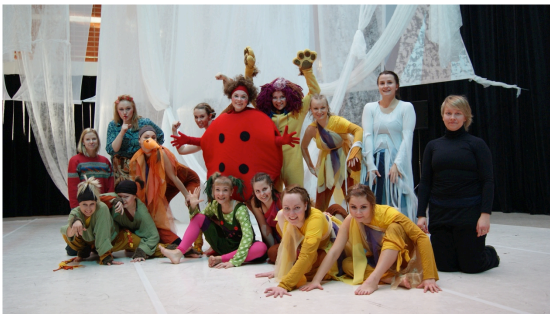
KUVA 2. Viltti Hukassa teoksen tekijät vuonna 2010

Jotta valmis ja menestyksenkäs prosessi saadaan tuotettua, vaatii se tekijöiltään innostuneisuutta ja ryhmätyötaitoja. Molempien, Bang Bang! :n ja Viltti Hukassa lähtökohtina olivat elämyksellinen ja työryhmälle uusi tapa tehdä taidetta. Kiinnekohtana molemmille teoksille oli tarjota yleisölle mahdollisimman kokonaisvaltaisia kokemuksia. Työryhmien innostuneisuuden kautta teokset saivat kiitettävästi jatkumahdollisuuksia.