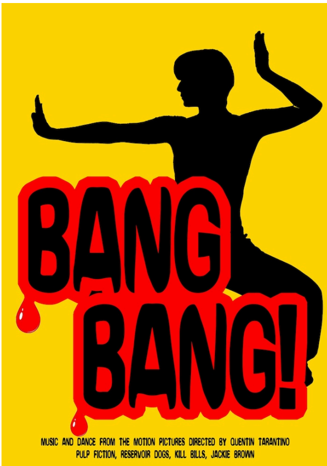
KUVA 1. Bang! Bang! musiikki- ja tanssiteoksen juliste

Valmistuin vuonna 2012 Savonia ammattikorkeakoulusta tanssinopettajaksi. Tein opinnäytetyöni otsikolla Tuottajana teoksessa, Case: Bang Bang! . Opinnäytetyö tutki Bang Bang! -teoksen tekijöiden tuotannollista prosessia jälkikäteen. Bang Bang! esitettiin neljän Savonia-ammattikorkeakoulun Musiikin- ja tanssin yksikön opiskelijan opinnäytetyönä.