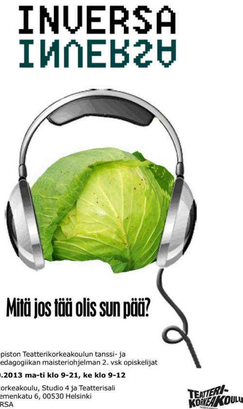
KUVA 3. Taiteellispedagogisen INVERSA -tapahtuman juliste

INVERSAN prosessi oli niin tiivis ja raskas, että meille ei jäänyt tekijöinä aikaa toteuttaa onnistunutta tapahtuman tuottamista. Tämä on valitettavaa, sillä juuri tällaisessa taidepedagogisessa tapahtumakonseptissa tanssinopettajalla on mahdollisuus yhdistää taidepedagogiikka ja tuotannonharjoittelu toisiinsa. Meille oli onneksi osoitettu tuottaja, mutta informaatiokatkosten ja rajallisen ajan takia emme saaneet tekijöinä välitettyä tuottajalle toivomaamme kohderyhmää saati tuotanto ideoita. Tapahtuma olisi ansainnut suuremman kävijämäärän ja oikeat kohderyhmät tarvitsemansa informaation ajoissa. Tällaisen konseptin luominen ja kehittäminen oli uusi innovaatio, ja juuri sellaista tanssinopettajien tapahtumatuottaminen onnistuessaan voisi olla.