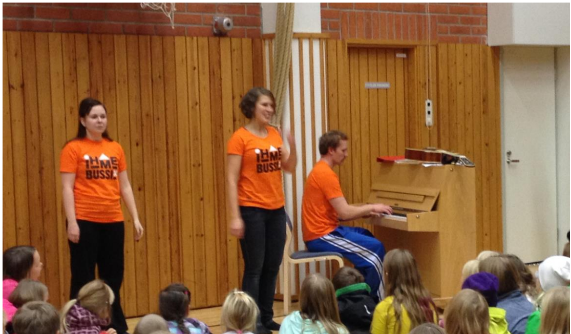
Kuva 1. Ihmebussi X:n rytmi ja liike -työpajaa ohjaamassa

Halusimme myös, että oppilaat tekevät ja keksivät mahdollisimman paljon itse. Opettajina ja ohjaajina autoimme heitä, jos tarve vaati. Perimmäinen ajatus kuitenkin oli, että jokainen saisi kokea keksimisen riemun ja saisivat kokemuksen siitä, että tämän me teimme yhdessä ryhmän kanssa yhteistyössä.