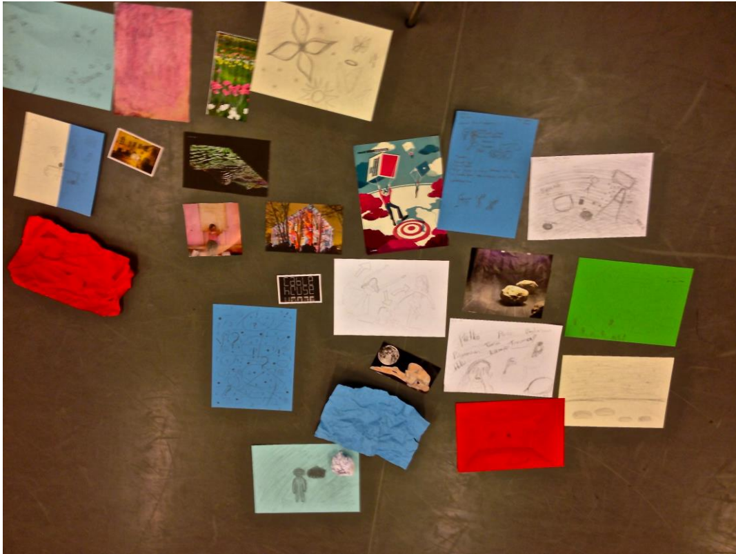
Kuva 3. Oppilaiden tekemiä kuvataideteoksia liike ja kuva -tunnilta

Liike ja teatteri -kerralla lämmittelimme erilaisilla tanssiaskelilla. Ensimmäisenä harjoituksena teemaan liittyen kokeilimme, miten tunteet näkyvät liikkeenä. Annoin oppilaille tunnetilan, jota he lähtivät toteuttamaan liikkeen keinoin kuten esimerkiksi viha, rakkaus, ilo, pettymys ja suru. Seuraavassa tehtävässä jokainen oppilas sai valita jonkin vaatekappaleen, jonka kautta he lähtivät hakemaan hahmoa ja sitä kuinka hän liikkuu ja tanssii. Kun jokainen oli löytänyt sellaisen, kokeilimme erilaisia kohtaamisia eri hahmojen välillä: miten he tervehtivät ja keskustelevat pelkällä liikkeellä.