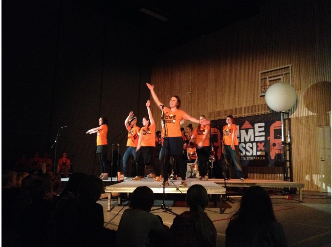
Kuva 2. Ihmebussi X –esitys

pienryhmiin, joista kukin otti yhden esityksen osa-alueen vastuulleen. Osa alkuperäisistä ajatuksista jäi esitykseen, osa putosi pois kokonaan. Lopulta kokonaisuus tuli valmiiksi yllättävän lyhyessä ajassa, vaikkakin sen kokoaminen vaati paljon yhteistyötä ja kompromissitaitoja koko ryhmältä.