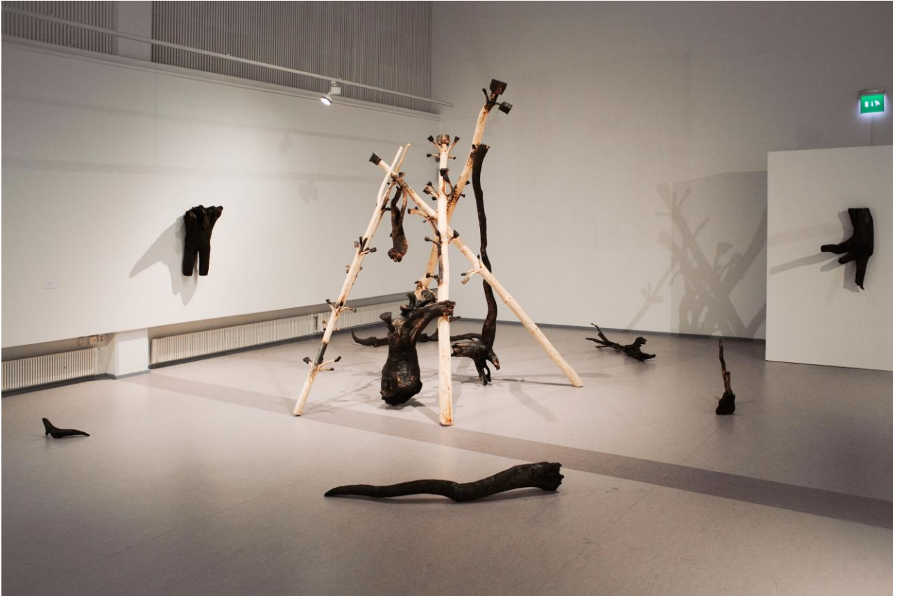
Riippuvaa lihaa 2014