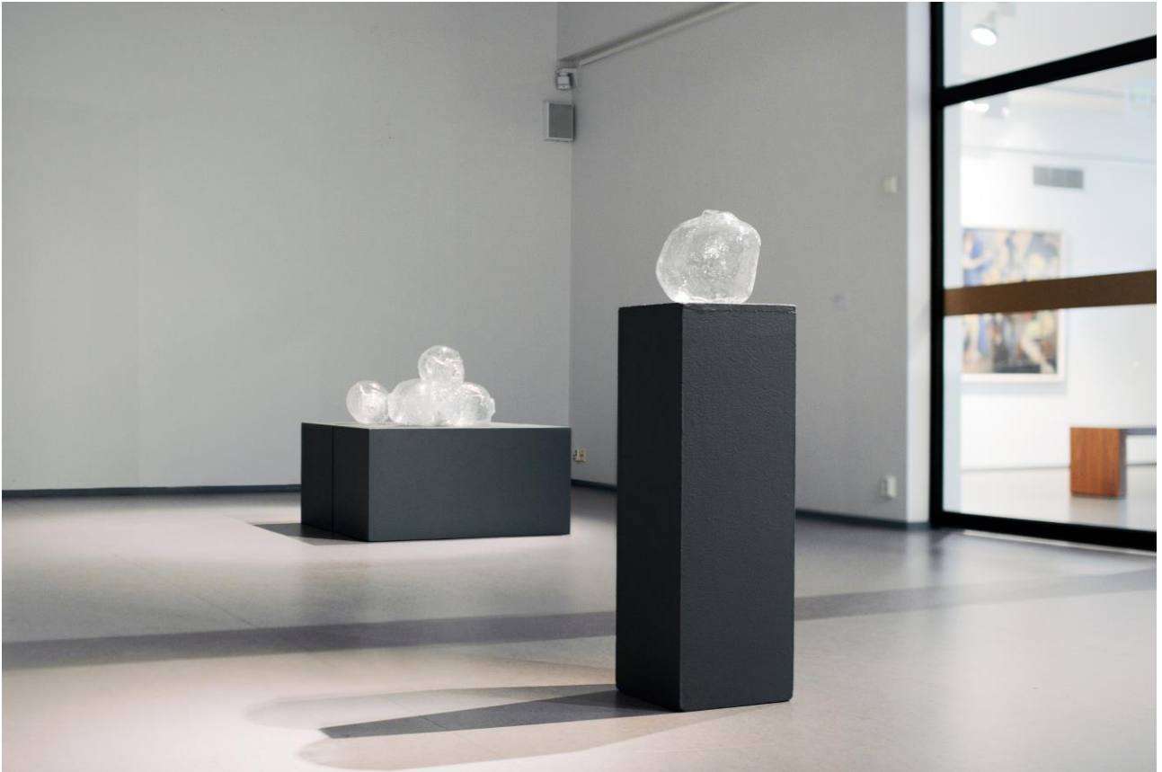
Still Life 2015