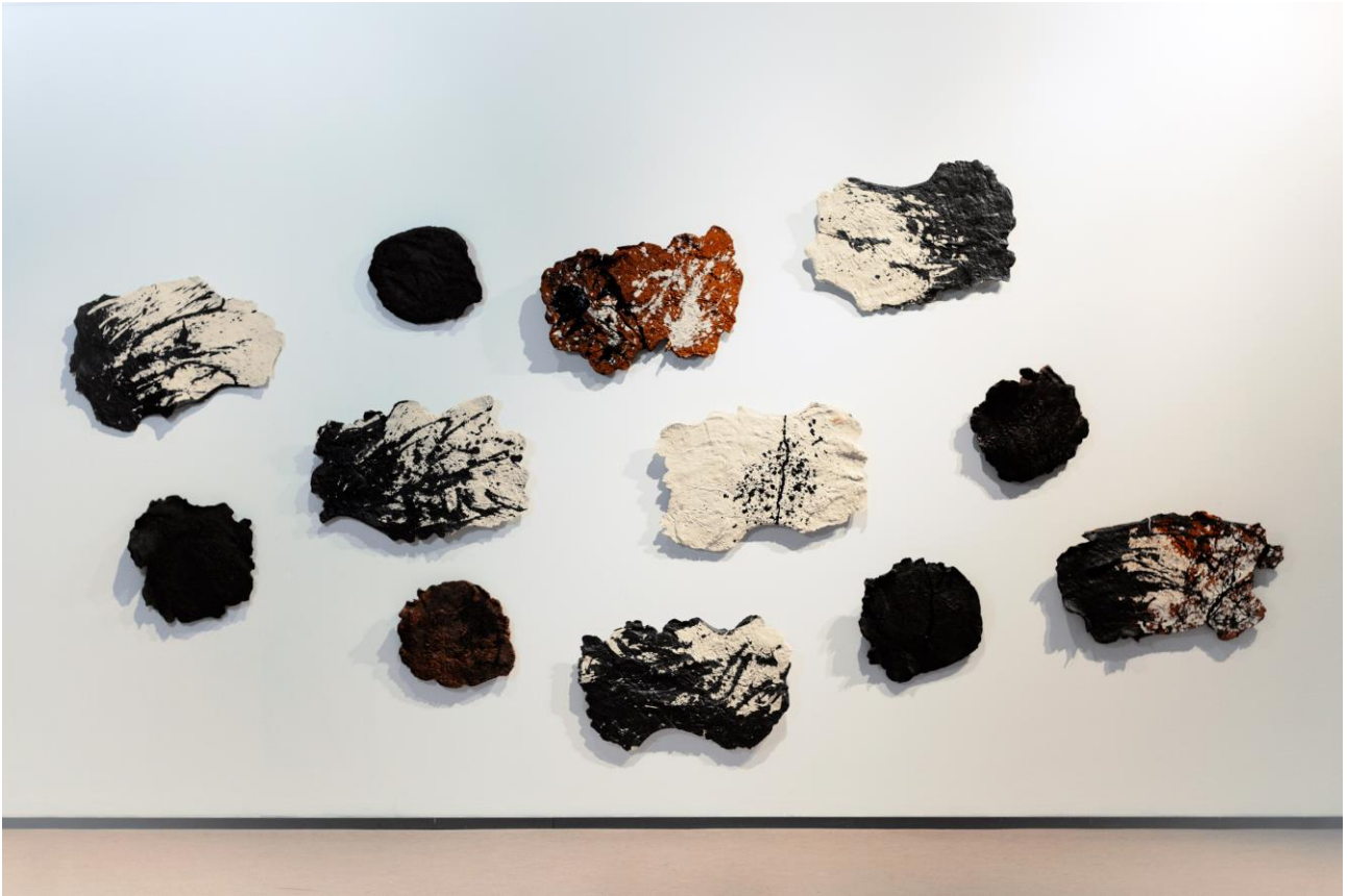
Lätäköiden äärellä 2015