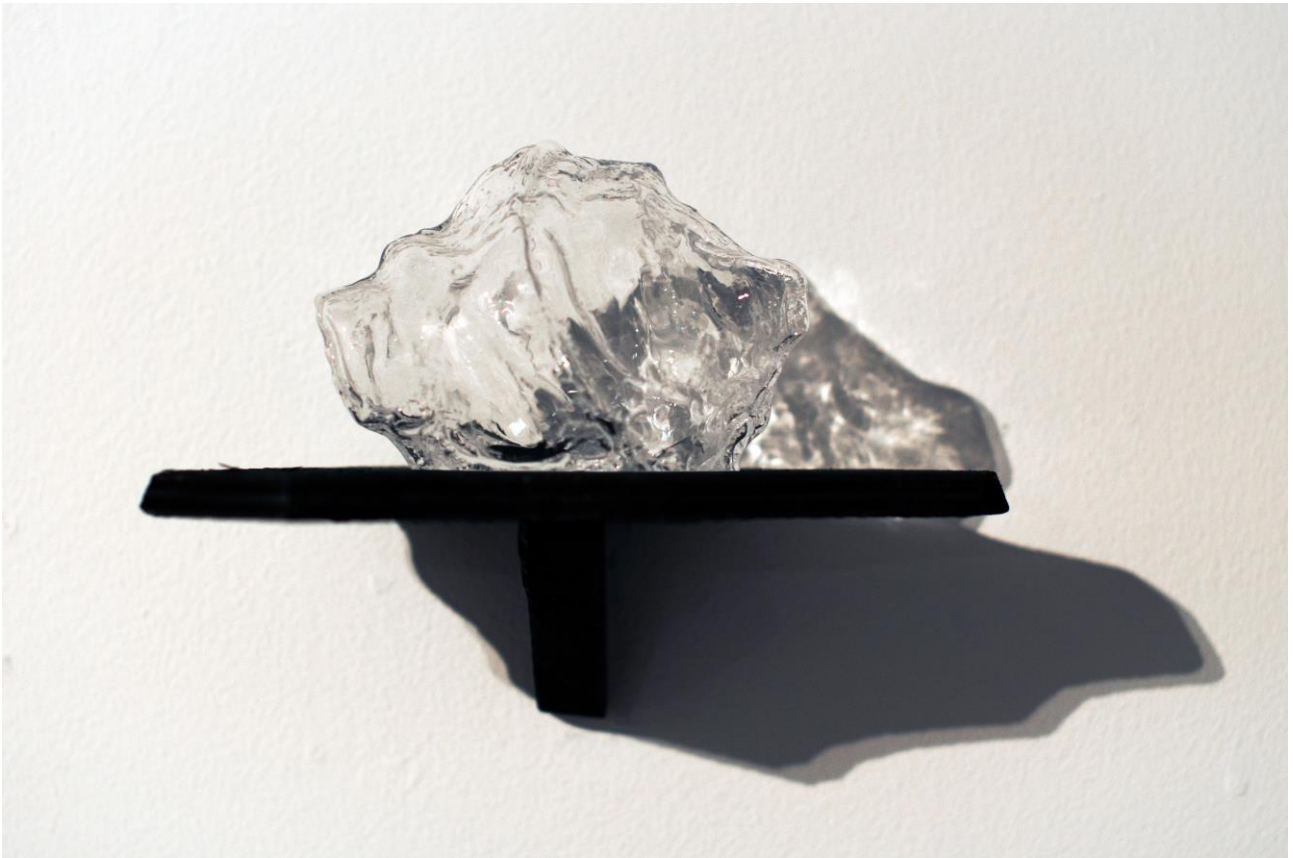
Still Life 2015 (yksityiskohta)