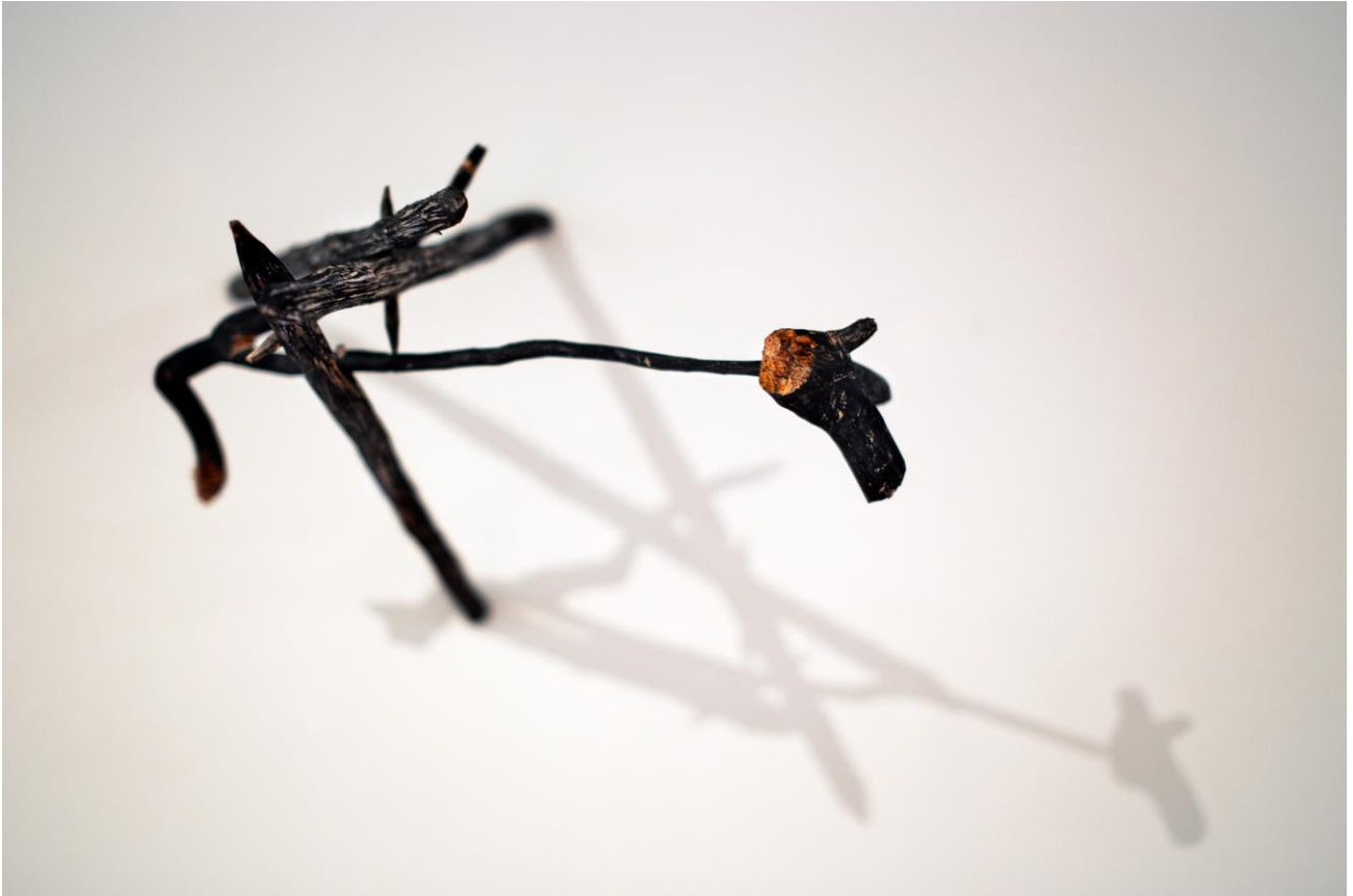
Luonnos (Con Amore) 2014