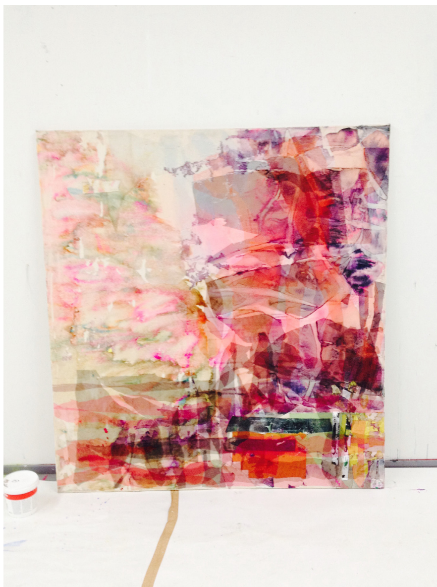
Tiger Bay , 2016, 140x130cm, kollaasi kankaalle