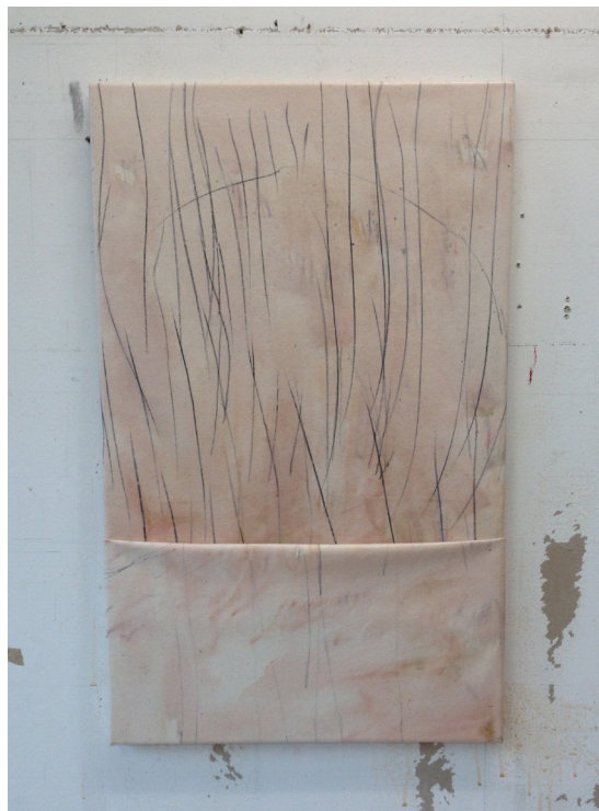
In My Pocket , 2016, 55cm x 39cm, sekatekniikka kankaalle