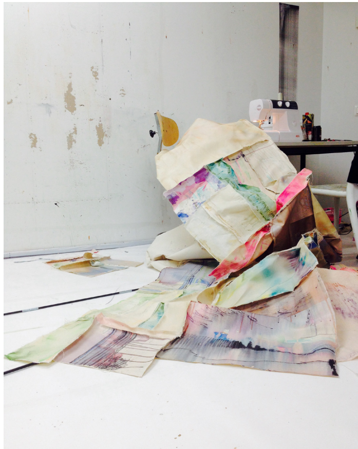
Prosessia työhuoneella, 2017