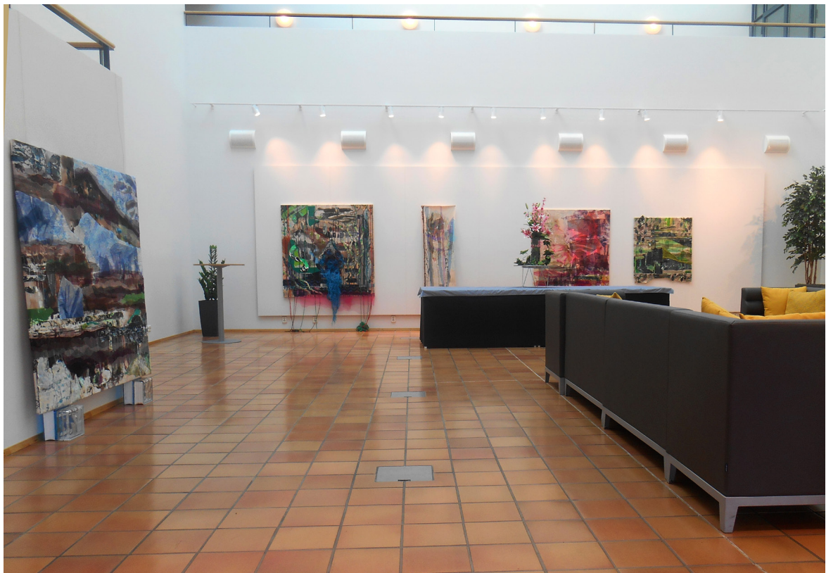
Tiger Bay -näyttelyssä, Allergiatalossa, Helsinki, 2016