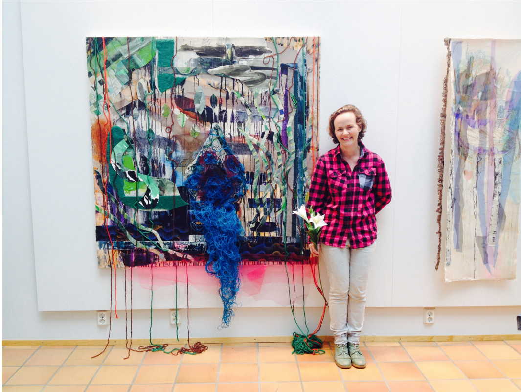
Taiteilija teostensa vieressä. Vas. Indian Flavour , 2015, 150cm x 150cm, kollaasi kankaalle ja Kiss And Make Up , 2015, 160cm x 52cm, kollaasi kankaalle