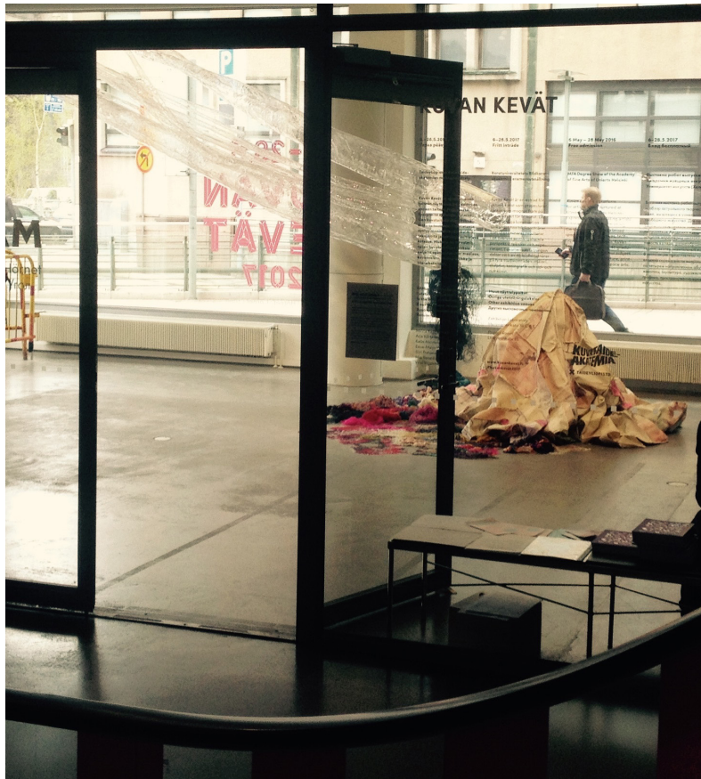
Kuvan kevät, 2017, HAM kulma