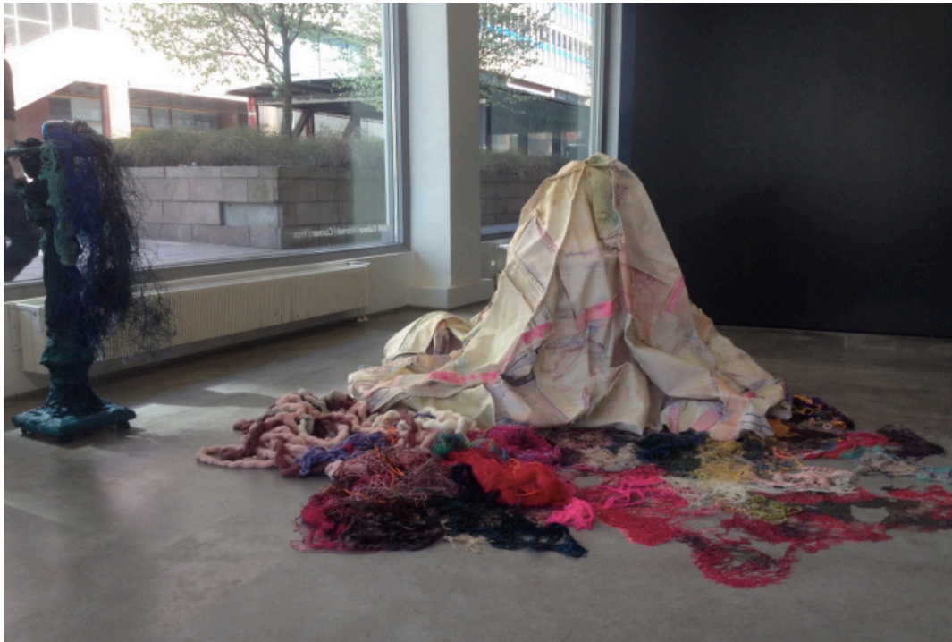
After the Rain There Will Be a Better Day , 2017, 140cm x 200cm x 200cm, HAM kulma