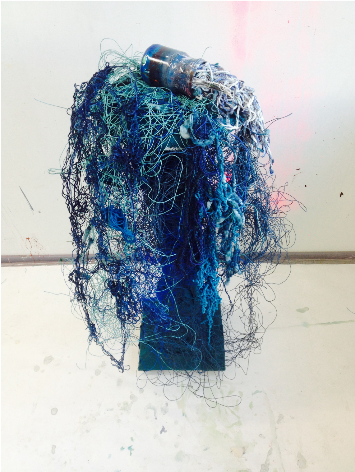
Sininen yrjö, Vomit Turquoise, 2017, 140 cm x 40 cm 40 cm, tekstiiliveistos