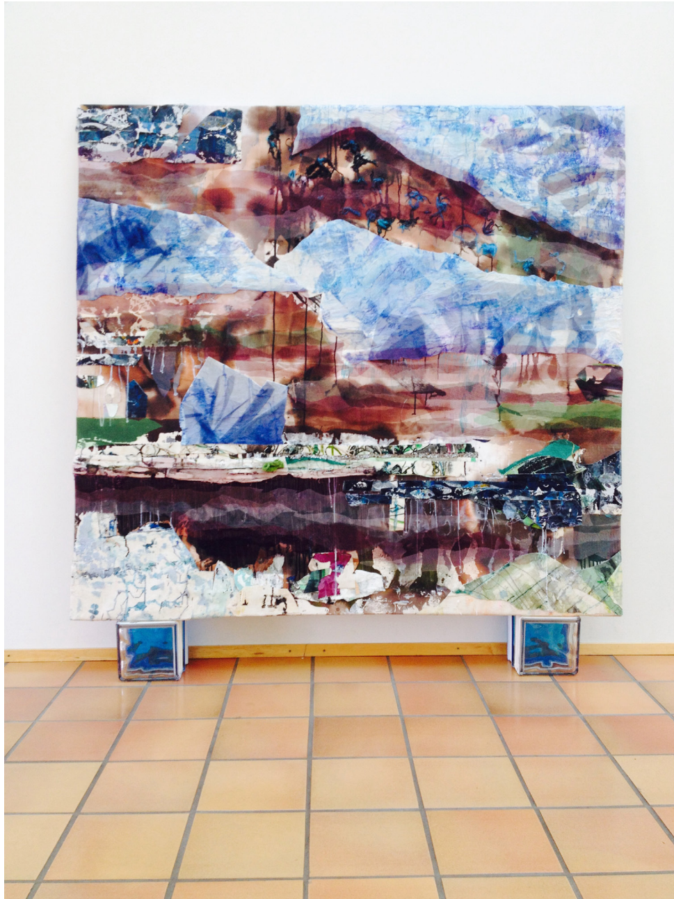
Paluu Siniselle Laguunille , 2016, 160cm x 170cm, kollaasi kankaalle