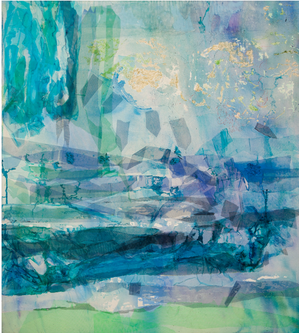
River , 2016, 146 cm x 132 cm, kollaasi kankaalle (akryyli, tussi ja kangas)