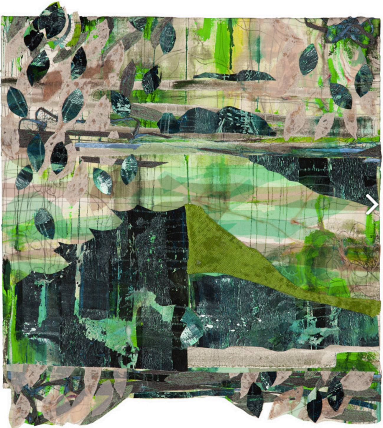
Camouflage , 111x100cm, 2015, kollaasi kankaalle