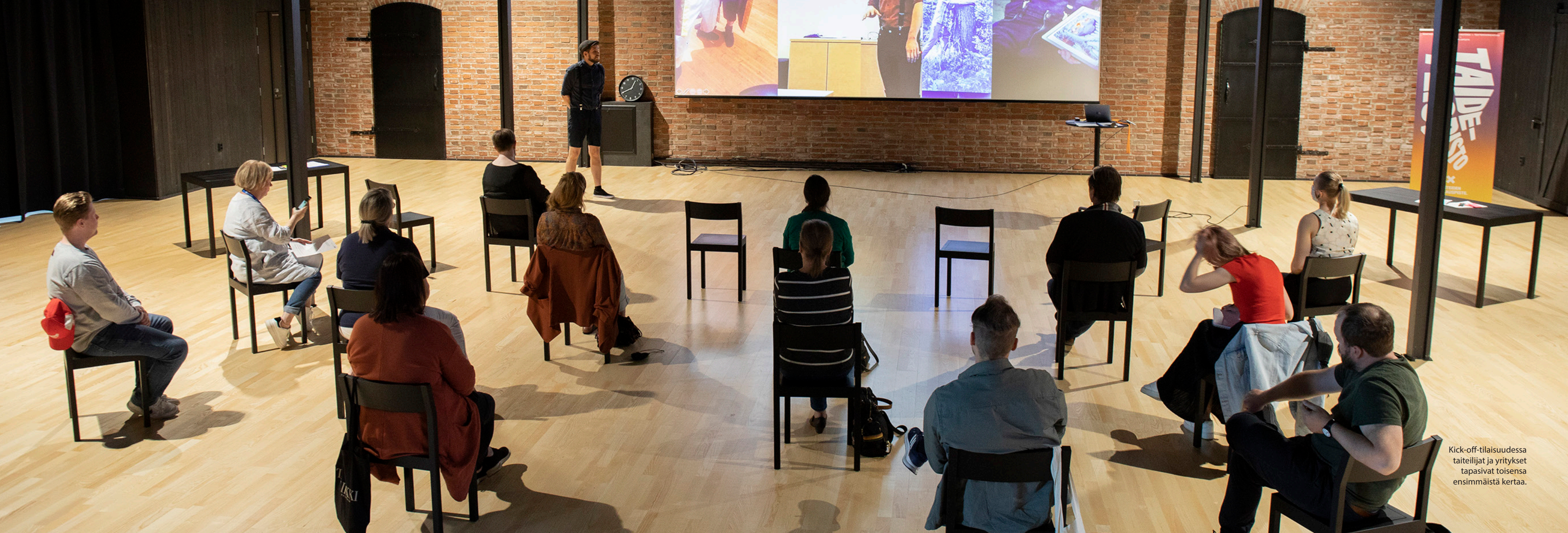
Kick-off-tilaisuudessa taiteilijat ja yritykset tapasivat toisensa ensimmäistä kertaa.