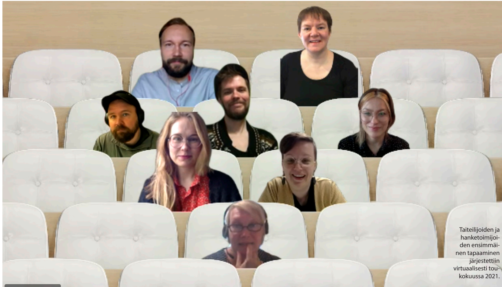
Taiteilijoiden ja hanketoimijoiden ensimmäinen tapaaminen järjestettiin virtuaalisesti toukokuussa 2021.

sekä taiteilijan näkemykset taiteellisen ajattelun hyödyntämisestä uusissa konteksteissa ja yritys yhteistyössä. Aikaisempaa kokemusta yritys yhteistyöstä ei vaadittu.