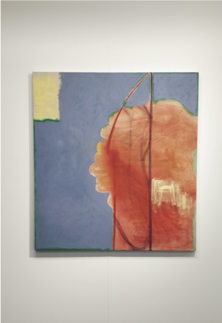
Nimetön, 2020, öljy- ja vesiväri kankaalle, 115 x 125 cm

Maalauksessa ( Nimetön, 2020 ) oleva oranssi tai punertava pilvi on maalattu vesivärillä suoraan kankaalle. Se oli ensimmäinen asia jonka tein teokseen. Maalaus on tehty kiinalaiselle pellavalle ja pohjustettu liivateliimalla, jotta kankaan oma vaaleanruskea värisävy jää näkyviin. Käytän usein maalausteni pohjustamiseen pelkkää liimaa, koska en halua peittää kangasta kokonaan. Koen, että maalauskangas itsessään ja sen kiinnittäminen kiilapuihin, on jo ensimmäinen askel kohti lopputulosta. Kankaan oma väri määrittää jo maalausta – se tuo siihen oman vivahteensa. Ruskea pellavakangas on erivärinen kuin esimerkiksi vaaleahko puuvilla, ja mielestäni sillä on suuri ero, että kummalle maalaa. Kiinalainen pellava kangas, jota sai Kuvalta ilmaiseksi, on väriltään vaaleanruskeaa. Se oli aavistuksen vaaleampaa, kuin pellavakangas, jota olen yleensä käyttänyt. Halusin jättää tähän maalaukseen ”tyhjiä kohtia”, joista katse pääsee kulkemaan aina kankaaseen asti. Vesivärimaalaukselle on tyypillistä, että maalauksen valo tulee paperista itsestään, maalattujen kerroksien alta. Halusin tähän maalaukseen vastaavaa vaikutelmaa ja olikin luonteva tapa aloittaa maalaus vesivärillä. Olin hiukan ennen tätä maalausta alkanut kokeilemaan työhuoneellani vesivärimaalausta suoraan kankaalle. Pidän siitä, miten ohut vesiväri imeytyy kankaaseen, jättäen kankaan tekstuurin ja sävyn näkyviin. Se tuo maalaukseen herkkyyttä. Minulle tämä herkkyyks oli