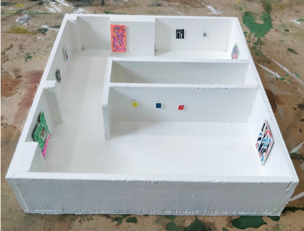
Pienoismalli, jonka rakensin Project Roomin näyttelyhakua varten.

Hain näyttelyaikaa Project Roomin takatilaan, opinnäytteeni toiselle julkiselle esiintymiselle. Koin takatilan kiinnostavana, koska siellä seinät olivat erikokoisia ja toisin kuin etutilassa, kaikkia siellä olevia teoksia ei voi nähdä samanaikaisesti. Ajattelin, että seinät voisivat rytmittää maalauksia kiinnostavalla tavalla ja maalausteni koon vaihtelu tuntui luontevalta keinolta korostaa tilan luomaa rytmiä.