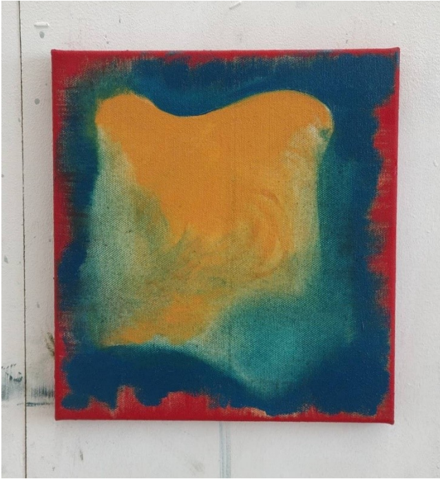
Luontopolku, 2019, öljy kankaalle, 30 x 28 cm

Maalaus, Luontopolku , oli lopputyönäyttelyideni vanhin työ ja se oli esillä aiemmassa Kuvataideakatemian ryhmänäyttelyssä, jossa olin mukana. Näyttelyn nimi oli Can't Leave Home Without It , ja se järjestettiin Splitissä Kroatiaassa 17.10. – 7.11.2019. Koin, että tämä työ kuitenkin sopi hyvin yksityisnäyttelyni teemaan, joten päädyin laittamaan sen uudestaan esille Project Roomiin. Aloitin maalauksen tekemällä kadmiumin punaiset reunat ensiksi. Väri oli koululla, itsetehty öljyvärityubi, jota halusin päästä kokeilemaan.