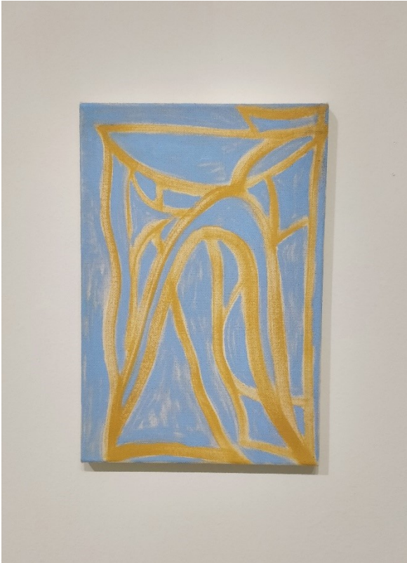
Taikametsä, 2020, öljy kankaalle, 40 x 28 cm

Taikametsä oli eräänlaista jatkoa Kuvan Keväessä olleelle vesiväriytyölle. Maalaus valmistui hyvin samankaltaisesti siten, että tein ensiksi okranväriset viivat ja sitten väritin taustan vaaleansinisellä. Maalatessani viivahässäkkää kankaalle, minulla oli sellainen olo, että maalaaminen tuntui kuin olisin kirjoittanut öljyväriä kankaalle, jälki oli kuin jonkinlaista kalligrafiaa, joka ei kuitenkaan tarkoittanut mitään. En ole koskaan aiemmin tehnyt maalausta näin vähäeleisesti. Etualalla on pelkät viivat ja yksivärinen tausta. Mielestäni tämä teos toimi keveytensä puolesta hyvin muiden Oleskelija -näyttelyssä olleiden töiden kanssa. Mainittakoon vielä, että Taikametsä on paikka Vantaalla ja maalauksen nimi on sieltä peräisin.