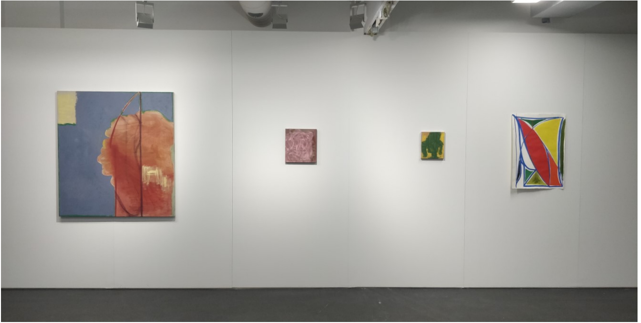
Kuvan Kevät 2020 teokseni, jotka olivat esillä Exhibition Laboratory B:ssä.