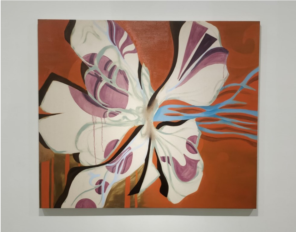
Today, No Stress, 2020, öljy kankaalle, 125 x 115 cm