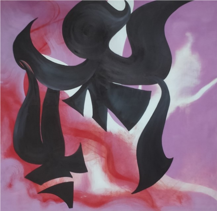
Kaiutin, 2020, öljy kankaalle, 152 x 146 cm.