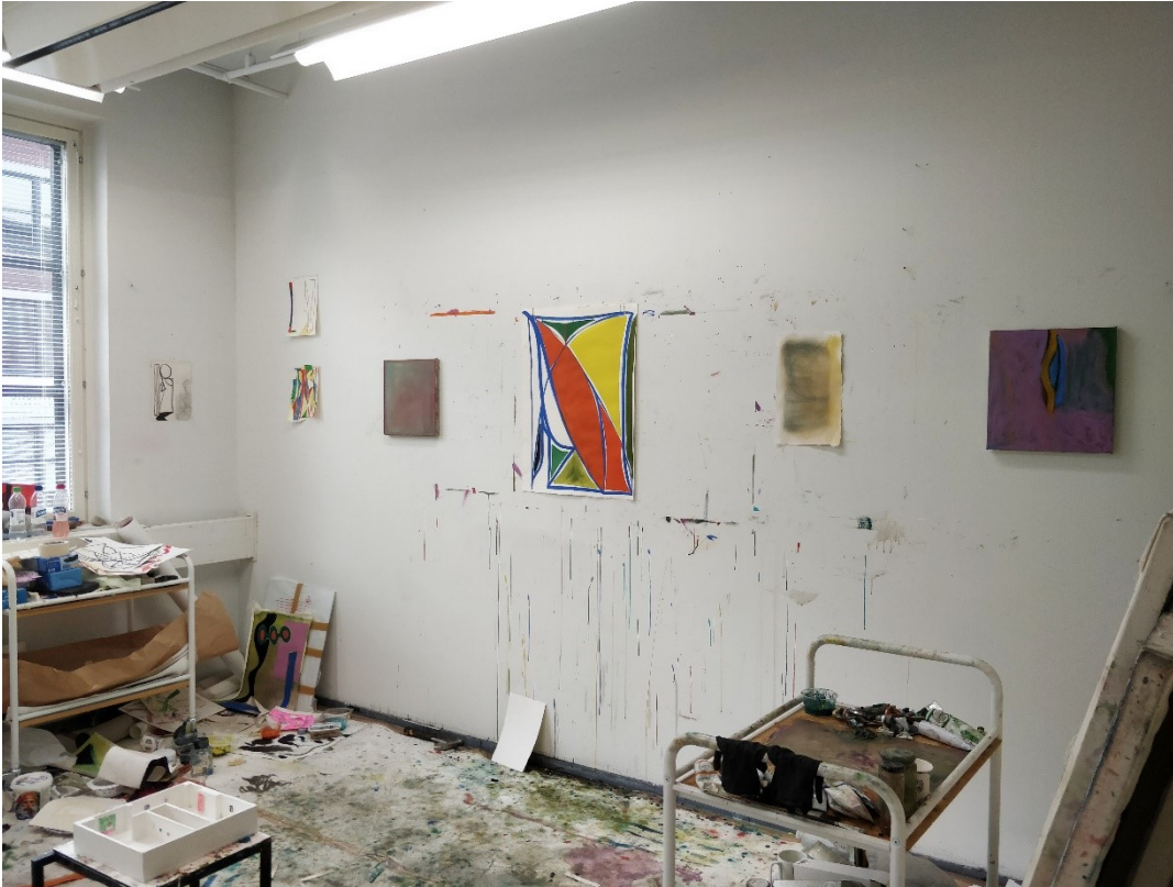
Tämä kuva on työhuoneeltani Kuvataideakatemian tiloissa Elimäenkadulta, hieman ennen Kuvan Kevät näyttelyä. Työskentelin väripintojen ja viivojen parissa.

Minulla oli Kuvan Kevät- lopputyönäyttelyssä esillä yksi vesivärimaalaus ja lisäksi myös kolme öljyvärimaalauksia. Minulla oli hidastamisen ja läsnä olemisen teemoja työskentelyssäni. Halusin, että maalaukseni aukeavat katsojalle hitaasti ja, että niiden äärelle voisi hetkeksi pysähtyä ikään kuin hengähtämään. En halunnut tehdä "äännekkäitä" vaan hiljaisia maalauksia. Äännekkäällä tarkoitan väreiltään räikeitä, voimakkaan kontrastisia teoksia. Halusin, että maalaukseni eivät hyppää gallerian seinältä kohti katsojaa, vaan ennemminkin kutsuvat luokseen. Ehkä ne ehdottavat jotain enemmän kuin huutavat. Ajattelin, että teokseni olisivat kuin hiljaista musiikkia tai ääniä metsässä, kuten puiden havinaa tai puron liplatusta, jonka äärelle voi pysähtyä hetkeksi ja hiljentyä kuuntelemaan ja katselemaan. Mietin, että voiko maalaus välittää katsojalleen rauhaa, iloa tai lämpöä. Huomasin aiemmin, että olin omaksunut työskentely tavan, jossa maalasin kauhealla vimmalla. Uusia, etenkin öljyväreillä maalattuja teoksia tehdessäni, minulla nousi ajatus ja tarve alkaa hidastaa tahtia ja halusin maalata rauhallisemmin ja hitaammin. Huomasin ilon, joka nousi itselleni tällaisesta työskentely tavasta ja aloin miettiä, että voisivatko myös teokseni välittää tätä iloa?