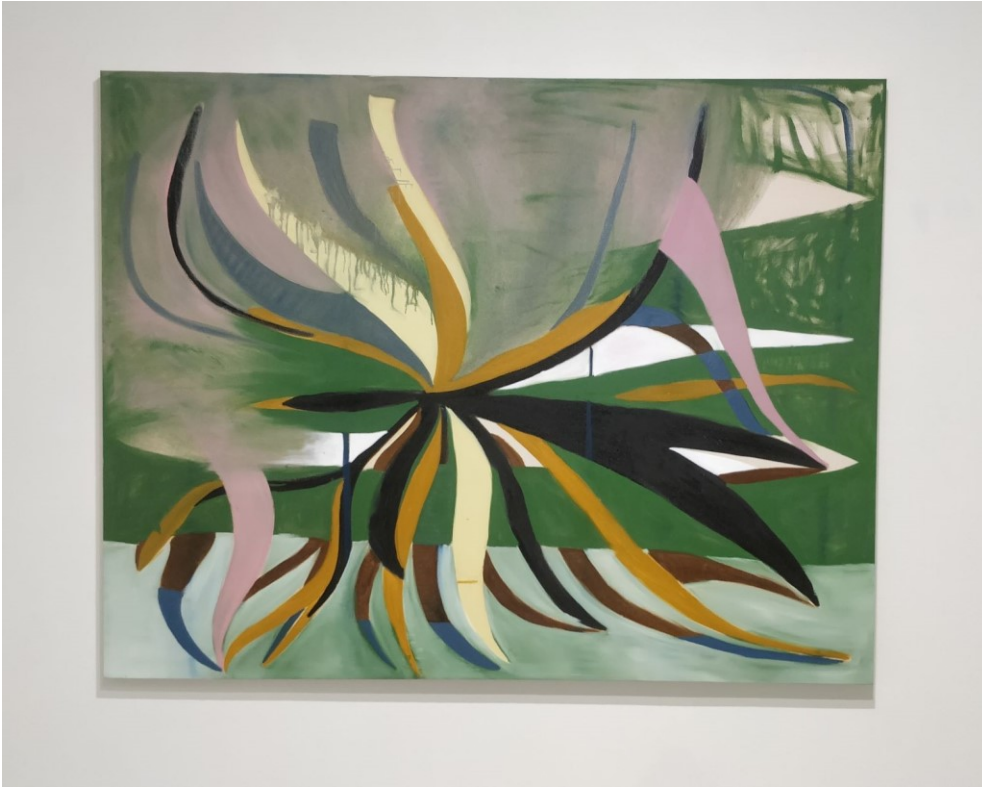
Muodonmuutos, 2020, öljy kankaalle, 140 x 180 cm

Muodonmuutos sai alkunsa okran värisistä ja mustista kasvinlehdistä. Ne syntyivät luonnoksen pohjalta, jonka tein kasvikirjasta. Maalasin kuvaa monelta eri puolelta siten, että maalaus oli ajoittain lattialla ja välillä taas seinällä. Etsin muotoa, joka istuu luontevasti maalauksen sisälle. Maalatessani tätä työtä, sen muoto muuttui koko ajan. Siitä myös maalauksen nimi on peräisin. Pyyhin pois asioita, jotka eivät tuntuneet sopivalta ja lisäsin uusia muotoja.