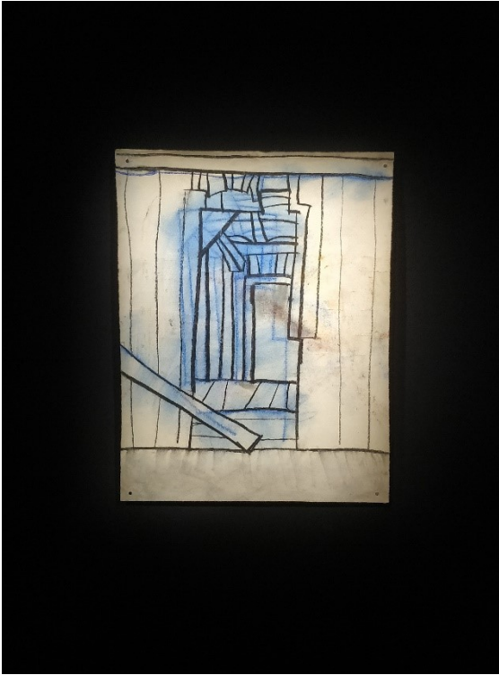
Nimetön, 2020, Kuivapastelli paperille, 63 x 49 cm

Lopputyönäyttelyideni päätepiste ja viimeisen työskentelypäivän teos oli Project Roomin mustassa huoneessa ollut Nimetön piirustus. Kuten yksi Kuvan Kevään maalauksistani, niin myös tämä teos sai alkunsa mökillä tehdystä havaintopiirustuksesta. Kuva esittää keskeneräisen puisen vajan seinää, josta pystyi näkemään läpi. Sininen väri piirustuksessa oli ensimmäinen yritys hahmotella kuvan viivoja. Halusin piirustuksen poikkeavan näyttelyn muista teoksista ja olevan korostetusti piirustus, eli kuva rakentuu viivoista. Teos oli mustan huoneen päätyseinällä ja ainoa valaistu asia koko huoneessa. Astuttaessa huoneeseen gallerian valoisammalta puolelta, kesti hetken, että katse tottui pimeyteen. Nimetön piirustuksessa on tila, joka vie katseen syvemmälle ja pidin siitä, että piirustus esitti tilaa, joka aukesi tilassa, pimeyden keskellä.