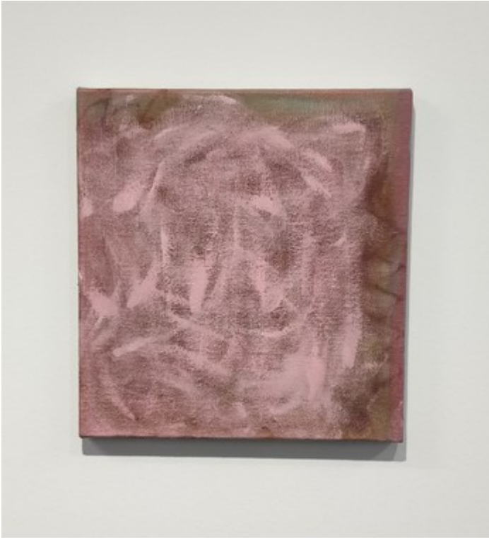
Nimetön, 2020, öljy kankaalle, 32 x 34 cm

Maalaus Nimetön (2020) syntyi kerros kerrokselta, ilman että minulla oli mitään selkeää ajatusta tai kuvaa lopputuloksesta. Halusin maalaukseeni hitautta, rentoutta ja keveyttä. Maalasin erilaisia kerroksia ja tein useaa maalausta samaan aikaan välttääkseni maalaamasta yhtä teosta kärsimättömästi. Lopulta tein maalaukseen vaaleanpunaisen usvan ja kuvaan tuli lämmin ja pehmeä vaikutelma. Vähän kuin ihoa tai jokin pehmeä vaaleanpunainen tyynty, johon voisi halutessaan upota.