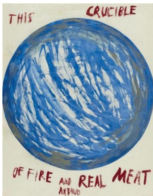
Nancy Spero, This Crucible of Fire And Real Meat , 1969 (Guassi, muste ja kollaasi paperille, 63.5x50.2 cm)