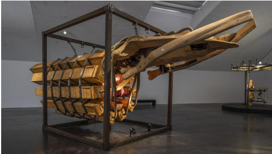
Marcus Copper, Archangel of Seven Seas , 1998 (Puu, sähkömoottori, teräs, urkupillit, 3x2.9x8.5 m)