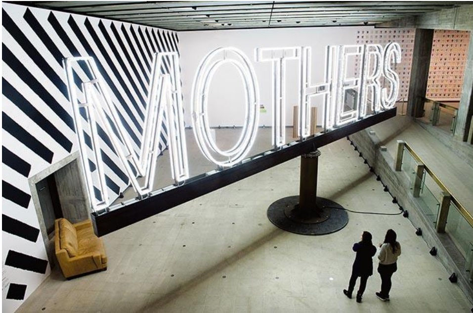
Martin Creed, Work No. 1092, Mothers , 2011, näyttelyssä "What's the Point of it?" (Liikkuva installaatio, tarkat materiaalit ja mittasuhteet tuntemattomat)