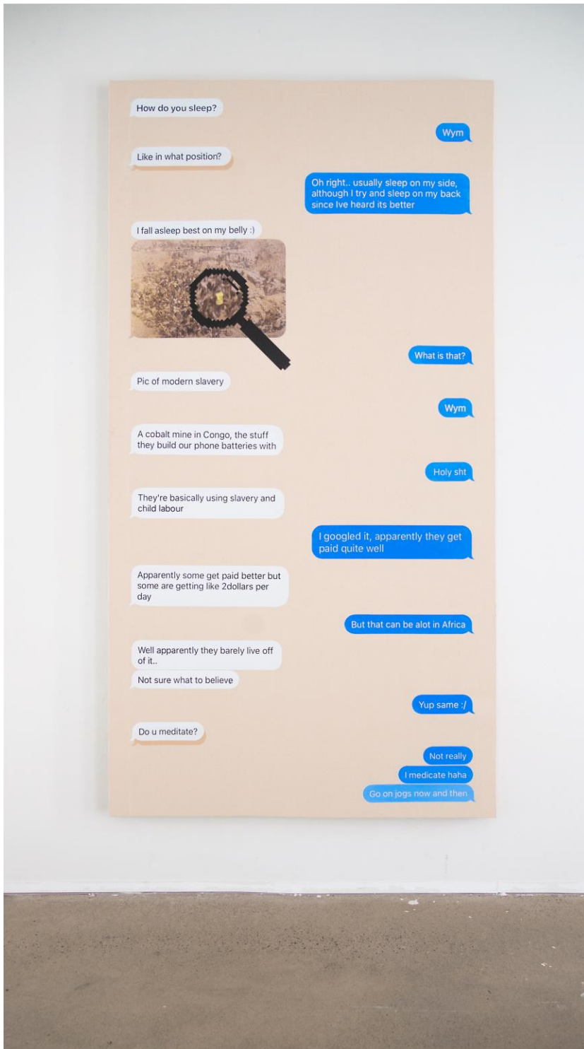
Untitled, Kaiku-galleria 2023 (Akryyli ja silkkipainoväri kankaalle, 135x257 cm)

Opinnäytteen toinen taiteellinen osa oli suureen mittakaavaan tehty maalaus.