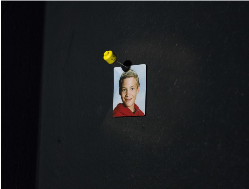
Oh lord please don't let me be misunderstood , Kuvan Kevät 2018 (Veistosinstallaatio ja ääni)

“I don't wanna be a trout mask replica of a famous pop star