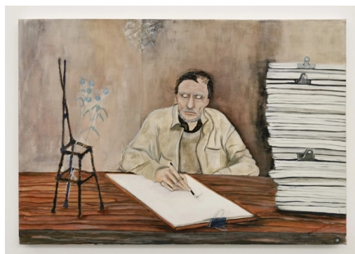
Figura 1. Pintura de Gisèle Durand-Ruiz, Deligny à son établi , óleo sobre, 1990. Colección de la artista. En exhibición Fernand Deligny, légendes du radeau en Crac Occitanie, 2013.

sistemáticamente (Deligny, 2007: 1099). Pedagogo, escritor y pensador, la influencia de sus experiencias pedagógicas, tanto institucionales como no institucionales, su reflexión sobre el papel y la actividad del docente, su crítica al sistema médico-psiquiátrico y a la definición normativa de sujeto y, por tanto, a la exclusión institucional de todo lo que queda fuera del vasto universo de lo normal, siguen siendo fuente de interés y discusión en campos tan diversos como el trabajo social, la pedagogía, las terapias psicosociales, el arte, el cine y la escritura (Miguel, 2022; Guerra, 2022; Perret, 2021; Pouteyo, 2020; Miguel, 2019; Milton, 2016; Querrien, 2006). La publicación de sus obras completas, así como de obras singulares o recopilaciones de textos, la publicación de sus cartas en el periodo comprendido entre 1968 y 1996, así como la exposición de sus cartografías realizadas en colaboración con los participantes de la Tentative des Cévennes, además de una serie de congresos, conferencias y talleres dedicados a su obra, dan cuenta de la resonancia que su trabajo sigue teniendo en contextos académicos formales e informales. 3