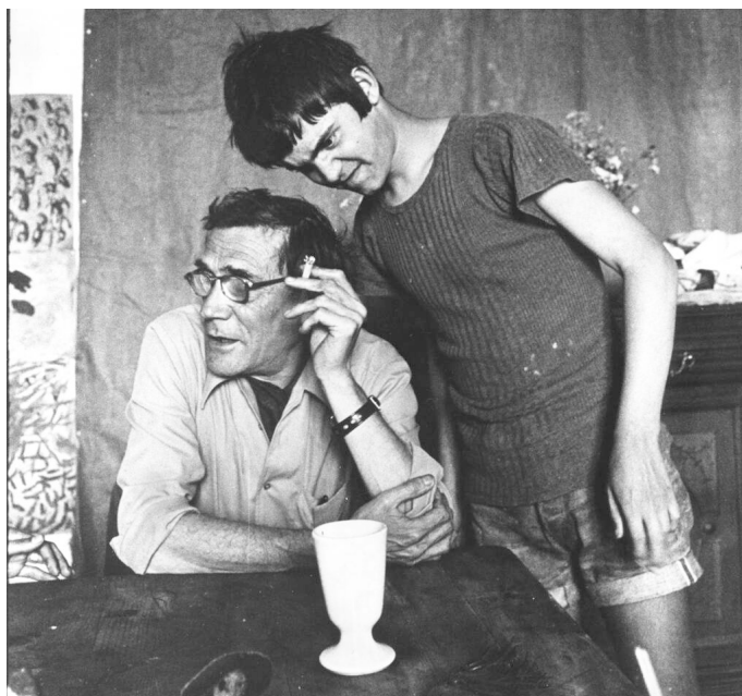
Figura 2. Fotografía de Fernand Deligny y Janmari, en Cévennes en 1973. © Thierry Boccon-Gibod. https://www.liberation.fr/culture/livres/fernand-deligny-lenfant-oublie-20210616_NXEAUQYQJVHXXVNSMRF277F34Q4/