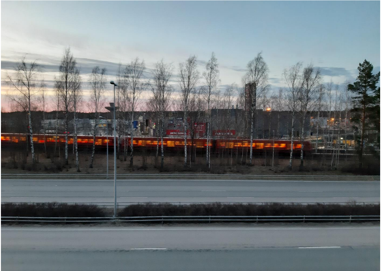
Metro matkalla lännestä itään, keväällä 2020.

”Karkeesti mä sanosin keskiluokka – ja sit siellä on hajontaa isän suvun puolesta, missä ollaan oltu korkeempaa keskiluokka ja äidin suvun puolelta alemmaa keskiluokkaa – on myös omat pitkät sukujuuret Helsingissä, eli tietynlaista niinkun työväenyhteiskuntaluokkaa Helsingistä, useammassa sukupolvessa olen stadilainen, mikä on jännä kans varmaan joku identiteettikysymys” H1