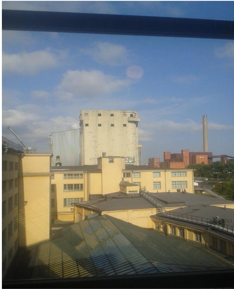
Teatterikorkeakoulun rakennus vuonna 2018, kuvattuna seitsemännen kerroksen porrashallin ikkunasta.

Katriina Järvinen kirjoittaa, että Bourdieun mukaan vanhemmilla on ratkaiseva merkitys lapsen taloudellisen, sosiaalisen ja kulttuurisen pääoman kannalta. Synnymme olosuhteisiin, jotka antavat meille tietyt pelikortit yhteiskunnassa pärjäämiseen. Perheen varallisuus vaikuttaa asumisolosuhteisiin, siihen millaisia vaatteita on mahdollisuus hankkia, mitä syödään, miten koti on kalustettu, onko autoa, venettä ja kesämökkiä, varaa harrastaa, matkustella, pääseekö kielikurssille, vaihto-oppilaaksi jne. (Järvinen ja Kolbe 2007, 48.) Sosiaalinen pääoma taas näkyy siinä, minkälaisesta suhdeverkostosta lapsi pääsee kodin kautta osalliseksi, millaisia läheiset ihmissuhteet ovat laadultaan, miten oppii toimimaan ja kommunikoimaan erilaisissa tilanteissa, onko kodin tunneilmapiiristä helppo ponnistaa omille jaloilleen. Tiettyjä perinteitä, aineettomia arvoja ja hyvää makua (kursivointi opinnäytetyön kirjoittajan!), jotka on omaksuttava