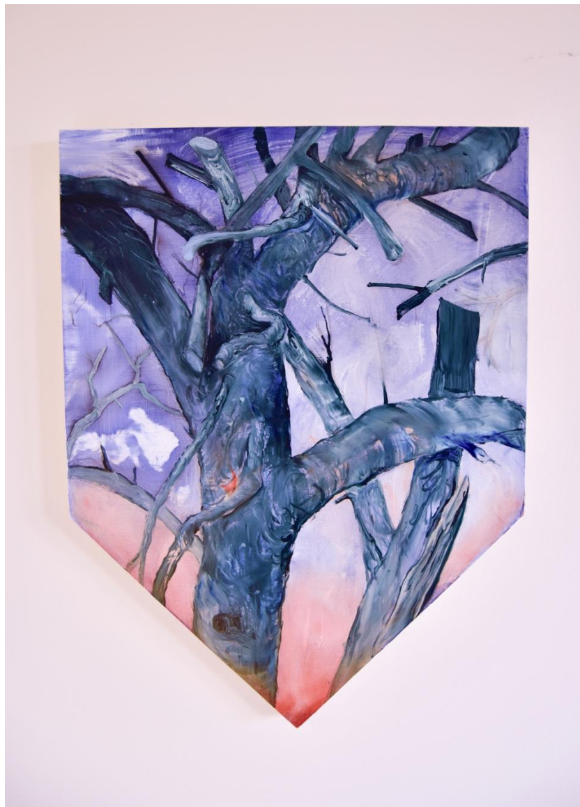
Oksat 1 , öljy levyllä, 80 cm x 60 cm, 2022.

Lopputyöni lähtökohta on raskas. Itse maalaukset halusin sommitella ja maalata lopputyöprosessin aikana tavalla, jossa teoksiini tulisi keveyttä ja ilmavuutta. Lopputyönäyttelyssäni esillä olleiden kolme teoksen puufiguurit teoksissani Puu 1 , Puu 2 ja Puu 3 eivät ole oikein kiinnittyneet mihinkään vaan leijuvat jossain vaikeasti määriteltävissä olevassa tilassa. Teoksessani Oksat 1 (kuva alla) itse maalaus pohjan muoto antaa työlle ilmavan nuolimaisen muodon. Teos ei ankkuroidu mihinkään vaan heiluu terävän kärkensä varassa. Olin maalannut teoksen ennen kuin aloin tehdä Puu -maalaussarjaani, ja vaikka jätin sen pois lopputyönäyttelystäni, tavoitin mielestäni sen maalaustavan ja sommittelun keveyden, jota hain. Maalaus oli esillä B-galleriassa heinäkuussa 2023.