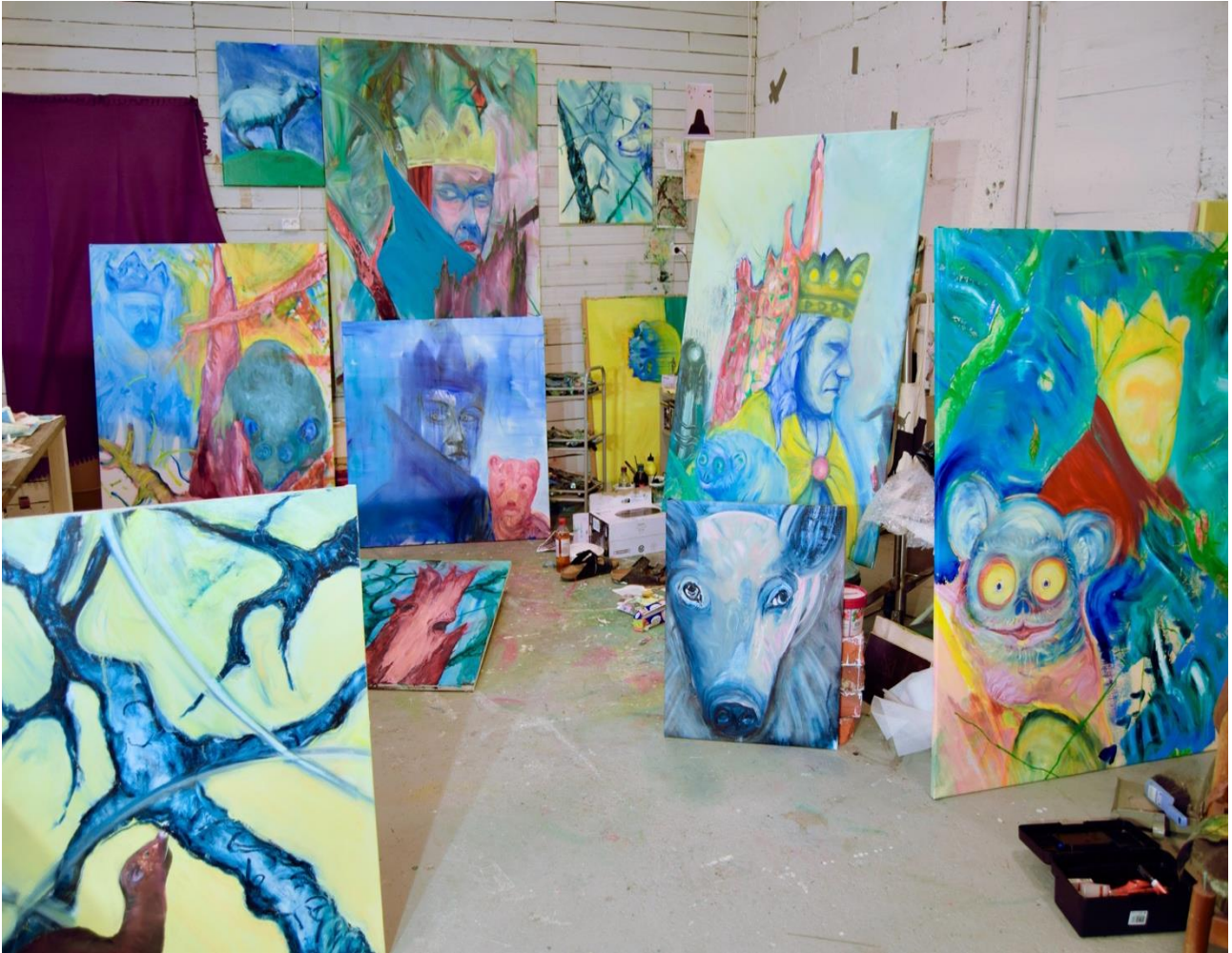
Näkymä työhuoneeltani Turusta, 2021.

Puita ja kasveja voi pitää ihmisen metaforina tai olioina. Syksyllä lehtipuissa tapahtuu muodonmuutos ensin niiden värin vaihtuessa, sitten lehtien pudotessa. Puut muuttuvat joksikin toiseksi, hirviön kaltaisiksi ja samalla kiinnostaviksi piirustus- ja maalauskohteiksi. Toisinaan ajattelen, että taiteellinen työskentelyni on sitä, että annan hirviöille mahdollisuuden piirtyä esiin. Koen, että vanhempieni takapihan pensaiden ja puiden paljaat rangat tarjosivat sopivan etäännytetyn kohteen, jonka kautta pystyin käsittelemään vanhempieni poismenoa ja kuoleman väijäämättömyyden ja lopullisuuden kammottavuutta. Takapihaa voi pitää syklisyyden metaforana. Lohdullista on, että pihalla maa kuhisee elämää. Edelleen kevät tulee, kasveihin puhkeaa silmuja.