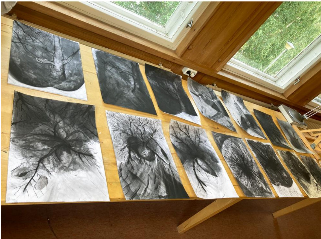
Työpistenäkymä Serlachiuksen residenssistä Mäntässä heinäkuussa 2023.

Nuo heinäkuussa 2023 tekemäni hiilipiirrokset ovat teemallisesti jatkoa syksyn 2022 maalauksille, jotka on tehty niukemmalla väriskaalalla kuin lopputyönäyttelyyn päätyneet värikkäät öljyvärimaalaukset. Huomasin piirtäessäni, että kun väri on poissa, itse kuva-aihe nousee vahvemmin esille ja puiden ja pensaiden hirviömäisyys ja oliomaisuus näyttäytyy erilaisena kuin värikkäissä maalauksissa. Piirustus näyttää aiheen suuremmin ja selvemmin kuin maalaus. Maalauksessa kiehtoo maalauspinnan alueiden ja värien suhde toisiinsa. Lisäksi maalaus tarjoaa mahdollisuuden yhdistää piirtäminen ja värit. Ilmaisua pystyy laajentamaan moneen suuntaan. Viime aikoina olen kokenut, että siveltimistä luopuminen voisi piristää maalausilmaisua. Siveltimillä maalatessa viiva jää pyöreäksi ja jotenkin luonteettomaksi. Jälki sinällään on herkullista, mutta siitä puuttuu persoonallisuus, kun taas öljyväripuikoilla työskennellessä viivaan saa särmikkyyttä samalla tavalla kuin esimerkiksi hiilellä piirtäessä.