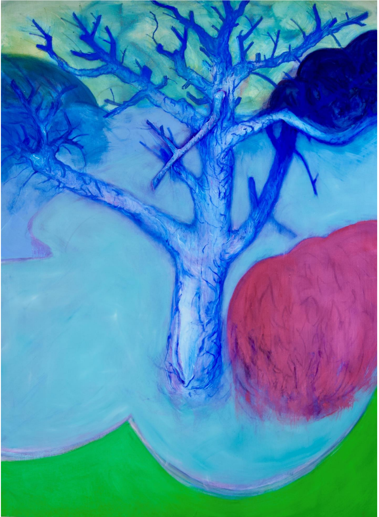
Puu I , öljy kankaalle, 190 cm x 140 cm, 2023.