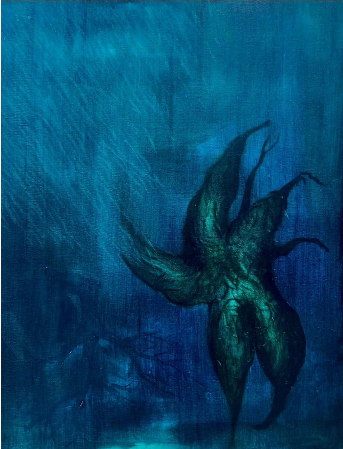
Olio , öljy kankaalle, 80 cm x 60 cm, 2022.