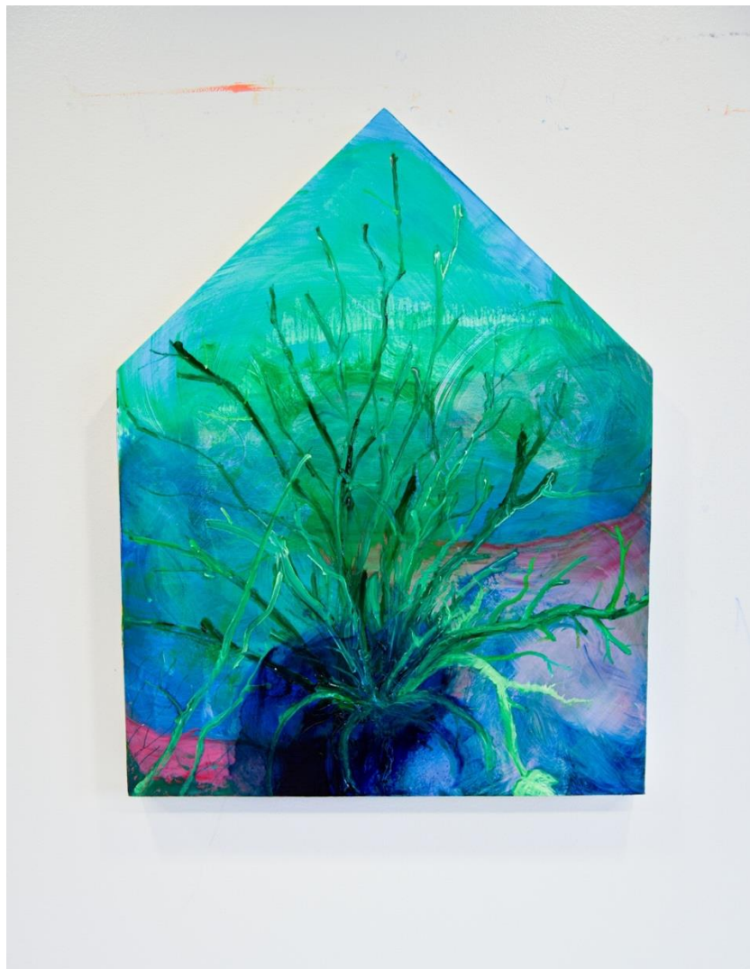
Talo 1 , öljy levyllä, 80 cm x 60 cm, 2023.

Talot ja kodit ja toisaalta eläintenkin rakentamat asumukset ovat vajavaisia, jäävät kesken tai sortuvat. Kotka lisää oksia isoon pesäänsä vuosien ajan, kunnes pesä luhistuu omasta painostaan. 11 Minun mielessäni kotkanpesä rinnastuu ihmisen vääristyneeseen käsitykseen omista kyvyistään. Koin traagisena, että kotitalossani monet arkielämän tehtävistä olivat jääneet kesken ja piha ja talo oli jätetty hoitamatta. Isäni ei osannut aavistaa kuolemaansa, vaan hän oli vielä edeltävänä päivänä valmistellut seuraavan päivän ruokia. Pakastimesta oli otettu puolukoita sulamaan.