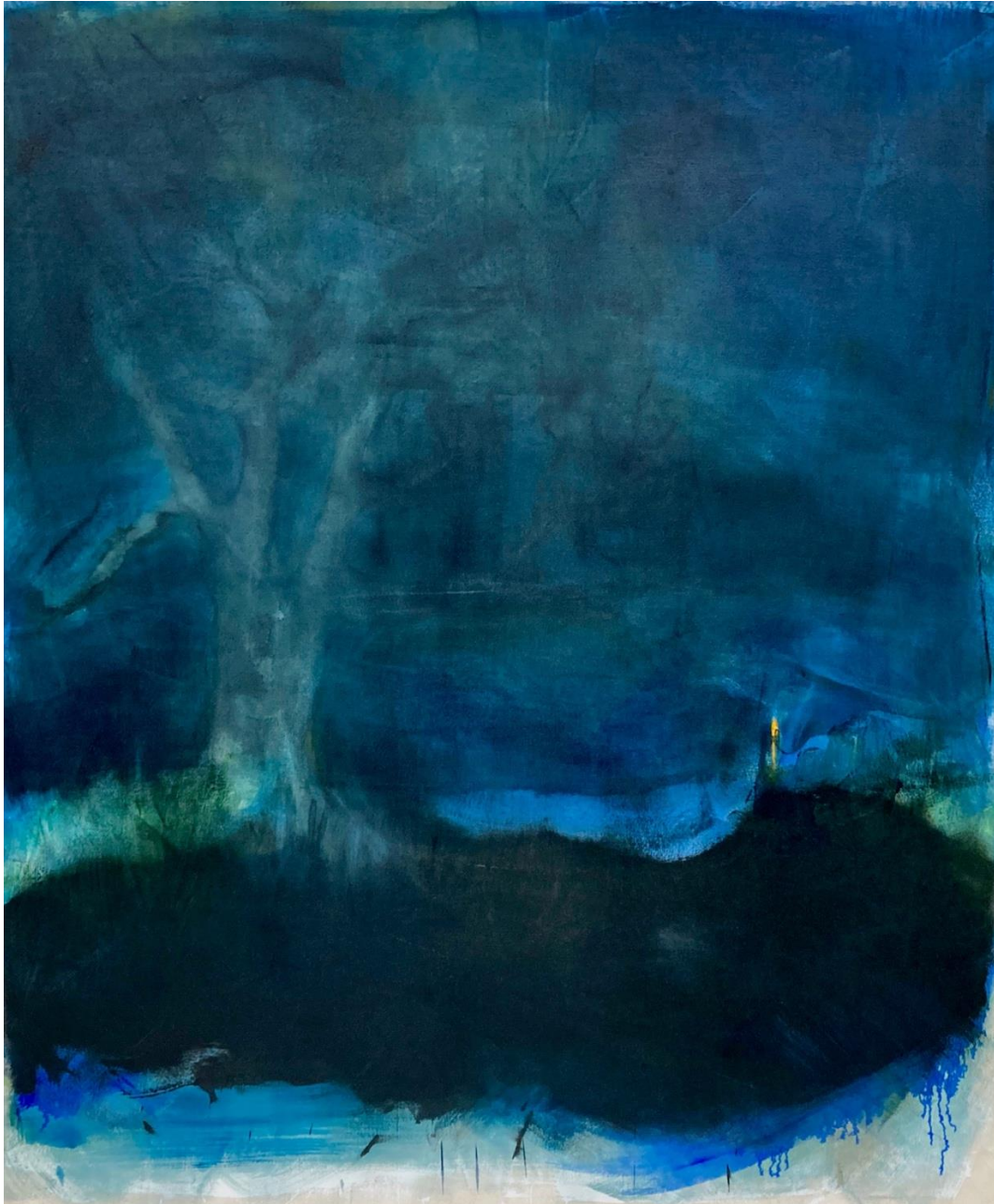
Nimetön , öljy kankaalle, 160 cm x 120 cm, 2022/2023.

Näyttelyssäni halusin käsitellä – oman elämäni henkilökohtaisista tapahtumista ja vanhempieni kuolemista huolimatta – kuoleman mysteeriä yleensä, yleisellä tasolla. Lopputyöprojektini ja B-gallerian näyttelyni aikana mietin, kuinka paljon avaisin ihmisille teosteni taustoja. Päädyin aika suoraan kertomaan, että teosteni aihe on minulle henkilökohtainen, intiimi. Vanhempien poismeno on yleisinhimillinen tapahtuma, joka koskettaa useimpia henkilöitä jossain vaiheessa elämää. Näyttelyn haasteena oli, miten käsitellä läheisten poismenoa ilman sentimentaalisuutta. Usein on vaarana, että tiettyjen aiheiden kohdalla taiteilijan töistä tulee imeliä, mahtipontisia ja vaivaannuttavia tai yllätyksettämiä ja kuluneita ja itse teokset jäävät dramaattisen aiheen varjoon.