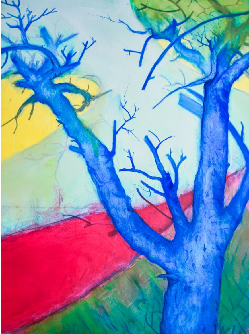
Puu 3 , öljy kankaalle, 190 cm x 140 cm, 2023.