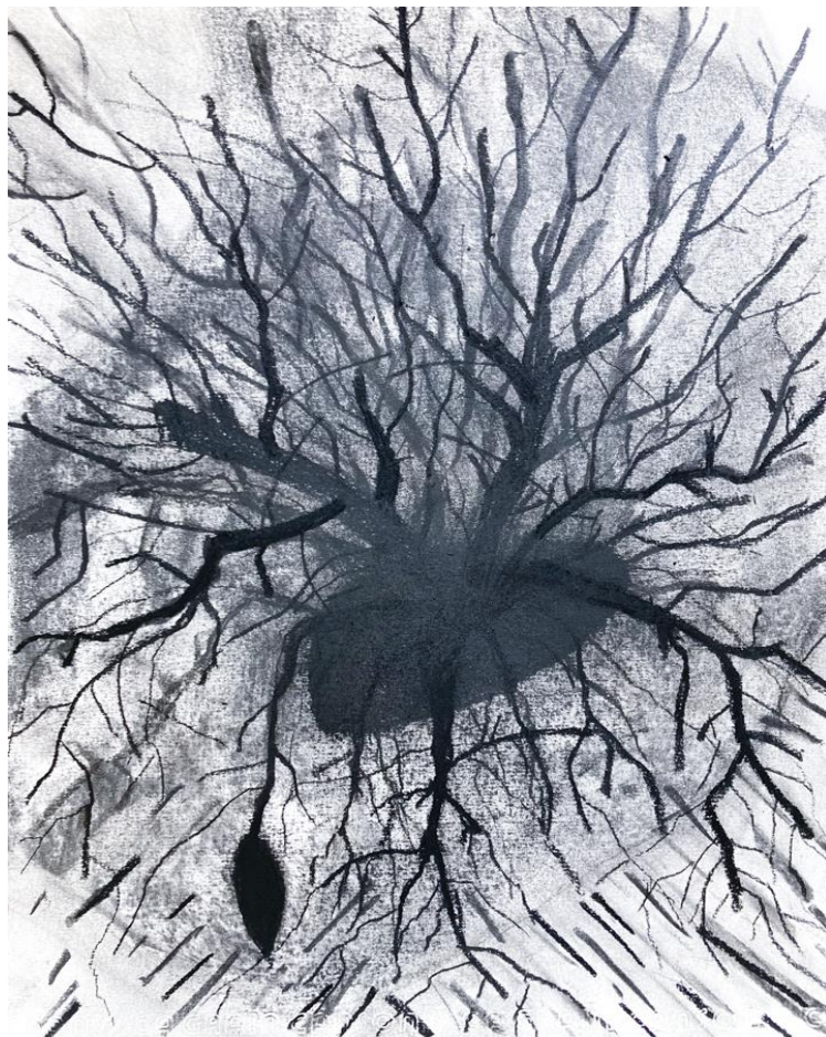
Pensas (5) , noin A3, hiili paperille, 2023.

Heinäkuussa 2023 olin Mäntän Serlachius-residenssissä ja työstin eteenpäin lopputyömaalauksissani aloittamaani teemaa. Aloin tehdä pitkästä aikaa hiilipiirustuksia paperille. Piirtäminen on taiteellisen työskentelyni pohja, ja olen piirustellut ihan pienestä pojasta asti. Välillä piirtäminen on jäänyt taka-alalle, mutta viime aikoina maalauksiini on taas tullut piirustuksellisia elementtejä. Hiilellä työskennellessään piirtäjä on tekemisissä perusasioiden kanssa.