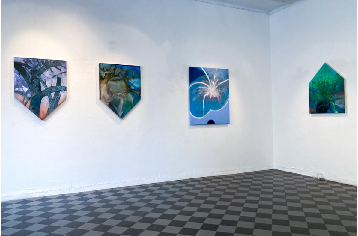
Näkymä B-gallerian näyttelystä heinäkuussa 2023.

Maalaukset Olio ja Nimetön (ks. alla olevat teoskuvat) olivat B-gallerian näyttelyn henkilökohtaisimpia teoksiani. Ne ovat tummia ja rauhallisempia kuin näyttelyn muut työt. Toiset näyttelyni teoksista ovat enemmän liikkeessä. Tavoittelin näyttelyn maalauksissa tuulen tuiverrusta; puut ja pensaat ovat karun luonnon armoilla. Olio -maalauksessa teoksen sisäinen figuuri leijuu jossain tunnistamattomassa tilassa, etäällä. Nimetön -teoksessa maisema alkaa hajota ja tilassa oleva puu näkyy enää etäällä viitteellisenä; maalauksen figuuri on siirtymässä pois. Teoksissani Olio ja Nimetön halusin astua johonkin tuntemattomaan enkä enää tarkastele luontoa ulkopuolelta vaan menen sisälle johonkin, jota ei voi suoraan sanallistaa.