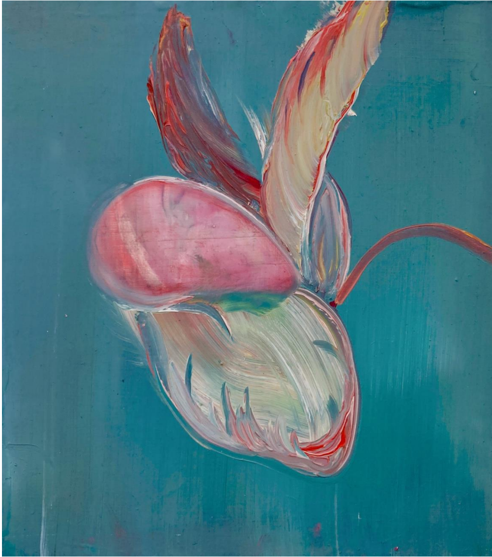
Mukula , öljy MDF-levylle, 31 cm x 26,5 cm, 2022.

Aloin hahmotella lopputyötäni syksyllä 2022. Ajatuksenani oli tehdä maalauksia, joissa olisi niukka väriskaala, ja teinkin useita teoksia, joiden jo ajattelin sopivan lopputyönäyttelyyni. Maalaukset oli maalattu sinisen ja harmaan sävyillä, koska halusin rajata väripalettia ja tutkailla, mitä niukasta värivalikoimasta saisi irti. Lähtökohtanani olivat vanhempieni rivitaloasunnon takapihan viinimarjapensaat ja omenapuut. Puutarha on aiheena kiinnostava, koska se sijoittuu johonkin luonnon ja kulttuurin välimaastoon. Ihminen jalostaa kasveja, jotka sopivat hänen estetiikan tajuunsa, miellyttävät hänen silmäänsä ja tuottavat paljon kauniita kukkia tai makeita marjoja tai hedelmiä. Toisinaan kaunis ja houkutteleva voi olla myrkyllistä eikä kaikkien pensaiden marjoja saa syödä. Kasvit eivät voi olla kovin alttiita kylmälle, kasvitaudeille ja tuholaisille. Ihminen rajaa luonnosta tilan, jonka maaperää muokkaa; hän kaataa puita, nostaa maasta kivet ja kannot, tuo tontille oikeanlaista multaa, johon valitsee ja istuttaa itseä miellyttäviä puita, pensaita ja kukkia,