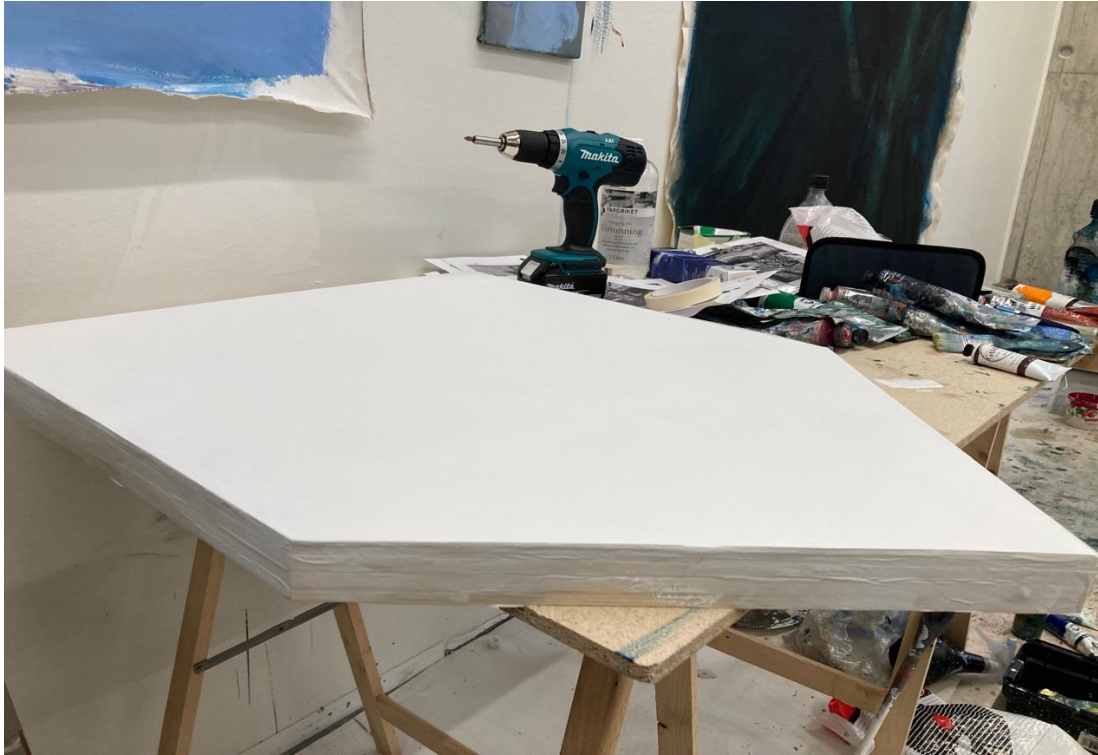
Näkymä Kuvataideakatemiaan työhuoneelta, syksy 2022.

Talo kokoaa muistoja ja tuntemuksia kattoonsa alle. Muistot syntymäkodista ovat läsnä mielessä ja unissa. 9 Samaa voidaan ainakin jollain tasolla ajatella kodin pihasta ja puutarhasta. Ihminen usein tarkastelee omaa vointiaan ja jaksamistaan sitä vasten, miten taloa ja puutarhaa on hoidettu. Klassisessa ikonografiassa talo vertautuu ihmisen psyyken tiloihin ja muistoihin.