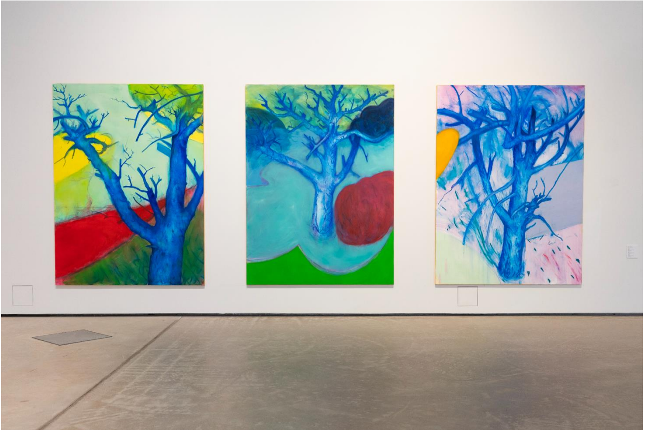
Lopputyömaalaukseni Kuva/Tila-galleriassa keväällä 2023. Teokset vasemmalta oikealle Puu 3, Puu 1, Puu 2.

käytän valokuvaa lähteenä, joskus toimin pelkästään muistini varassa. Koen kiinnostavaksi ja vapauttavaksi tehdä tavallisesta ja arkisesta omanlaiseni tulkinnan. Viime aikoina olen ollut kiinnostunut mitättömän ja tavanomaisen ylevöittämisestä.