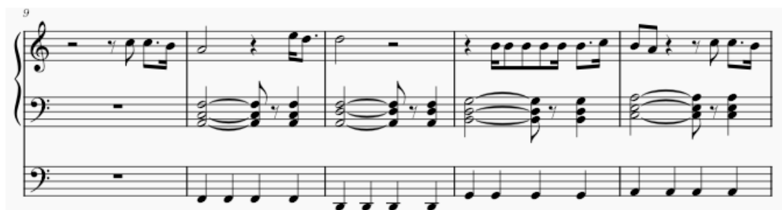
Kuva 5 Kertosäkeen toteutus. Kertosäkeessä komppi muuttuu merkittävästi. Basso alkaa soittaa neljäsosia ja sointuja soitetaan ilman arpeggiota.

Säkeistön nuotinnus osoittaa myös sen miten vaikeaa populaarimusiikin lauluosuuksien tarkka nuotintaminen on. Käytännössä kannattaa nuotintaa vain peruslähtökohta ja soittaa sitten ad lib. kuvitellen mukaan laulettu sanat. Lauluosuudet perustuvat usein sanarytmiin ja vaihtelevat siksi eri fraaseissa ja säkeistöissä.