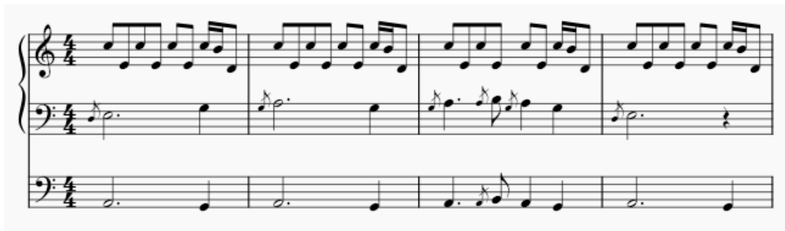
Kuva 3 Alkuriffin toteutus. Soitetaan triossa siten, että ylin rivi on kitaran ostinato. Toinen rivi on toisen kitaran vastamelodia ja jalkiolla soitetaan bassokitaraan osuus.

Sähkökitara soittaa ostinatokuviota, joita toinen kitara ja basso kannattelevat. Toisen kitaran vastamelodia on koristeltu sähkökitaralle ominaisin alapuolisin etuhelein, jotka voi halutessaan soittaa myös uruilla.