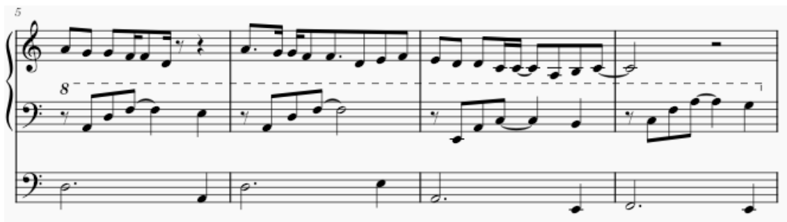
Kuva 4 Säkeistön toteutus. Soitetaan edelleen triossa siten, että melodiaa soitetaan soolorekisteröinnillä yhdeltä sormiolta. Säestyksen arpeggio-soinnut toiselta sormiolta, joko 4 jalkaisella rekisteröinnillä tai oktaavia korkeammalta 8 jalkaisella rekisteröinnillä. Jalkio hoitaa basso-osuuden.

Kesäyön säkeistö ja kertosäe ovat sopivia urkutoteutukselle siinä mielessä, että niissä on tunnistettava ja vaihteleva melodia. Usein popmusiikissa melodia saattaa muodostua vain muutamasta, tai jopa vain yhdestä sävelestä ja silloin kappaleen mielenkiintoisuus perustuukin esimerkiksi rytmin, tai harmonian vaihteluihin. Tällaiset kappaleet ovat kuitenkin hankalia toteuttaa uruilla, koska kappaleen tunnistettavuus ei perustu melodiaan vaan esimerkiksi jonkun soittimen soundiin tai erikoiseen rytmiiikkaan.