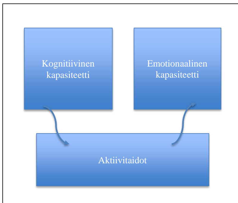
Kuva 1: Tulevaisuuslukutaidon osa-alueet (Pouru & Wilenius 2018, 18).

Kognitiivisen kapasiteetin osa-alueessa keskitytään tietoon ympäröivästä maailmasta sekä ymmärtämään syitä ja tapoja hyödyntää tulevaisuutta. Tieto historiasta, tulevaisuudesta, nykyisyydestä sekä niiden suhteesta toisiinsa auttaa ymmärtämään, kuinka tulevaisuutta voidaan hyödyntää nykyhetkessä. Myös systeemi- ja kompleksisuusajattelun sekä luovan ja kriittisen ajattelun taidot kuuluvat kognitiivisen kapasiteetin osa-alueeseen. Emotionaalinen osa-alue käsittää itsetuntemuksen sekä ymmärryksen omista tulevaisuussuhdetta muokkaavista odotuksista, ajatuksista ja tunteista. Arvopohdinta ihmiskunnan vastuusta ekokriisissä sekä empaattinen kyky eläytyä tulevien sukupolvien asemaan ovat myös olennainen osa emotionaalista osa-alueetta. Faktatiedon rinnalla myös intuitiolla, arvoilla sekä tunteilla on olennainen osa tulevaisuuden hyödyntämisessä. (Pouru & Wilenius 2018, 17–19.)