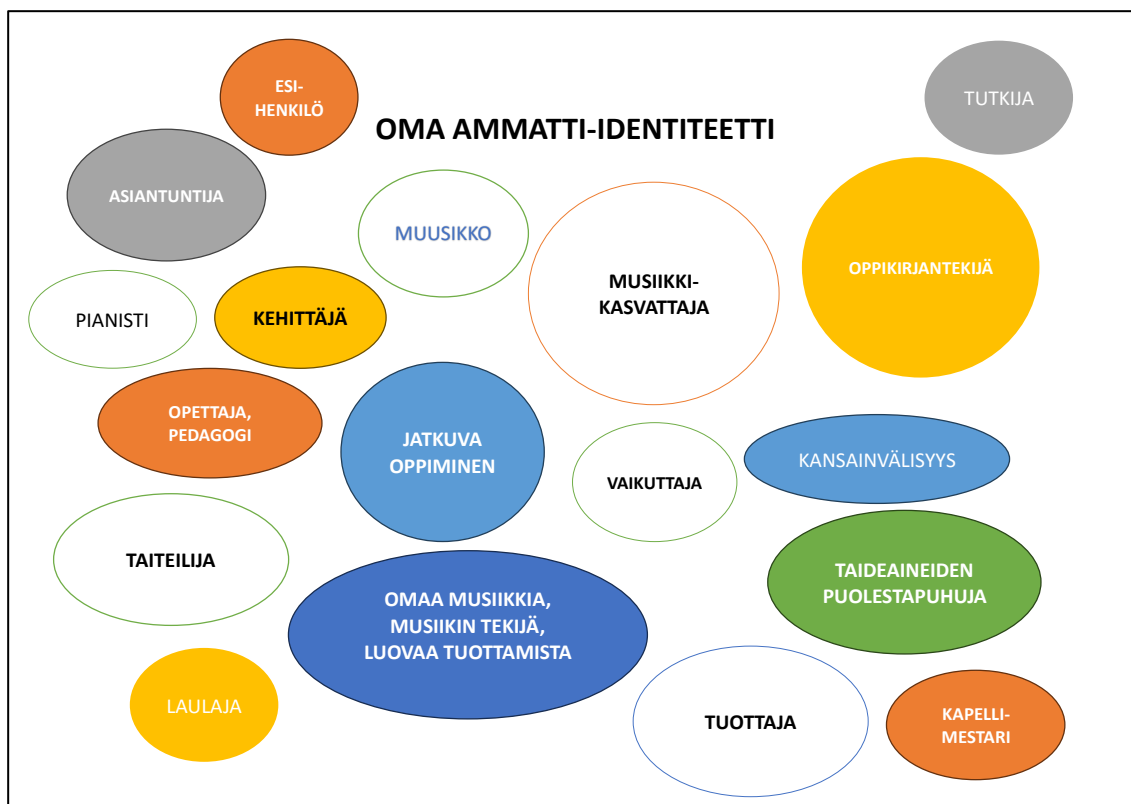
Kuva 2. Haastateltavien ammatti-identiteetit

identiteettiä kuvaileva sana. Olen koonnut alla olevaan kuvioon haastateltavien kirjoittamat sanat. Alla olevan kuvion värikkäät pallot kuvastavat samalla musiikkikasvattajan värikästä ammatti-identiteettiä eli moninaisia työtehtäviä, joiden parissa valmistuneet musiikkikasvattajat toimivat työelämässä. Kuvion isoimmat pallokuviot kuvastavat, kuinka useampi haastateltavista oli kirjoittanut omaan paperiinsa saman termin tai samaa teemaa kuvailevan sanan.