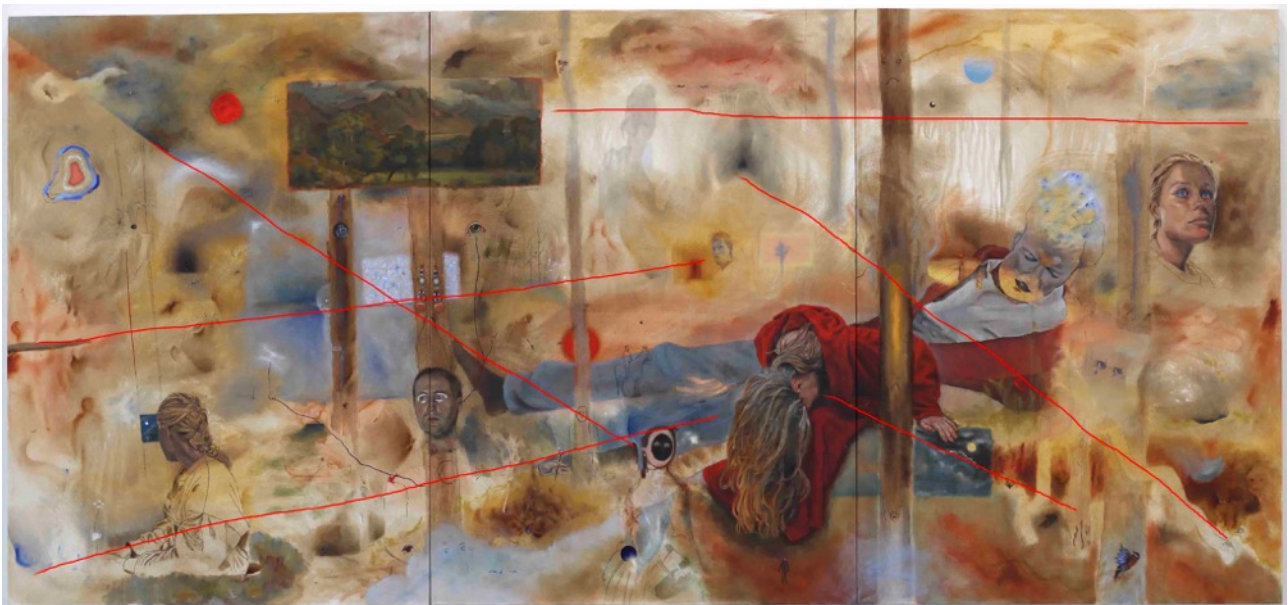
Svåra skogen, 2023, öljy kankaalle, 140 cm x 300 cm. Punaiset linjat myöhempi muokkaus.