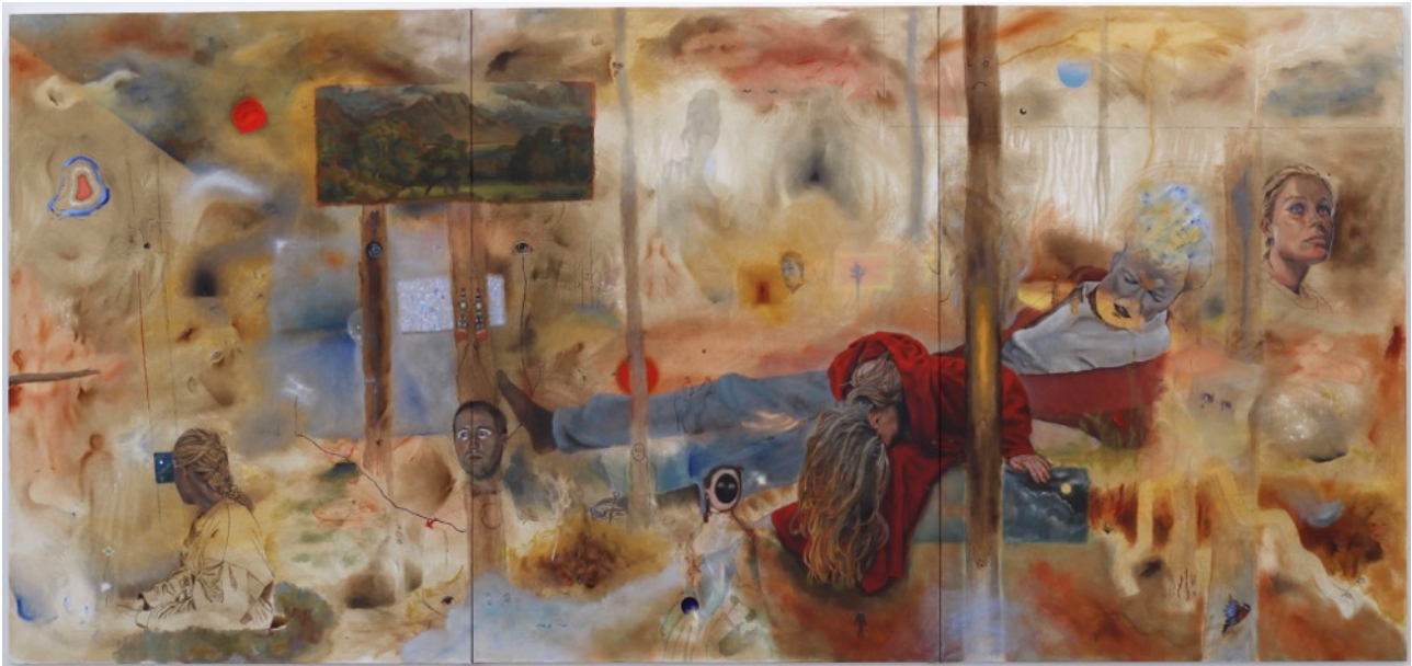
Svåra skogen , 2023, öljy kankaalle, 140 cm x 300 cm.

Lähtökohta maalaukselle oli metsä. Minulla ei ollut valokuva referenssiä tälle metsälle, käytännössä päinvastoin kuin Du i skogen -teoksessa. En tiennyt minkälainen metsä syntyisi tai miltä se näyttäisi. Maalaus syntyi maalauksen puhetta kuuntelemalla (kts. 1.4 Maalauksen puhe). Minulla oli kolme 100 cm x 140 cm kokoista maalaus pohjaa jotka asetin vierekkäin, jotta ne muodostaisivat yhden maalauksen, mutta en silti ajattele maalausta triptyykinä. Aloitin rätillä pyyhkimään poltettua umbraa kankaalle, jotta saisin gesson valkoisen värin nopeasti peitettyä. Huomasin että rätillä pyyhityt jäljet alkoivat muodostamaan maiseman. Annoin maalauksen ohjata minua eteenpäin.