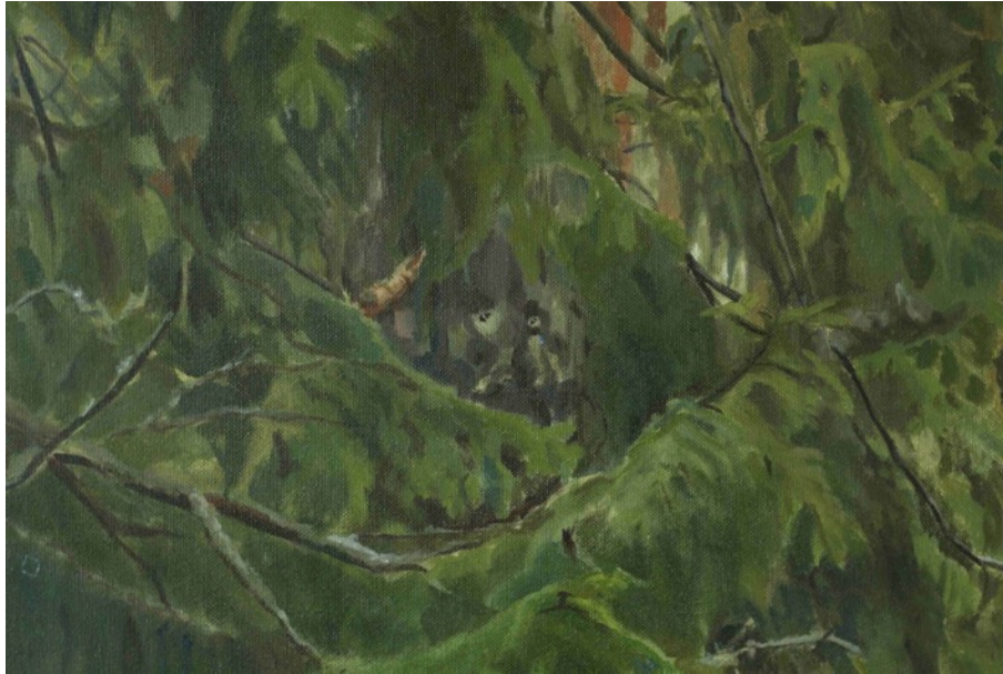
Kuva 7. Du i skogen yksityiskohta.

Keskellä näkyy puun runkoon ilmestyneet surulliset kasvot, jotka kurkistavat oksien lomasta (Kuva 7). Kasvojen silmäkulmasta valuu kyynel. Hahmo yksinäinen paljouden keskellä. Oikeassa yläkulmassa havupuun oksat ovat ottaneet elämänsä tien päässä olevaan vanhan miehen muodon. Tämä maalauksen osa symboloi ihmisenä olemisen kipuja.