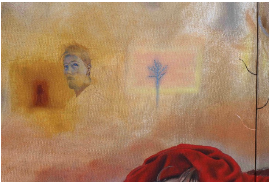
Kuva 6. Svåra skogen yksityiskohta.

Puuhahmo härnää naapuriaan (Kuva 5). He kasvavat vierekkäin, ja joutuvat selvittämään erimielisyyksiään jatkuvasti. Liitän usein maisemiini inhimillisiä ominaisuuksia joiden kautta yhdistän keskeisiä teemojani.