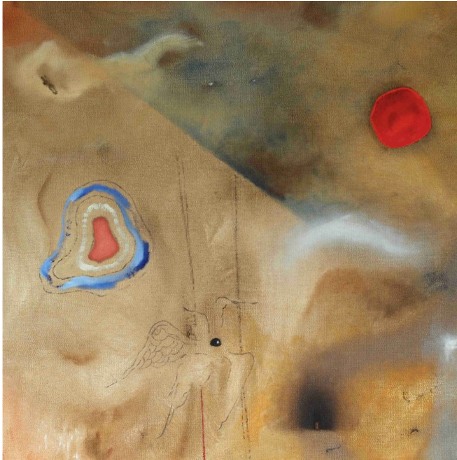
Kuva 2. Svåra skogen yksityiskohta.

Hänessä on myös syvyyttä, synkkyyttä ja kaipuuta. Hahmo pitää kädessään kahta kukkaa, joista korkeamman kukan sisällä lukee ruotsiksi “hat” (suom. viha). Tämän olen jättänyt katsojan tulkinnan varaan, sillä näin voimakas tunne pääsee paremmin oikeuksiinsa katsojan henkilökohtaisen assosiaation kautta.