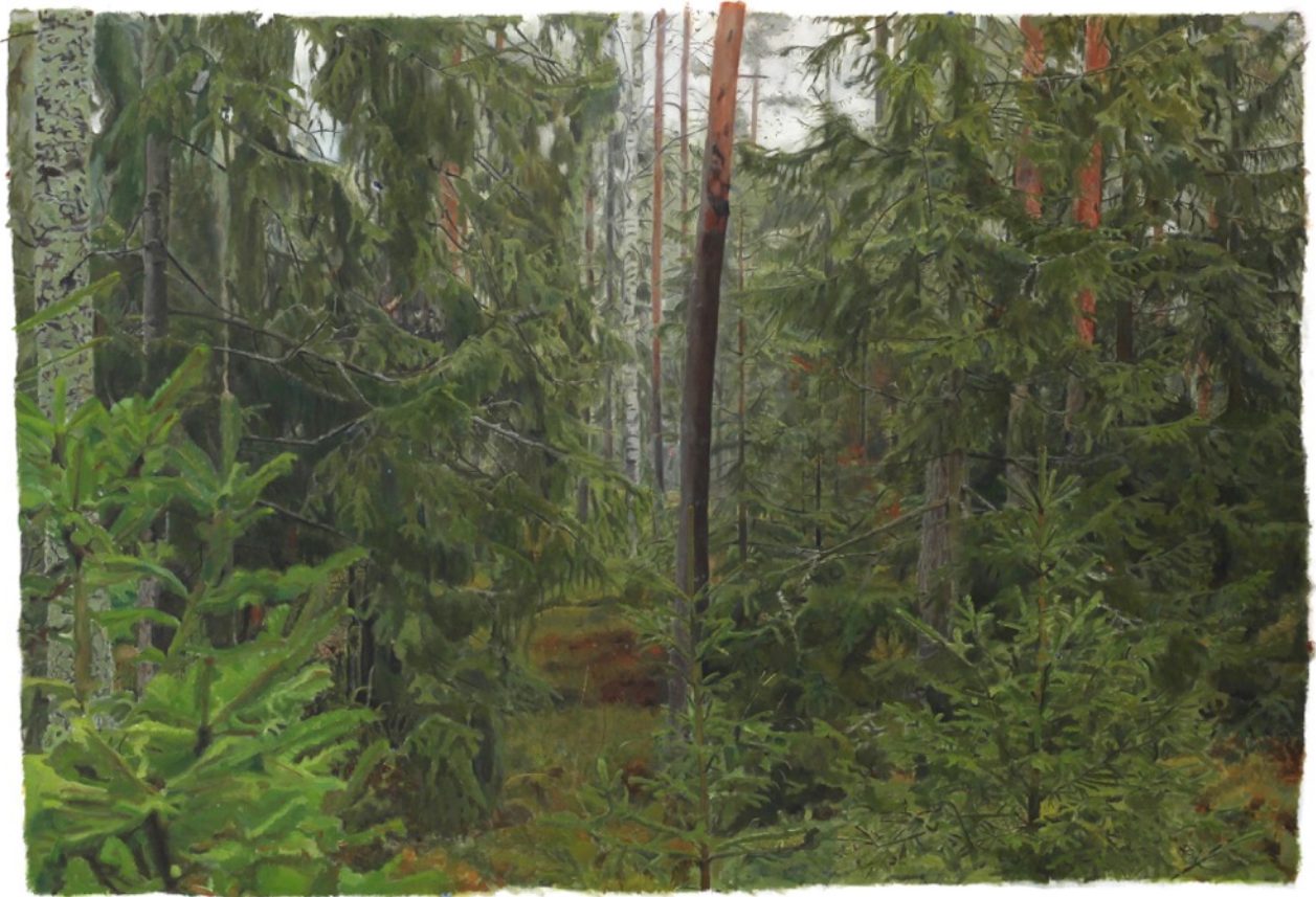
Du i skogen , 2023, öljy kankaalle, 129 cm x 185,5 cm.

En halunnut että elementit ottaisivat likaa valtaa, halusin että katsoja näkisi ensin metsän, kokonaisuuden.