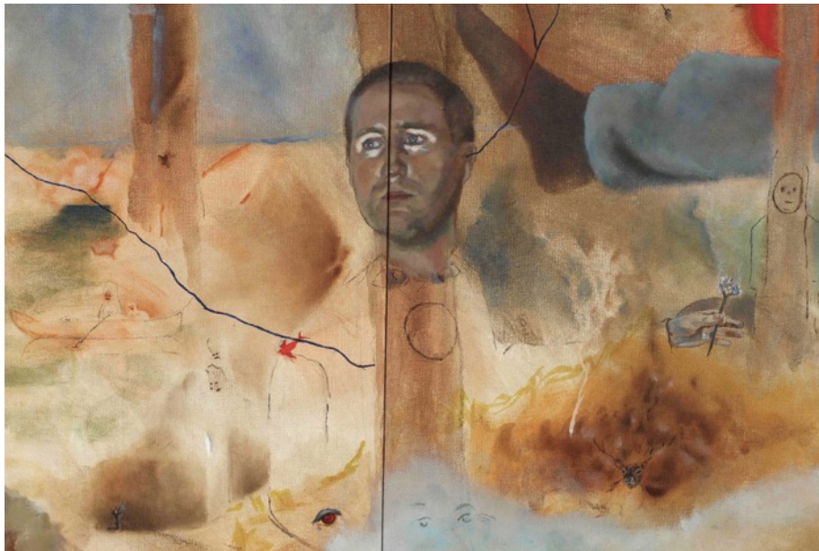
Kuva 3. Svåra skogen yksityiskohta.

Kuva 3 esittää aktiivisessa muodonmuutoksessa olevaa kollaasia eri hetkistä, hahmoista ja elementeistä. Semirealistisella päällä varustettu hahmo joka kädessään esittää kaunista, taianomaista kukkaa. Hänen huomionsa harhaantuu johonkin, joka tapahtuu maalauksen ulkopuolella (ei kuitenkaan katsojan ulottuvuudessa). Jotain on tulossa, jotain jota en määrittele. Hahmon silmistä kuitenkin voi havaita huolen.