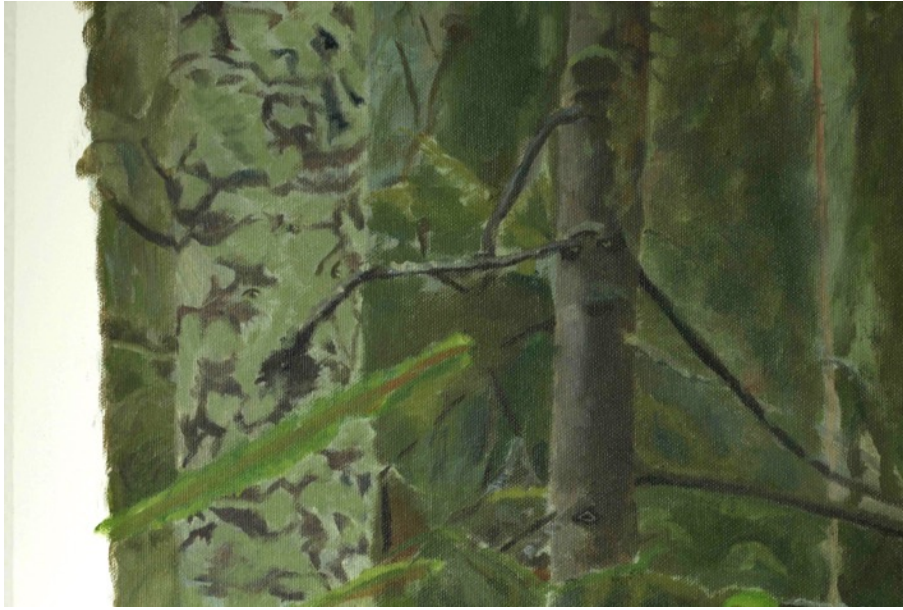
Kuva 5. Du i skogen yksityiskohta.

Puuhahmo härnää naapuriaan (Kuva 5). He kasvavat vierekkäin, ja joutuvat selvittämään erimielisyyksiään jatkuvasti. Liitän usein maisemiini inhimillisiä ominaisuuksia joiden kautta yhdistän keskeisiä teemojani.