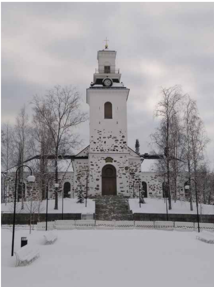
Kuva 17. Kuopion tuomiokirkko vuonna 2020.

Toiminnan vakiinnuttua ovat kirkkojen ja kahden siunauskappelin urut lisäksi olleet käytössä yhteensä keskimäärin 30 tuntia viikossa. Opetuksen kannalta erityisen merkittäviä ovat olleet Tuomiokirkon urut, rakentajinaan Kangasalan Urkutehdas 1954 (60 äänikertaa) ja tanskalainen Bruno Christensen & Sønner 1986 (51 äänikertaa), sekä Alavan kirkon (Kangasalan Urkutehdas 1969, 36 äänikertaa) ja Männistön Pyhän Johanneksen kirkon (hollantilainen Verschueren Orgelbouw 1994 25 äänikertaa).