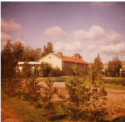
Kuva 2. Suomen Kirkon Seurakuntaopisto Järvenpäässä vuonna 1977.