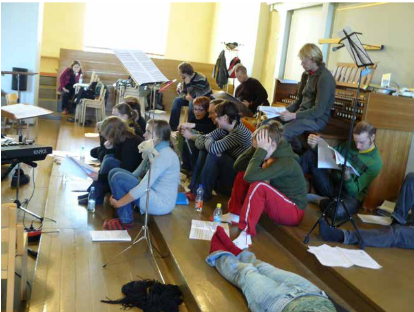
Kuva 54. Levyntekoa Leppävirralla.