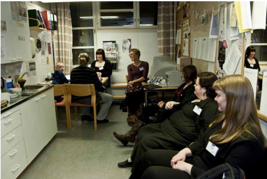
Kuva 31. Kahvihuone vuonna 2010.