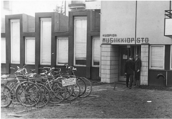
Kuva 14. Haapakulma, konservatorion huoneisto osoitteessa Haapaniemenkatu 10.