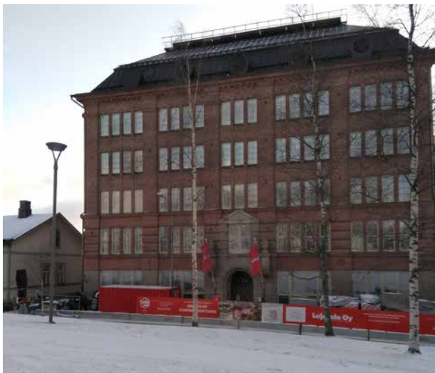
Kuva 13. Tuomiokirkon naapurina oleva Konttisen liiketalo vuonna 2020 odottamassa jälleen muutosta, nyt asuintaloksi.