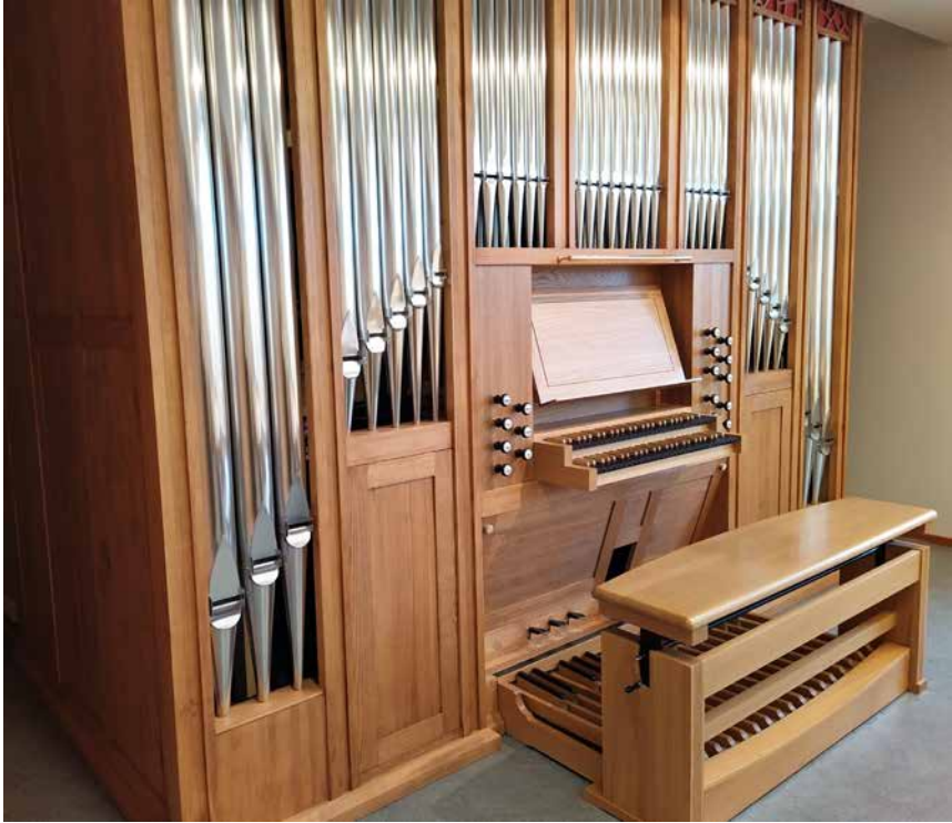
Kuva 39. Vuonna 2019 hankitut urut (Urkurakentamo Virtanen).