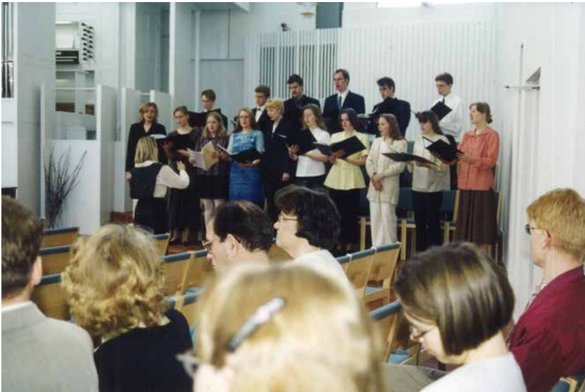
Kuva 44. Opiskelijoiden kuoro Mämmistön Pyhän Johanneksen kirkossa n. 2000.