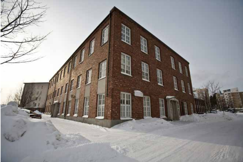
Kuva 20. Hermanninaukion rakennus.

silinja. Samasta rakennuksesta Kuopion kaupunki osoitti vuonna 1992 tilat akatemian koulutuskeskukselle.