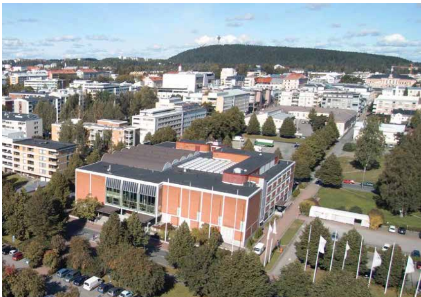
Kuva 18. Kuopion musiikkikeskus.