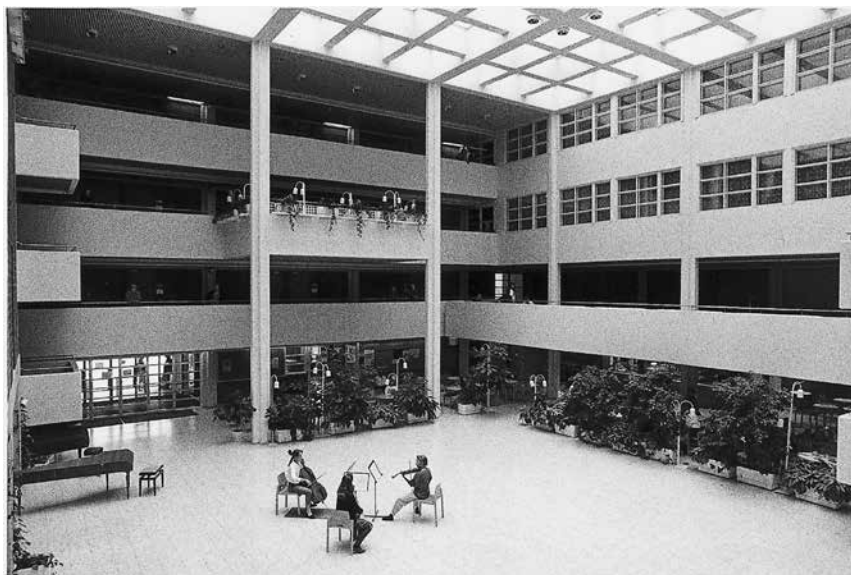
Kuva 19. Kuopion musiikkikeskuksen monikäyttöisessä valohallissa kirkkomusiikin opiskelijatkin saivat usein tilaisuuden esiintyä.