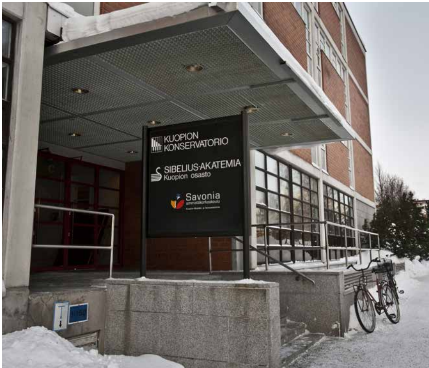
Kuva 26. Kolmen musiikkioppilaitoksen yhteinen sisäänkäynti.