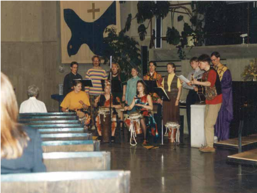
Kuva 47. Opiskelijoiden Sight-yhtye valmistautuu osaston 50-vuotisjuhliin.