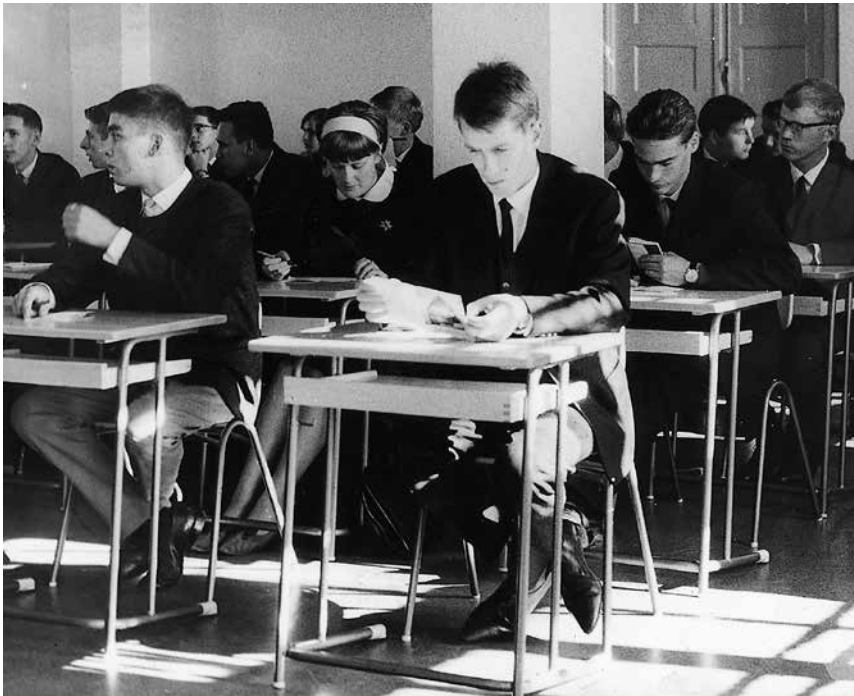
Kuva 4. Opiskelu ei 1960-luvullakaan ollut pelkkää laulamista ja soittamista.

Alun perin oli tarkoituksena, että opiskelijat viipyisivät Kuopiossa vain kaksi vuotta ja siirtyisivät tämän jälkeen jatkamaan opintojaan Helsinkiin. Kuitenkin laajennettu piispainkokous päätti jo syksyllä 1961, että koko nelivuotinen kanttori-urkurin koulutus voitiin antaa Kuopiossa. Ensimmäiset kahdeksan kanttori-urkuriä valmistuivat keväällä 1964. Vuosittain koulutukseen otettujen määrä oli 1960–1980-luvuilla keskimäärin kaksitoista. Sisäänoton määrä vaihteli kuitenkin huomattavasti, muutamana vuonna Kuopioon valittiin vain yhdeksän, vuonna 1967 peräti 23. Peruskoulutuksessa olevien määrä pysytteli näin ollen 40:n tienoilla.