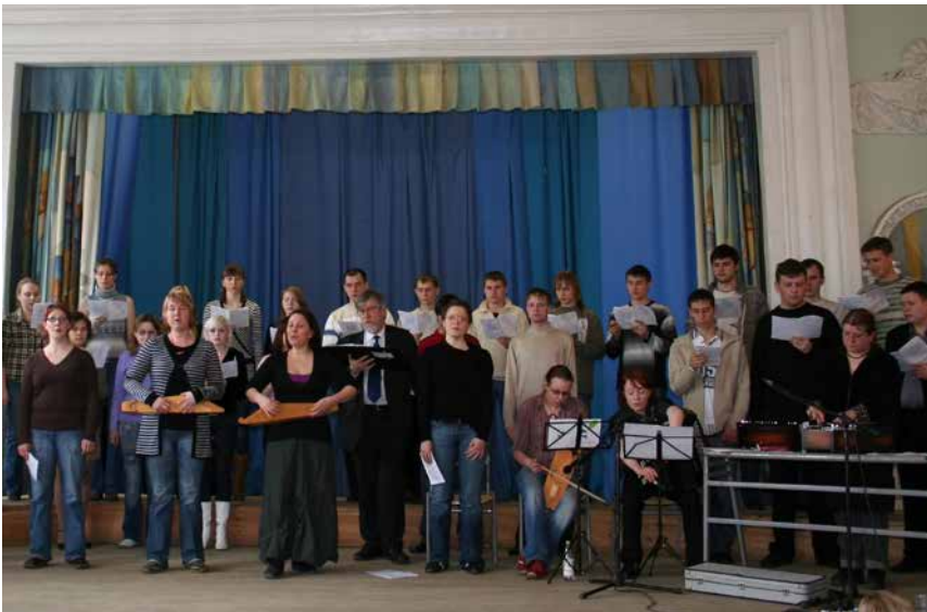
Kuva 67. Kuopiolaisryhmä esiintyy Saranskin yliopiston kuoron kanssa.

Messu toteutettiin vuonna 2007 Sibelius-Akatemian avajaisjumalanpalveluksena Helsingin Tempeliaukion kirkossa ja Keltossa, Inkerin kirkon koulutuskeskuksessa. Saranskin yliopistossa pidettiin seminaari kansanperinteen käyttömahdollisuuksista nykyaikana. Siellä runolaulumessu oli vahvasti esillä. Virossa runolaulumessua vietettiin Viljandin kansanmusiikkifestivaalilla, ja Suomen lähetysseuran