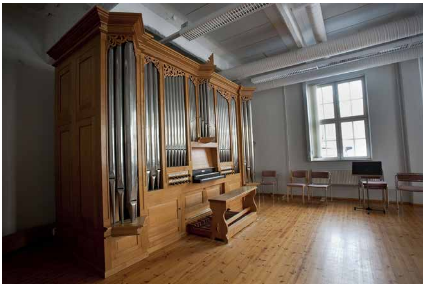
Kuva 21. Verschueren-urut Hermanninaukion salissa.