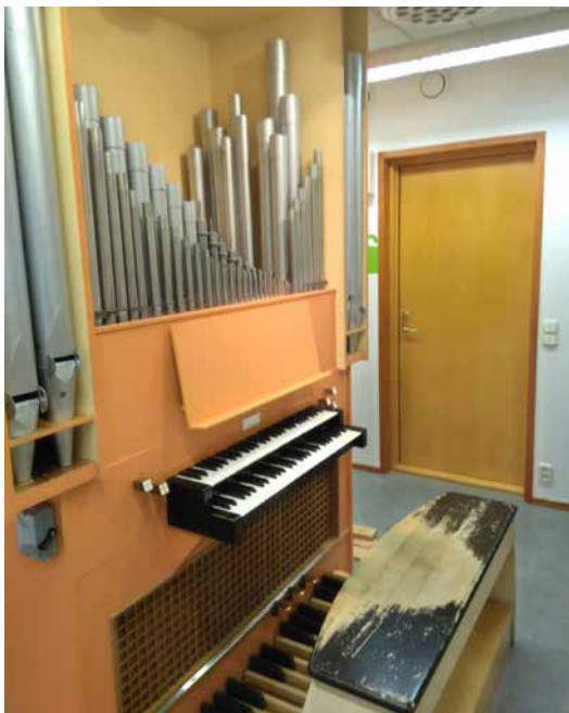
Kuva 12. Ensimmäiset musiikkiopiston omat urut rakensi Kangasalan Urkutehdas 1961. Soittajan penkin maali on edelleen alkuperäinen.