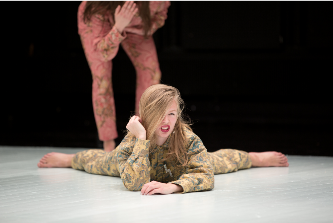
“Being evil” minä.

Kehoni rakensi itseään jokaisessa esityksessä uudella tavalla. Teoksen ruumiillisessa materiaalissa, joka perustui kehomme sytyttämiseen kasvojen kautta, oli niin paljon vapauksia ja mahdollisuuksia ilmetä, että en kokenut kehoni olevan velvollinen tuottamaan tietynlaista liikettä. Toisin sanoen teoksen sanoma ei ollut riippuvainen siitä, millaisen muodon kehoni ottaa liikkeessä eli olin teoksen sisällä aktiivisena toimijana ja vapautettu paineista tuottaa ”oikeanlaista” kehonkuvan muotoa. Teoksen tarjoama kehollinen maasto tarjosi minulle uudenlaisen käsityksen siitä, miten minä voin esiintyjänä teoksen sisältä käsin tarjota uudenlaisia naisenkehon esittämisen tapoja. En ollut tietoinen enää siitä, miltä kehoni näyttää tai miltä sen tulisi näyttää. Sammutin ulkoisen miellyttäjän itsestäni ja kiinnostuin sen sijaan itseni viihdyttämisestä esityksen kontekstissa.