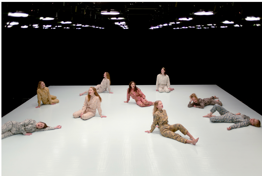
Esiintyjät koston aavikolla, ”Tableau Vivant”, resitaali.

blues”, ”Paljon onnea Angela” sekä ”Kaunis kunnianosoitus Aasille”. Harjoitusprosessin aikana treenasimme harmonioita ja tekstiä sidottuna ruumiilliseen toimintaan antaen ruumiillisen virityksen vaikuttaa tekstiin, vaikka lopullisessa teoksessa tekstille ja ruumiilliselle toiminnalle pyhitettiin omat näyttämönsä.