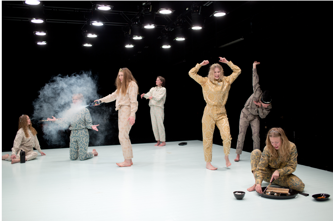
“Festivo”, mehukatit, savukone- Angela, munamankka ja sushi-mestari.

Kimbleä, joku piti kiitospuheen ja minä kokkailin itselleni sushia ”meiningeissä”.