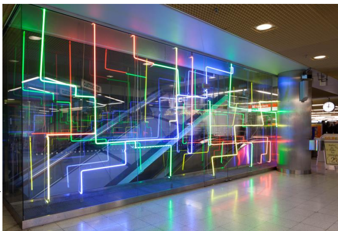
Kuvat 1.–3. Annikki Luukelan neonvaloinstallaatio Verkosto (1995) Helsingin Yliopiston metroasemalla (entisellä Kaisaniemen metroasemalla) Kaisaniemessä.

Luukela on käyttänyt teoksissaan valoa monessa muodossa: valokinetiikkaa, projisointeja, hologrammeja, laseria, neonia sekä lediä. Luukelan taidetta on ollut viime vuosina esillä esimerkiksi Suomen valokuvataiteen museossa Kaapelitehtaalla Abstraktii! -näyttelyssä 2017–2018, Aineen taidemuseossa Torniossa Focus 2023 -näyttelyssä 2023–2024 sekä Hyvinkään taidemuseossa, Hillitön valo -näyttelyssä 2023–2024. Kuvataiteilija Liisa Hamarilan 65 mukaan Luukelan töissä ”aistit tavoittavat jotakin kätkettyä” ja ”valon piirrolla tilassa on tajuntaa laajentava vaikutus, portti uuteen ulottuvuuteen”.