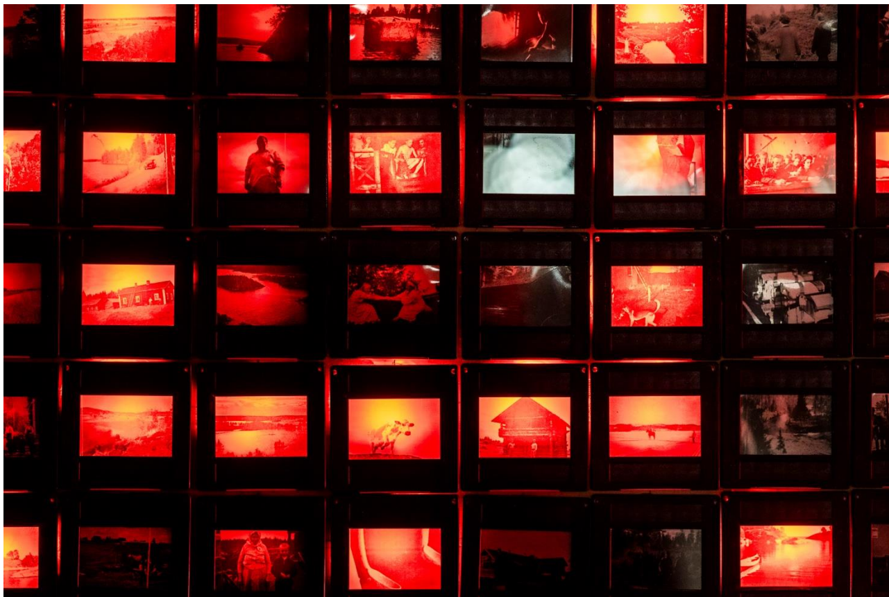
179 Kuvat 8.–9. Siri Haapasen valotaideteos Juurehine (2025) sai ensiesityksensä Lux In -näyttelyssä Kaapelitehtaalla, osana Lux Helsingin ohjelmistoa.