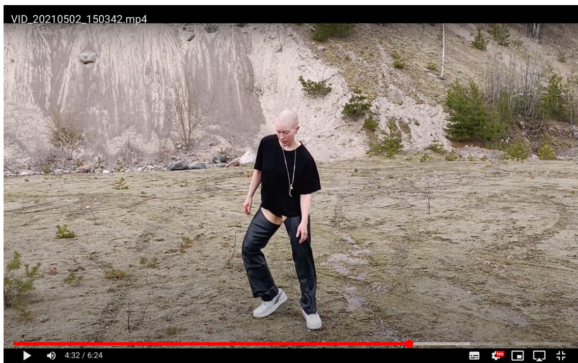
Hakuvideo 1, 2021.

Teen yhden annetuista kolmesta pääsykoetehtävästä reflektoiden synnytykskokemustani. Mietin miten kuvaila kokemusta sisältä käsin? Synnytys, synnyttäminen, mitä se on? Palaan Argonauttien äärelle ja Nelson kirjoittaa: “Kivun luolassa on oma lakinsa ja se laki on musta vapina (Nelson 2018, 183).” Tämä on mielestäni osuva kuvaus ja voisi olla myös videotehtäväni nimi tai otsake. Samastun myös Nelsonin kokemukseen fysiikalleen antautumisesta synnyttämisen tapahtumassa: “Pidän fyysisistä kokemuksista, joihin liittyy antautuminen. En kuitenkaan tiennyt juuri mitään kokemuksista, jotka pakottavat antautumaan - jotka jyräävät ylitse kuin rekka eikä niitä pysäytetä millään turvasanalla.” (Nelson 2018, 192.) Ajattelen sitä, kuinka antautumista ei vaadi ainoastaan synnytys, jossa jotakin puristuu lävitseni, vaan koko sen jälkeinen elämänvaihe, jossa kontrollista luopumisen harjoittaminen muodostuu keskeiseksi osaksi taiteilijuuttani ja minuutta.