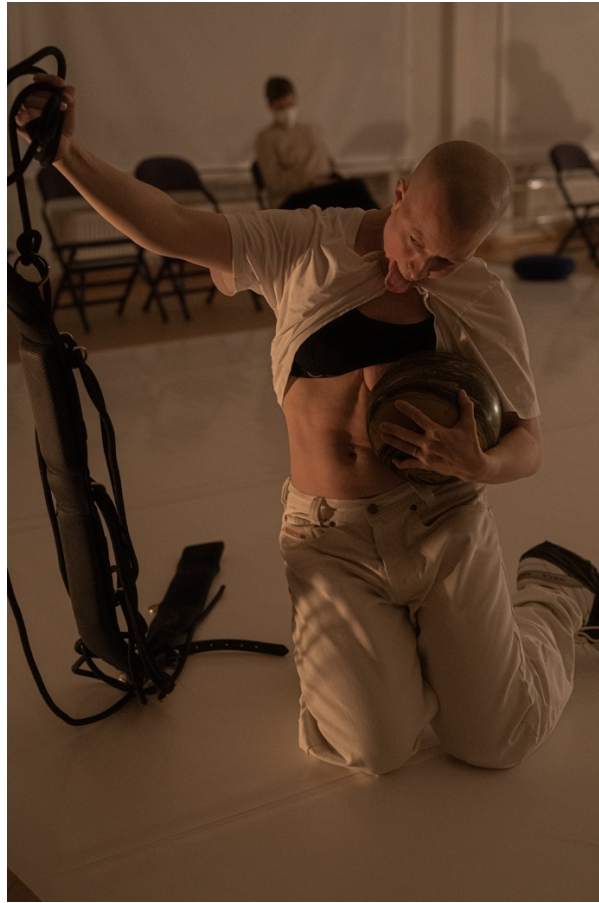
we share waters , 2021.

I make toddler dances Taaperotanssit on parhaat