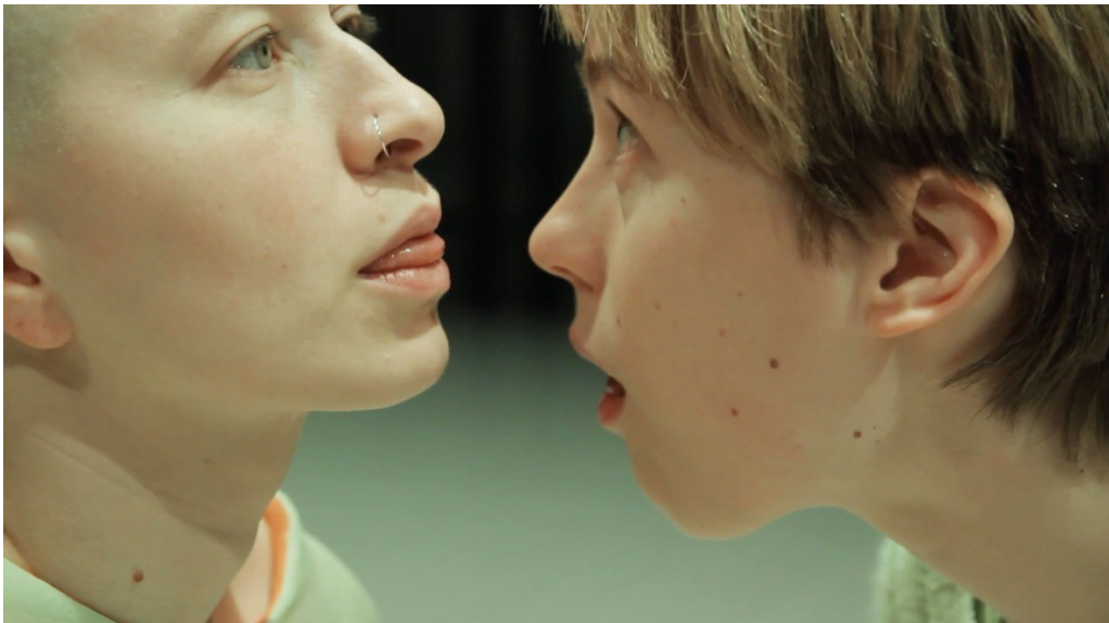
Näyttökuvaa Outoliinin trailerista, 2023.

Ja sitten on leikki, intimiteetti, höpsöys. Siitä kirjoitan suhteessa taiteellisen opinnäytteeseeni Laura Jantusen teoksessa Outoliini / Oddling . Teos sai ensi-iltansa Teatterikorkeakoulun studiossa 2, kolmastoista helmikuuta 2023. Outoliinin prosessissa ja Outoliinissa teoksena on sukulaissieluisuutta soolopraktiikkani kanssa molempien liikkuesssa intimiteetin, jonkinlaisen outouttamisen ja nyrjähtäneisyyden äärellä. Ruumiiseen pesiytynyt Outoliini säikähtää ja katoaa herkästi tavoittamattomiin. Siksi sijoitan sen myös