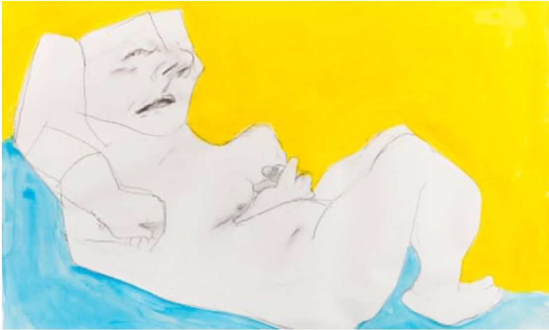
Maria Lassnig, Woman in the bed , 2002.