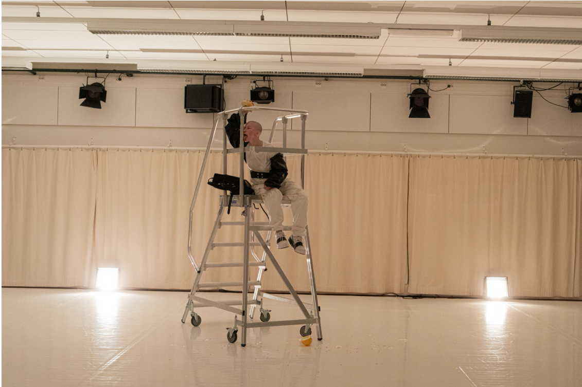
we share waters -soolotyö, 2021.

ja moneen suuntaan leviävä, itsensä jotenkin lopulta koossa pitävä, silti uhmaava, kysyvä, sottaava ja huomiosta nauttiva. Mittakaavat muuntuvat, elävät ja venyvät.