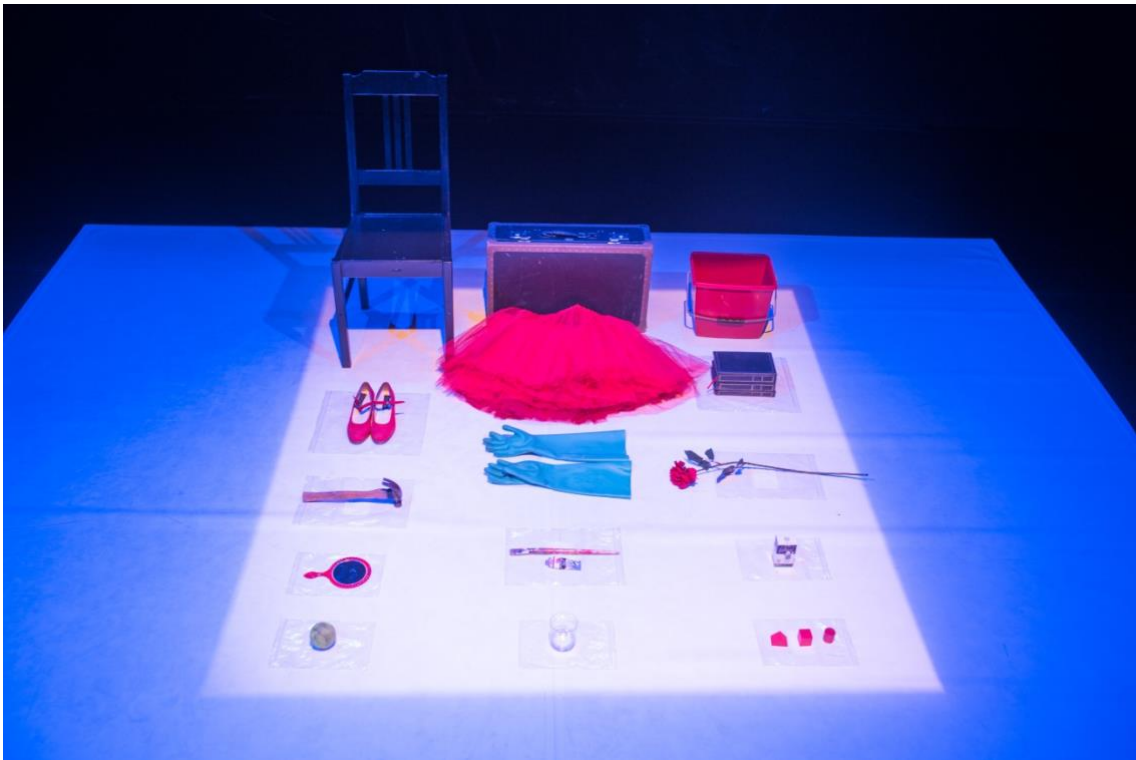
Esineiden asetelma prologin jälkeen.

Se hetki, jolloin olisin voinut olla ajankohtainen, relevantti ja sopiva meni jo. Olin hidas ja nyt tuon hetken momentum on jo ulottumattomissani. Tanssijan prime time on ohikiitävä hetki. En koskaan ehtinyt havaita seisseeni sen kohdalla. Mutta – tanssinut minä olen. Tanssin edelleen. Minun ei tarvitse kuin vain sulkea silmäni ja pystyn uppoamaan tanssiin ihan itsekseni kysymättä keneltäkään lupaa. Sitä minusta ei ole saatu kitkettyä pois. Voin tuntea tanssin kuplivan sisälläni – aina vain.