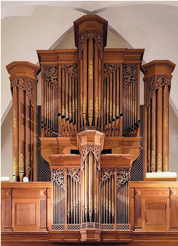
Kuva 1. Jaegersborgin kirkon vuonna 1944 valmistuneet Marcussen & Søn -urut.