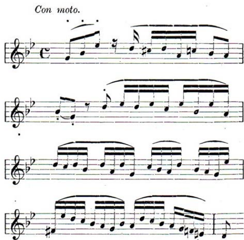
Nuottiesimerkki 1. Oskar Merikannon antama teema (Merikanto 1907a, 188).

Minulla oli tilaisuus antaa yhdelle prof. Guilmantin oppilaalle urkuttunilla teema; sitä hän vähän aikaa silmäili ja sitten suoraapäätä ja kertaakaan kompastumatta tai haparoimatta soitti siitä pitkän, suuremman fuugan. Tämä on sekä harvinaisin että suuremman tulos, mihin teorian ja urkusoiton alalla yhdessä voidaan päästä. Teema oli muuten tämänköinen: