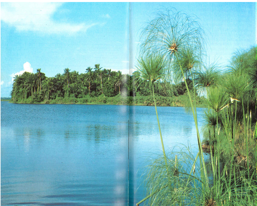
Kuva 2; Valokopio maisemakuvasta Le Congo Aujourd'hui - kirjasta.

Katalogi-matkaopissa Le Congo Aujourd'hui (suom. Kongo tänään), on kuvattu saturoituja vehreitä maisemia meren rannalta ja Kongojoen varrelta. Soittaessamme videopuheluita tätini kanssa hän esittelee pihallaan kasvavaa mangopuutaan, jonka kanssa hän myös poseeraa Facebook-profiilikuvassaan. Jos kävisin Kongossa, ottaisin todennäköisesti samankaltaisia kuvia kuin mitä katalogi tarjoaa ja poseeraisin myös mangopuun vieressä. Haluan saada osani kuvien tarjoamasta viehätystä.