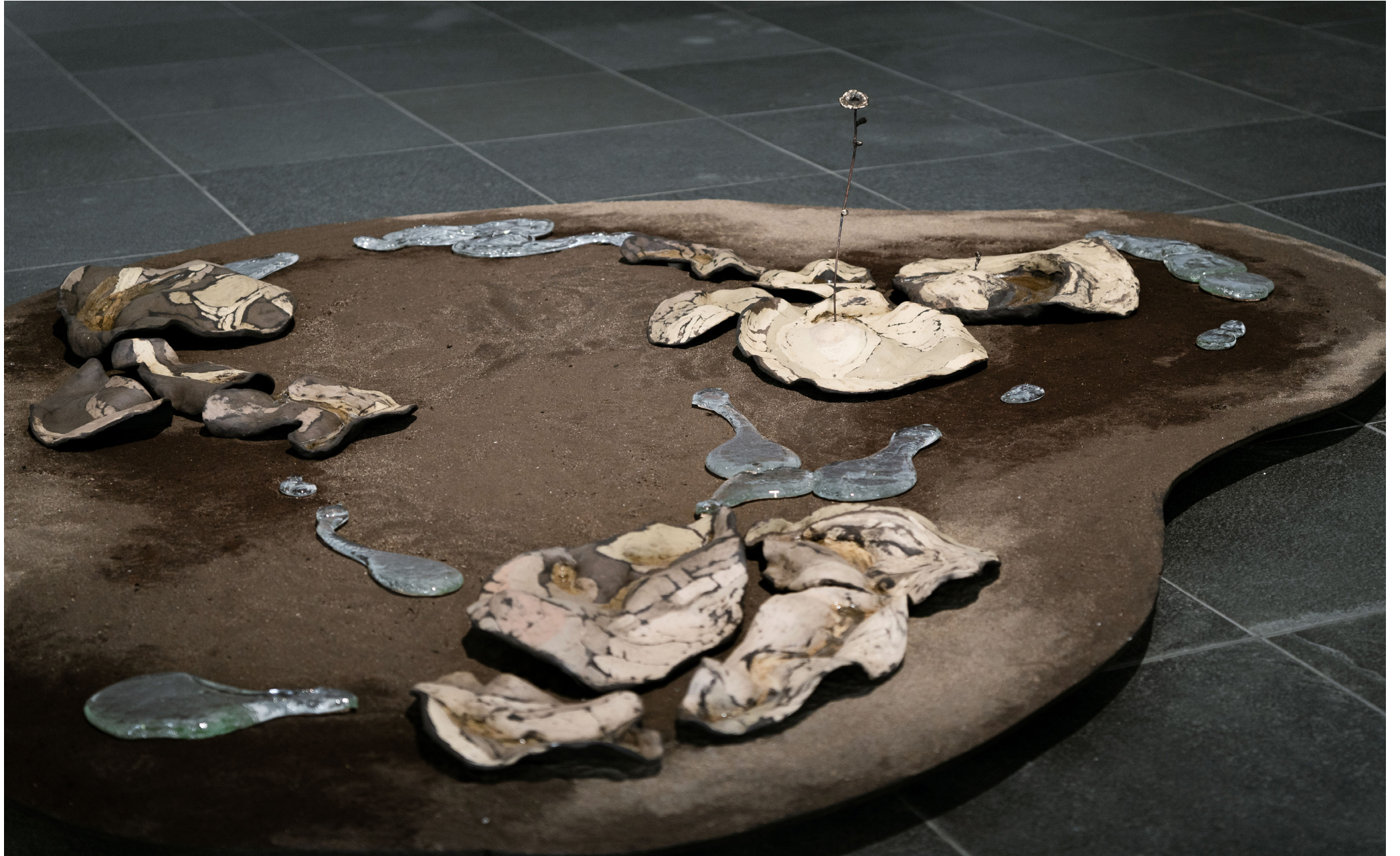
Kuva 9; Olosetu Oulun taidemuseon Tomun Tieto -ryhmänäyttelyssä.