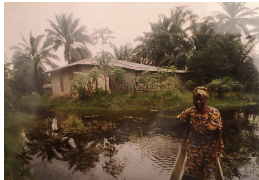
Kuva 3; Valokuva Mossakasta.

Näin siirryin hetkeksi kauemmaksi itsestäni ja lähestyin maisemaa haastatteleamalla ihmistä, jolla olisi paikasta runsaasti muistoja. Äänitin isäni kanssa käytyjä keskusteluja, jossa hän kertoi elämästään keskittyen muistoihin Kongosta. Keskusteluissa tuli usein esille veden läsnäolo: Kongojoen varrella asuminen ja meloen kuljetut koulumatkat. Isäni oli kotoisin kalastajakylästä Mossakasta, Kongo-Brazzavillestä. Hän kertoi, että likubalaiset kalastajat asuvat tyypillisesti kahdella saarella: toisessa, jossa kalastetaan ja toisessa, jossa perhe asuu.