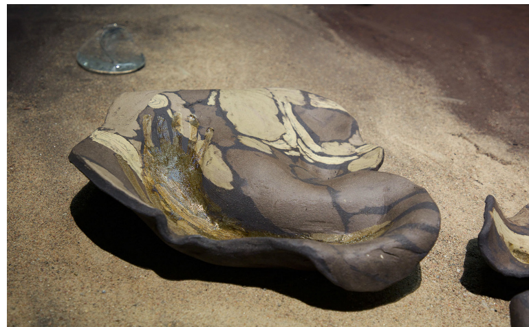
Kuva 8. Lähikuva Oloseudusta Kuvan Kevät-näyttelyssä.

Tuntui, että Oulussa olin saanut uuden mahdollisuuden näiden ärsytysten korjaamiseksi. Levänneenä ja omassa rauhassa pystyin katsomaan teosta terveen kriittisesti ja luottamaan tunteisiini siitä, mikä tuntuisi oikealta. Olin tyytyväisempi Oulussa olevaan esillepanoon, mutta koen, että teoksen versiot sekä Kuvan Keväessä että Oulun taidemuseossa olivat juuri sellaiset kuin niiden pitikin olla. Teokseni tarkoituksena oli pyrkiä heijastamaan senhetkistä olotilaani ympäristössäni, joten koitan tarkastella lempein silmin sinun, Oloseudun, kankeutta, karuutta ja sulavuutta kaikkina aikoinasi.