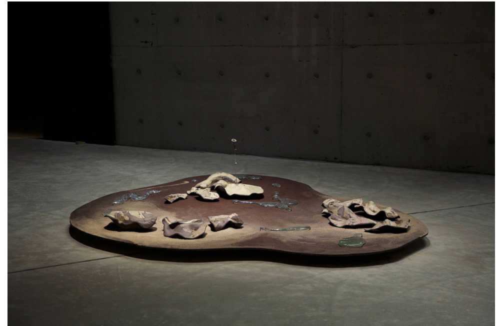
Kuva 4; Liisa-Irmelen Liwata, Oloseutu , 2024.

Ainoa horisontaalisuudesta poikkeavat elementit ovat pronssiosat. Toinen niistä on silmää muistuttavan keramiikkaosan pupillista kohoava napakka pronssinen kukka. Silmän viereisestä laatasta puolestaan nousee pienempi, vielä nupullaan oleva sellainen.