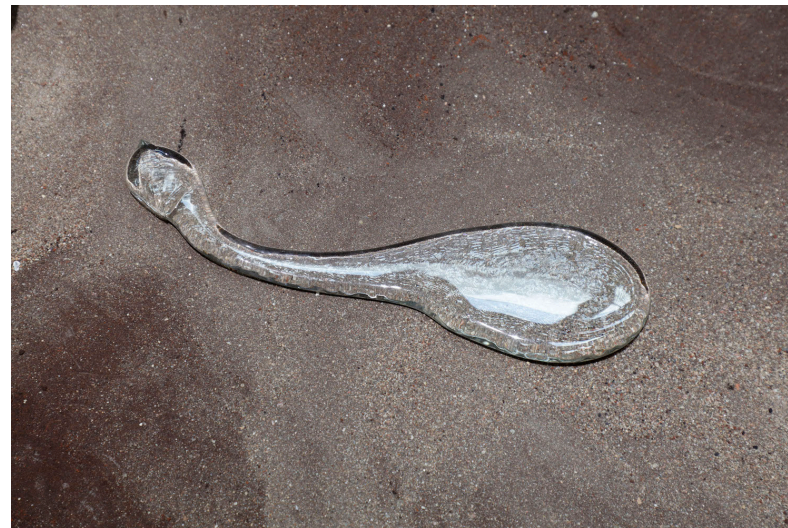
Kuva 7; Teoskuvia Oloseudusta Kuvan Kevät-näyttelyssä.