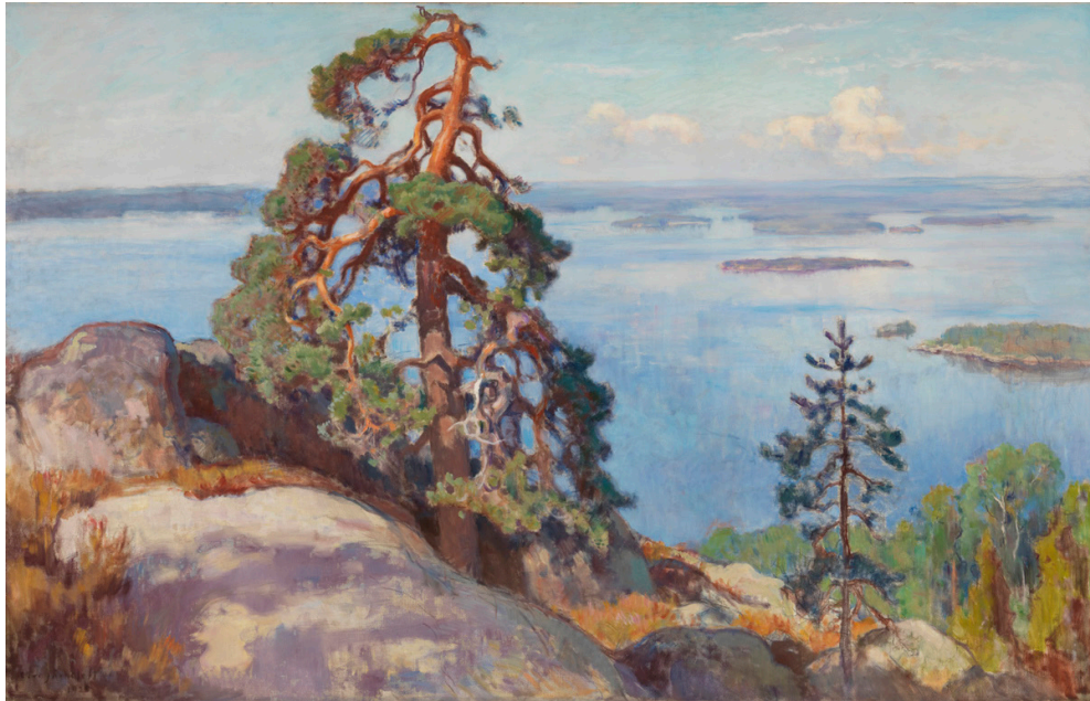
Kuva 1; Eero Järnefelt, Maisema koltilta (1928).

Haluaisiks sä mut jos mä olisin männynneulanen? Sellasen luikeron männyn kiiltävin neulanen, johon illan kultaiset säteet laskeutuis. Mun luokse valettais huonoilla lenkkareilla kivikkoisen reitin läpi. Otettais monta kuvaa eikä ketään haittais että mulla on sama asento. Niille tärkeintä olis, että ne saa palan musta ja vähän järveä ja taivasta taustalle. Ne laittais mun kuvia nettiin ja lähettäis sukulaisille. Ne olis musta tosi ylpeitä. Olisinks mä sulle yhtä erityinen? Sellainen, jota sä haluaisit suojella. Sellainen, jonka puolesta sä tappelisit.