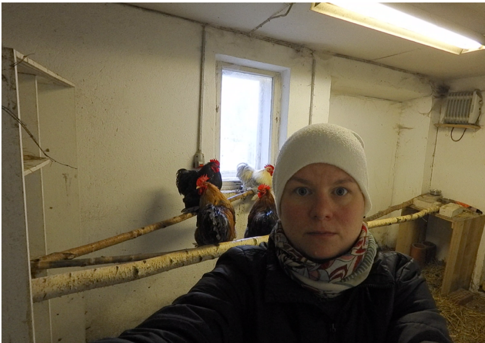
Peräkammarin kukot ja minä 8.11.2023

Kun aloitin työskentelyn Tuulispäässä koin esittäväni, melko epävakuuttavasti, jonkinlaista maatilalan työntekijää/eläintenhoitajaa/vapaaehtoistyöntekijää. Tehtävät olivat minulle vieraita, työvälineiden käyttö ei tuntunut luontevalta enkä tuntenut paikkoja. Samalla lukuisat silmäparit tarkkailivat minua ja toimintaani. Tulin erityisen tietoiseksi minua seuraavista silmäpareista, kun työskentelin ensimmäistä kertana lintujen talossa, eli niin kutsutussa Kukkolandiassa .