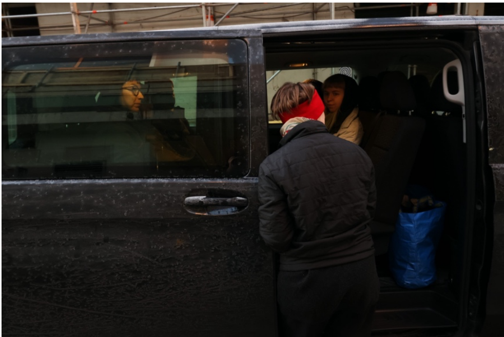
Minä toivottamassa osallistujat tervetulleiksi esitykseen

Olin vuokrannut tila-auton tapahtumaa varten, jota ajoin itse, koska olin työryhmäni ainut jäsen, jolla on ajokortti. Tehtäväni kuskina teki minusta esityksen matkaosuuksilla hieman merkillisen kuljettajahahmon, joka istui selin muuhun ryhmään nähden primääritehtävään, eli ajamiseen, keskittyen. Olin irrallaan muusta ryhmästä enkä kuullut suurinta osaa matkustamon puolella käydystä keskustelusta.