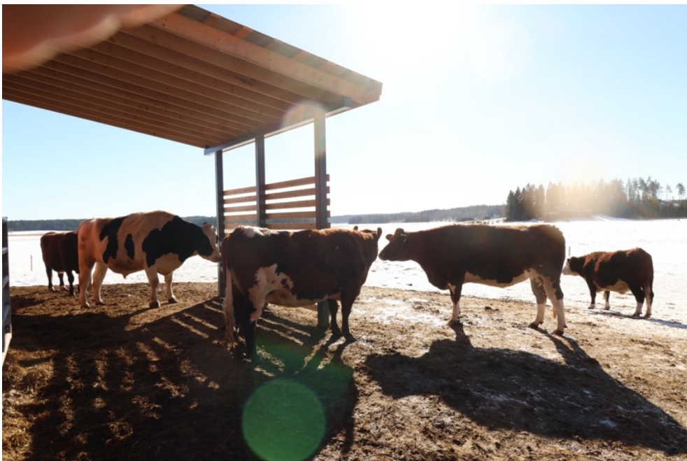
Hanna, Lennu, Maissi tai Herne, Paprika ja Sipuli pihalla 6.3.2024

Kanssakäymisessä Tuulispään toisten eläinten kanssa jaetun puhutun kielen puuttuminen tuotti minulle lähinnä hämmennystä ja tarvetta löytää muita kuin verbaalisia tapoja toimia yhdessä ja sopia asioista. Usein tilanteet johtivat tärkeiden kysymysten nousemiseen ja oman esiymmärryksen kyseenalaistumiseen, mikä johti usein merkityksellisiin oivalluksiin. Sen sijaan jouduin haluamattani pidättäytymään tietyistä kanssakäymisen muodoista oman turvallisuuteni takia, vaikka kaikkien lähtökohtainen suhtautuminen toiseen olikin kohtaamisissa iloisen leikkisä.