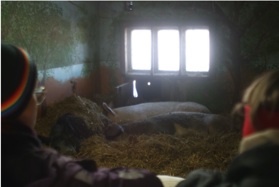
Osku, Papu tai Lilla ja Saara tai Siiri päivänunilla

Osa ryhmästä erkaantui siivoamaan pupulaa, eli Vanun, Rumpalin, Jalon, Petteriinan sekä muiden citykanien kotia, kun taas toiset kävivät siivoamassa ponien, eli Niksun ja Aatun, sekä lampaiden Runon, Unelman, Lapasen, Viton, Elovenan ja Unnan talleja. Lisäksi kaksi ihmisosallistujaa pilkkoivat sikojen tuoreruuat iltapäivän ruokintaa varten. Aamupäivän rupeaman päätteeksi kokoonnuimme ylävuohien , eli Uljaksen, Lumikin, Bambin, Saiman ja Unin, sekä kettujen, eli Nuppusen, Lumin ja Viiman aitausten tuntumaan oleilemaan ja seuraamaan toistemme puuhia. Osa meistä katseli, kun kolme vuohista hyödynsivät ovea auki pitävää narua raaputtaakseen päätänsä sarviensa takaa. Yhdellä ihmisosallistujalla oli erityiseltä vaikuttava hetki uusimman kettutulokkaan Nuppusen kanssa, joka tuli aivan aidan tuntumaan olemaan. Nuppunen asustaa toistaiseksi kettuaitauksen talon puoleisessa aitauksessa ja kaksi muuta kettua, Viima ja Lumi, sen toisessa päässä. Jako tarjoaa ketuille rauhaa tutustua toisiinsa ensin aidan läpi, ennen koko tarhan avaamista kaikkien jaettavaksi. Viima-kettu oli tullut omalle puolelleen aivan aitauksia erottavan aidan luokse tarkkailemaan Nuppusta. Nuppunen ei tuossa hetkessä uskaltanut Viiman lähelle, mutta katseita vaihdettiin. Ihmisosallistuja tuli osaksi Viiman ja Nuppusen katseiden (ja epäilemättä hajujen) avulla käytyä uteliasta kanssakäymistä.