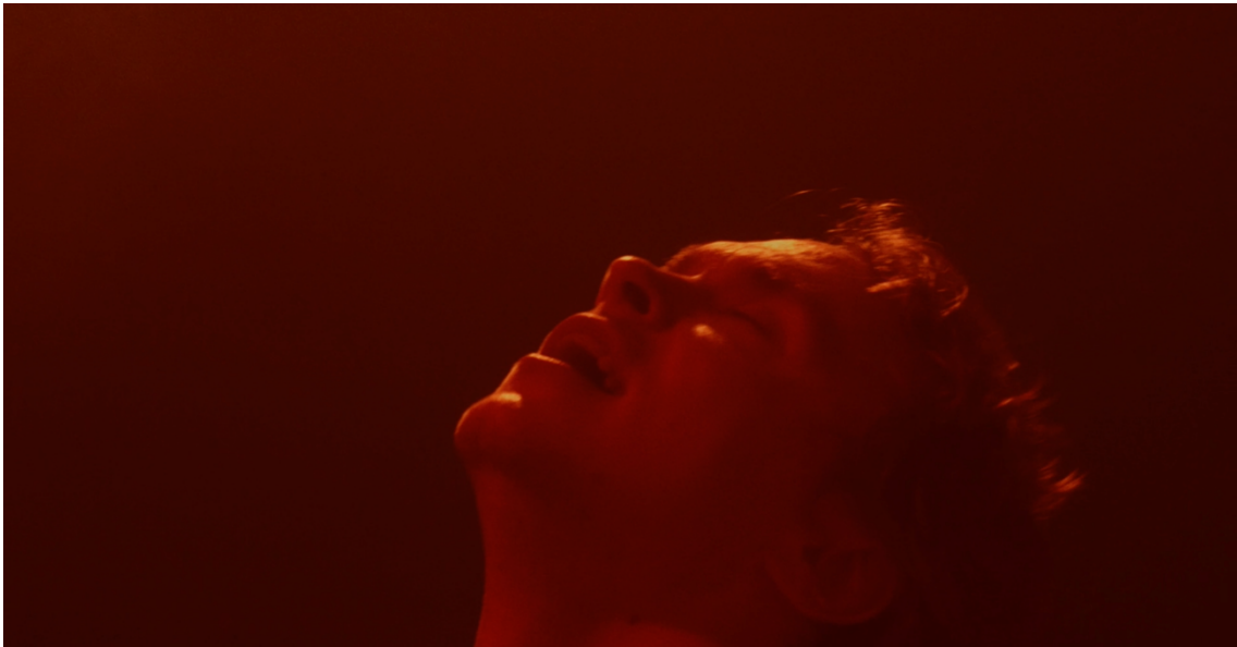
Release 6. Kuvakaappaus Release elokuvan loppukohtauksesta. 2024.

unohtuu. Totta kai työtä saa arvostaa korkealle ja tehdä sitä suurella intohimolla, niin pitääkin. Tuohan se onnellisuutta elämään, mutta onnellisuus ja itsensä arvostaminen ei voi heijastua sen kautta. Sillä on merkittävästi enemmän arvoa, olenko mukava ihminen, onko minulla ihmisiä ympärilläni, olenko rakastettu ja osaanko rakastaa, kuin sillä kuinka ison roolin saan laadukkaassa draamassa, näyttämöllä tai saanko tunnustusta omista taideprojekteistani. Olen empaattinen, lojaali, intohimoinen, kohtelias, muut huomioonottava. Keskityn ensisijaisesti siihen. Haluan kyllä olla hyvä, siinä mitä teen ja haluan tehdä töitä suurella sydämellä niin kuin tähänkin asti, mutta sen sijaan, että tavoittelen muiden hyväksynnän saamista itselleni, oman taiteeni kautta, aion tavoitella rehellisyyttä itselleni. Aion tehdä jatkossakin minua koskettavaa taidetta, ajattelematta muiden mielipidettä lopputuloksesta. Panostan itsestäni huolehtimiseen, entistä parempaan itsetuntemukseen ja kaikin puolin ihmisenä kasvamiseen. Näin pystyn panostamaan entistä enemmän ystäviini, perheeseeni ja rakkauteen. Kaikkeen, joka oikeasti määrittää minut, kaikkeen, jolla on isoin merkitys elämässäni. En halua olla maailman paras. Haluan olla maailman paras versio Julius Susimäestä.