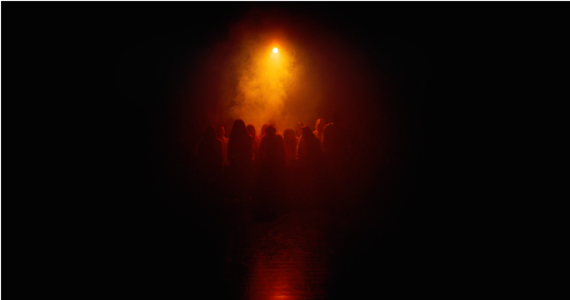
Release 5. Kuvakaappaus Release elokuvan loppukohtauksesta. 2024.