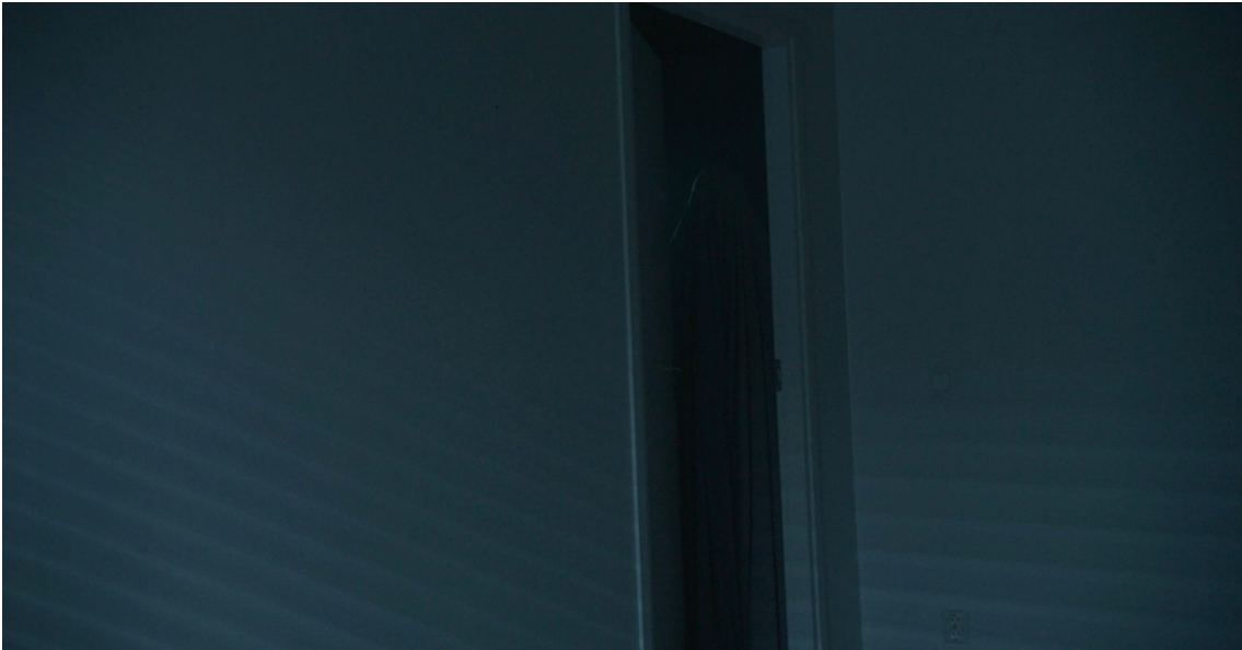
Release 4. Kuvakaappaus Release elokuvasta. Mörkö kurkkimassa oven raosta. 2024.

Pukusuunnittelulla on elokuvassa harkittu merkitys. Mörköjen kaapujen lisäksi, joita käytetään elokuvan alussa ja keskikohdassa, kohtauksissa käytetään valkoisia alusvaatteita. Ne symboloivat ihmisten samankaltaisuutta ja puhtautta.