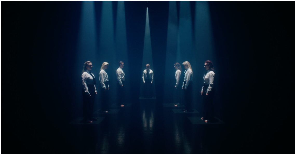
Release 2. Kuvakaappaus Release elokuvasta. Neliömuotoiset spottivalot elokuvan loppukohtauksesta. 2024.

Alkupuoli sijoittuu kerrostaloasuntoon. Asunto on nelikulmaisen muotoinen ja ahdas. Halusin tällä tuoda klaustrofobisen ja vankilamaisen atmosfääriin. Olen ajatusteni vankina. Neliömuoto nähdään ensi kerran elokuvan ensimmäisessä kuvassa. Kerrostalon seinää täyttää nelikulmaiset kuviot. Asunnon lisäksi myös yöpöytä on saman muotoinen. Loppukohtauksessa palataan alun tunnelmaan ja kohtaus alkaa syttyvillä, neliömuotoisilla spottivaloilla.