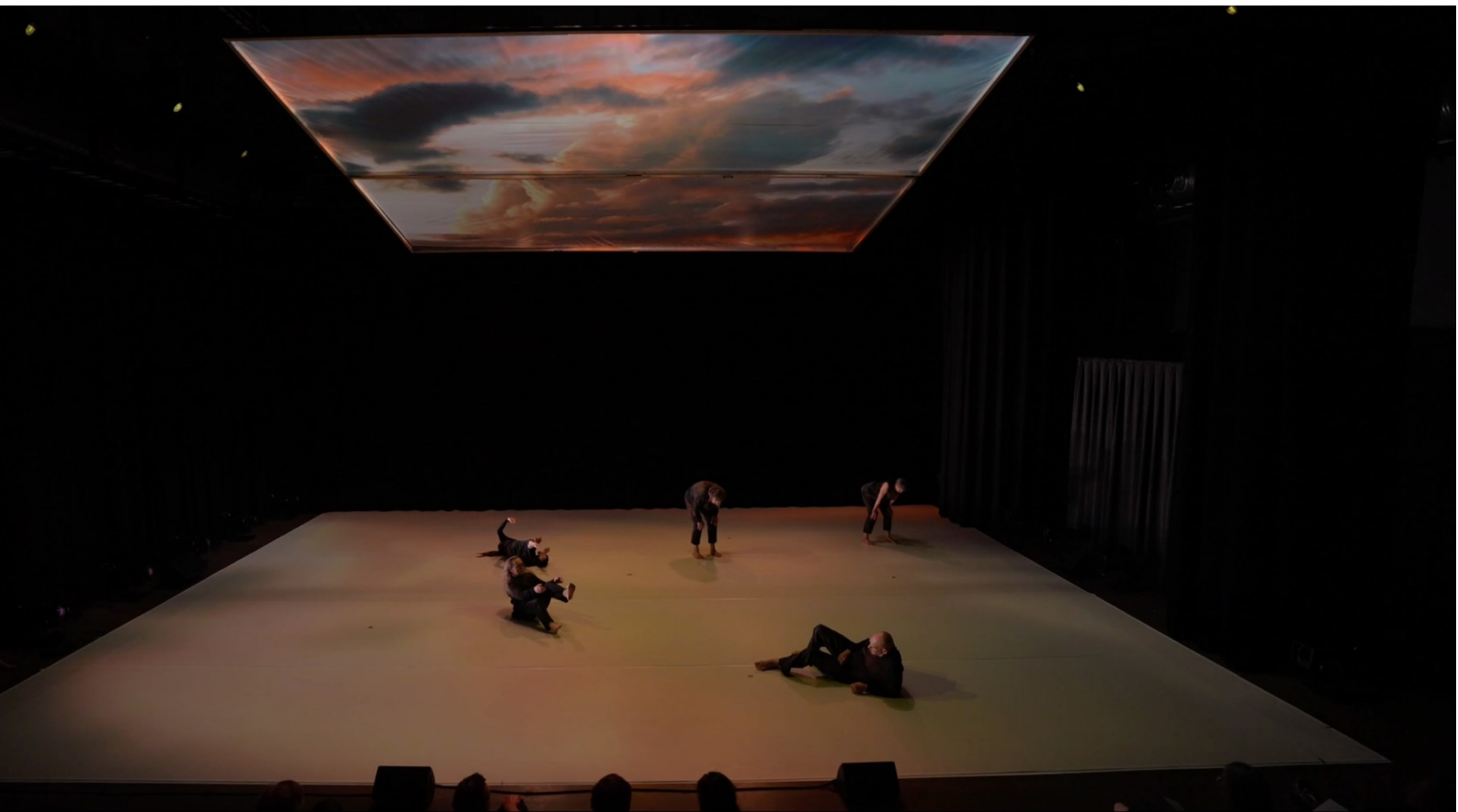
Kuva 9. Kantaja (2025), esityksen ensimmäinen puoliaika, kuvakaappaus esitystallenteesta.

Valosuunnittelun medioituminen tapahtuu siinä, miten valo, tila ja esityksellinen todellisuus rakentuvat teoksessa mediateknologioiden ja niiden logiikoiden kautta. Medioituminen konkretisoituu videotykin ympärille, sen käyttöön ja sen kautta syntyvään intermediaalisuuteen. Kantajassa suunnittelun lähtökohtana oli käyttää videotykkiä, ja ajatuksena oli käyttää sitä nimenomaan valollisesti. Jo lähtöpremissi suunnitteluun oli medioitunut, sillä mediateknologia, tässä tapauksessa videotykki, ohjasi suunnittelua tiettyyn suuntaan. Se ehdotti työskentelytapoja ja sitä, millaista valoa näyttämölle oli mahdollista rakentaa. Videotykin oma logiikka vaikutti taustalla suunnitteluun ja täten taiteelliseen ajatteluun.