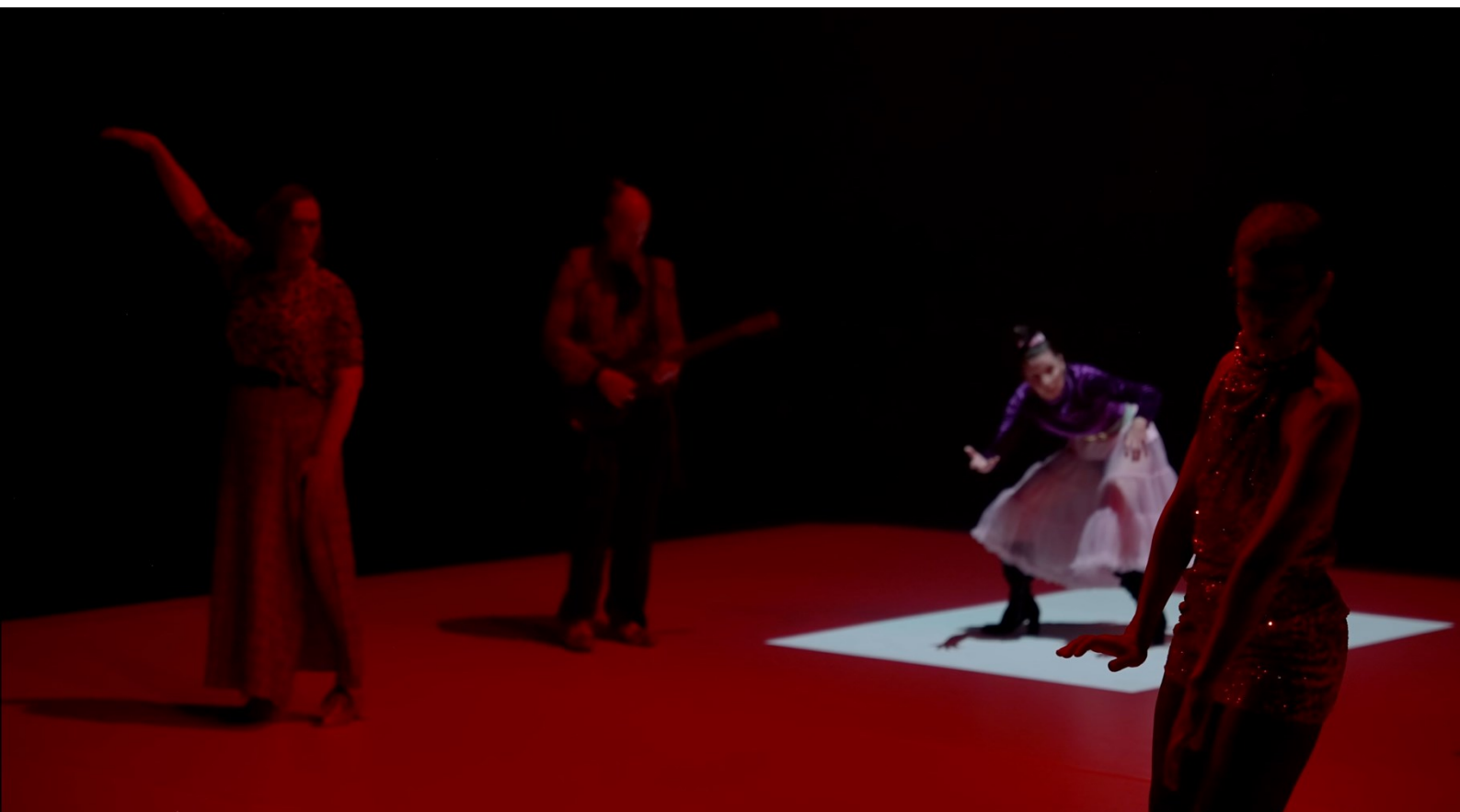
Kuva 8. Kantaja (2025), esityksen toinen puoliaika, kuvakaappaus esitystallenteesta.

Kantajaa tehdessäni pyrin ottamaan huomioon opinnäytteeni kirjallisen osion. En kuitenkaan vielä teosta tehdessäni ollut täysin varma, mitä tarkalleen tulen kirjoittamaan. Olin valikoinut suuntaa antavan aiheen itselleni. Projektiotsikko opinnäytteelleni oli jo myös olemassa: Medioitu valo. En kuitenkaan tässä vaiheessa vielä täysin hahmottanut ja ymmärtänyt medioitumisen käsitettä kokonaisuudessaan. Medioituminen liittyi itselläni nimenomaan mediateknologioiden käyttöön. Medioitunut valo oli minulle tässä vaiheessa tutkimuksellinen tapa lähestyä videota näyttämön kontekstissa. Kiinnostukseni meditoituneeseen valoon ohjasi taiteellista työtäni Kantaja -teoksen parissa. Esimerkiksi suuret videoprojisoinnit tulivat osaksi teosta nimenomaan tutkimuksellisesta kiinnostuksestani. Palaan tässä kirjallisessa opinnäytteessäni myöhemmin medioitumiseen suhteessa Kantaja -teokseen. Aluksi kuitenkin avaan teoreettista pohjaa, jonka kautta pystyn tarkastelemaan teosta ja jonka kanssa käyn dialogia. Medioitumisen teorian on ymmärrettävä, jotta niiden kautta on mahdollista lähteä tutkimaan alkuperäistä tutkimuksen kohdettani: medioitua valoa.