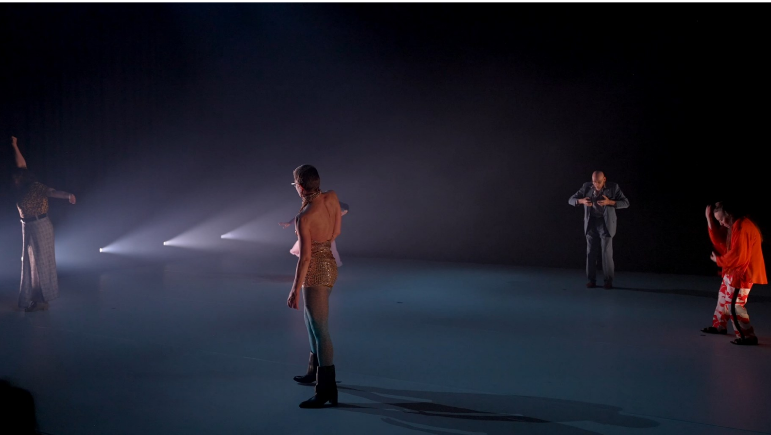
Kuva 1. Kantaja (2025), esityksen toinen puoliaika, kuvakaappaus esitystallenteesta.