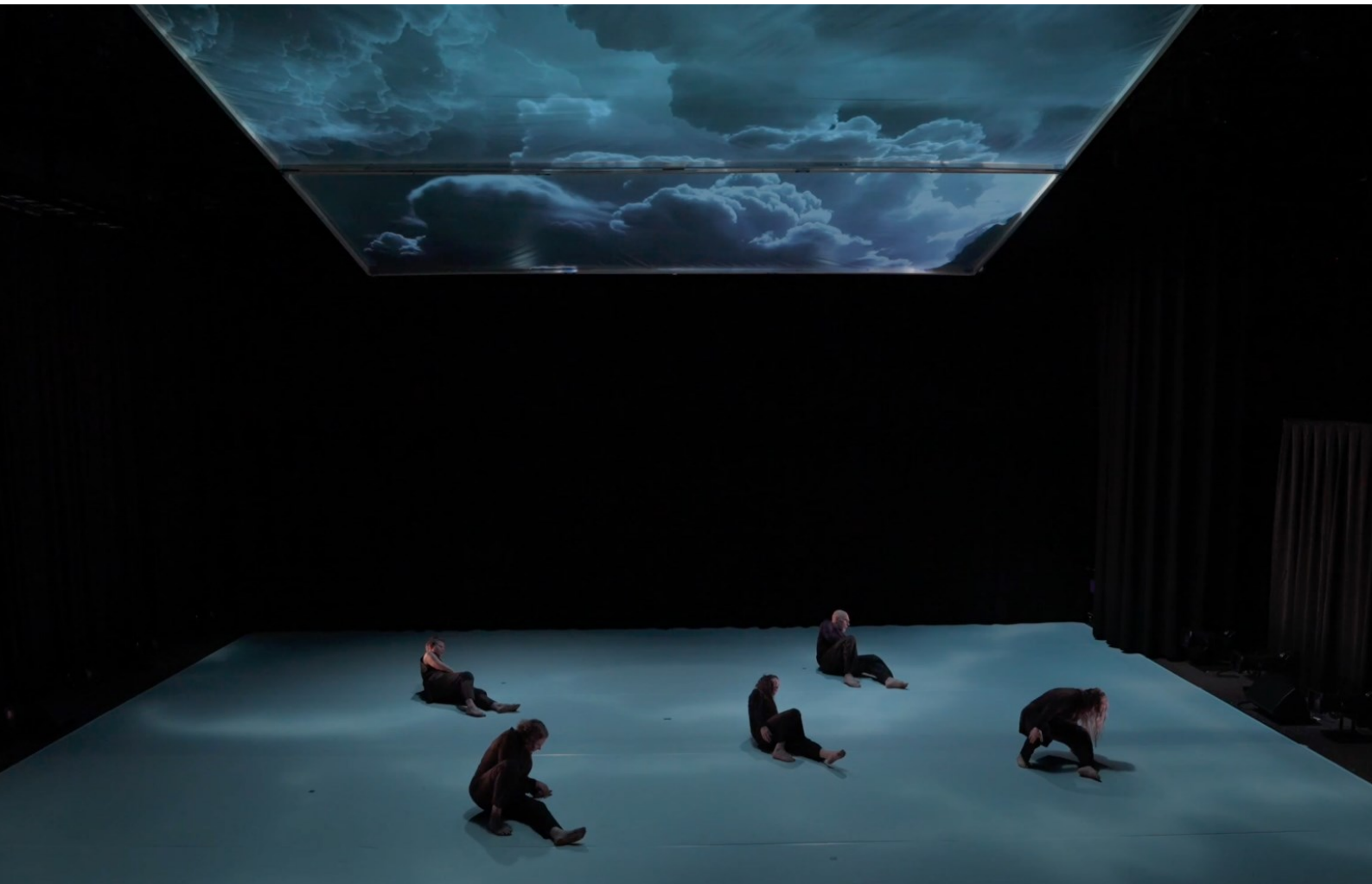
Kuva 4. Kantaja (2025), esityksen ensimmäinen puoliaika, kuvakaappaus esitystallenteesta.

Seuraavassa osiossa kerron Kantajan suunnittelusta ja taiteellisesta prosessista sekä taiteellisesta ajattelusta. Kerron aluksi ennakkosuunnittelusta, josta siirryn kuvailemaan laajemmin taiteellista ajattelua teoksen taustalla: mitä ajatuksia valintojen takana oli ja miksi päädyin niihin. Ennakkosuunnittelusta kertoessani kuvailen myös lyhyesti, kuinka kokeilin käytännössä ideoita ja miten käytännön kokeilut johdattivat suunnittelun suuntaa.