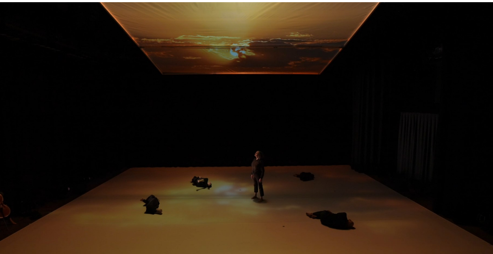
Kuva 7. Kantaja (2025), esityksen ensimmäisen puoliajan loppu, kuvakaappaus esitystallenteesta.