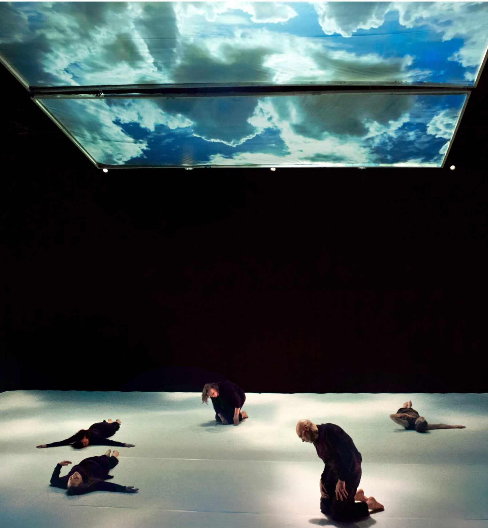
Kuva 2. Kantaja (2025), esityksen ensimmäinen puoliaika, Tanja Ahola.