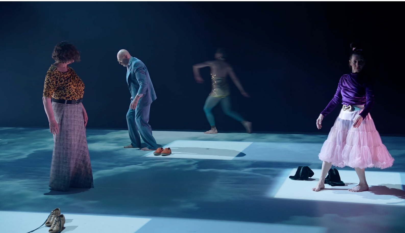
Kuva 6. Kantaja (2025), esityksen toinen puoliaika, teoksen loppu, kuvakaappaus esitystallenteesta.