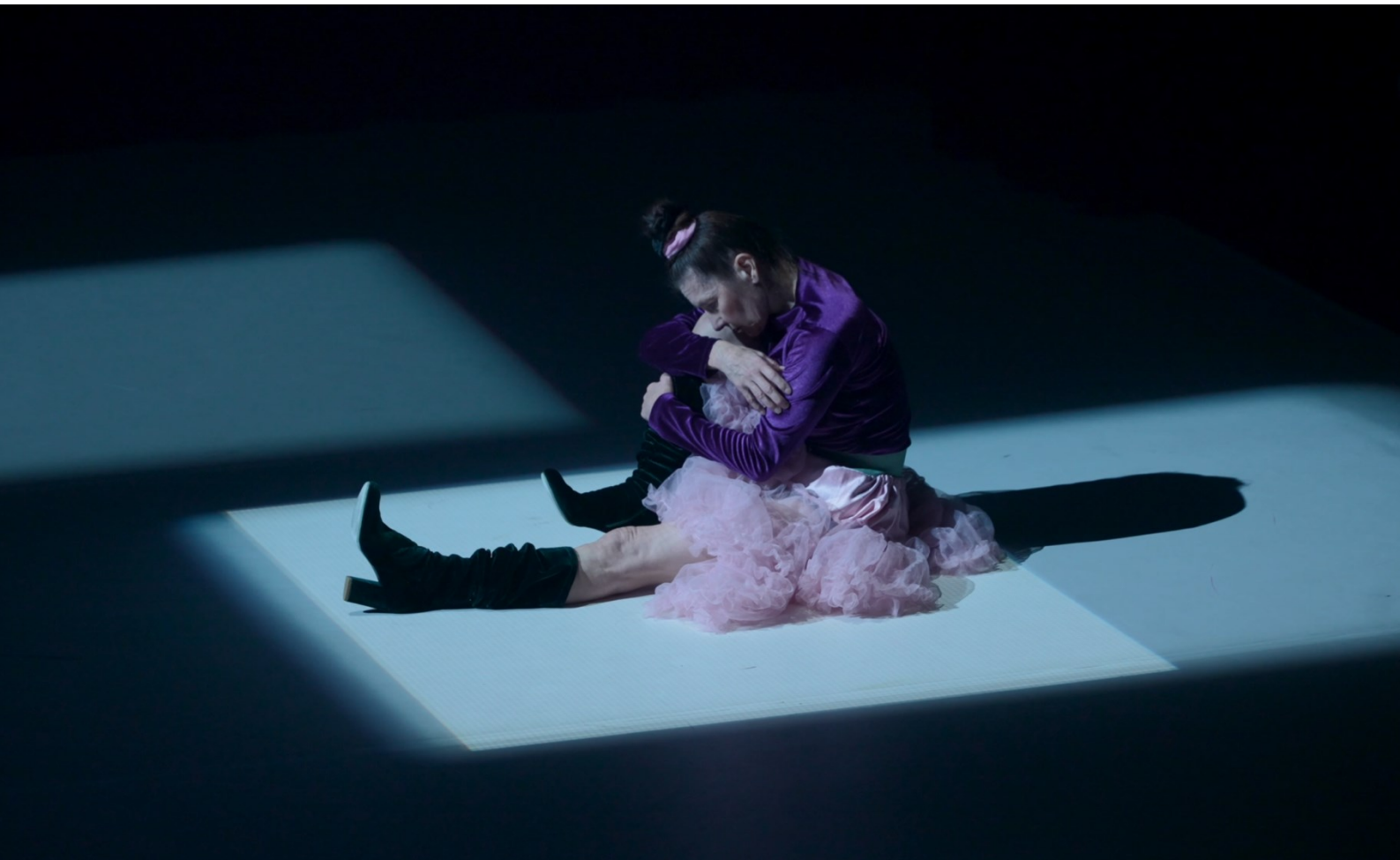
Kuva 3. Kantaja (2025), esityksen toinen puoliaika, kuvakaappaus esitystallenteesta.

Videokuva hyödynnettiin toisella puolella – ei niinkään kuvallisena elementtinä vaan valollisena. Videotykki toimi valonheittimenä, jolla oli mahdollista tehdä tarkkoja rajoja ja geometrisiä valollisia alueita. Videotykillä rajattiin muun muassa valoneliöitä, jotka muodostuivat esiintyjien ympärille ja joihin esiintyjät pyrkivät. Valoneliöt olivat keskeisessä osassa näyttämökuvia ja valollista dramaturgiaa (ks. kuva 3 ). Teos loppui näyttämökuvaan, jossa ensimmäisen puoliajan projisoidut pilvet palasivat näyttämölle, mutta tällä kertaa lattiaan projisoituna (ks. kansilehden kuva).