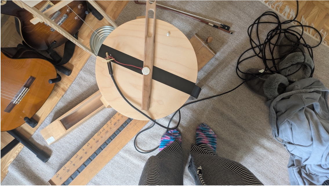
Daksofonin, monokordin, vesiharpun ja urkupillin äänityksiä.