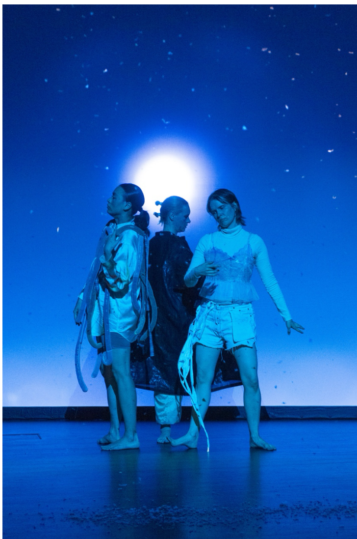
Bliss / Talvi.