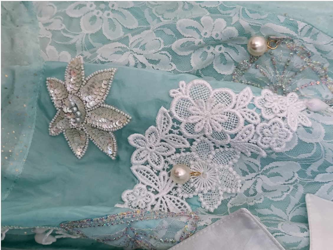
Yksityiskohta äidin asun jakusta.

ajattelevani myös ääntä hyvin haptisena aineksena: se voi olla rosoista, lämmintä tai painavaa.