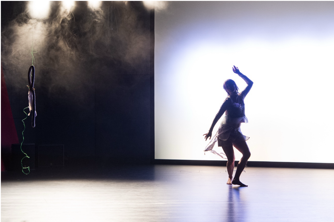
Bliss / Linnut.