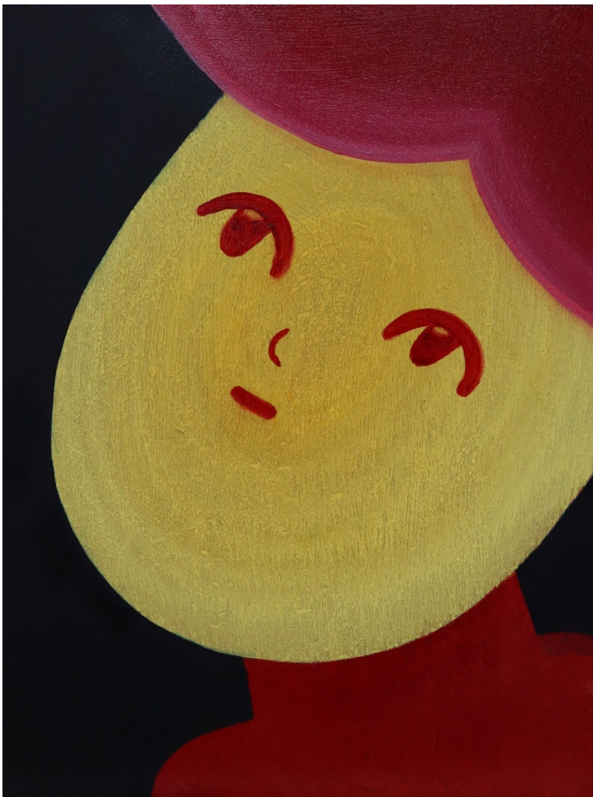
Rivin kuudes maalaus, "taivaalle tuijottelija".