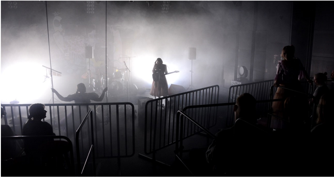
Musiikki ja tekniikka estetiikkana (Aikuisten tyttöjen jytähumppakerho – THE SHOW.)