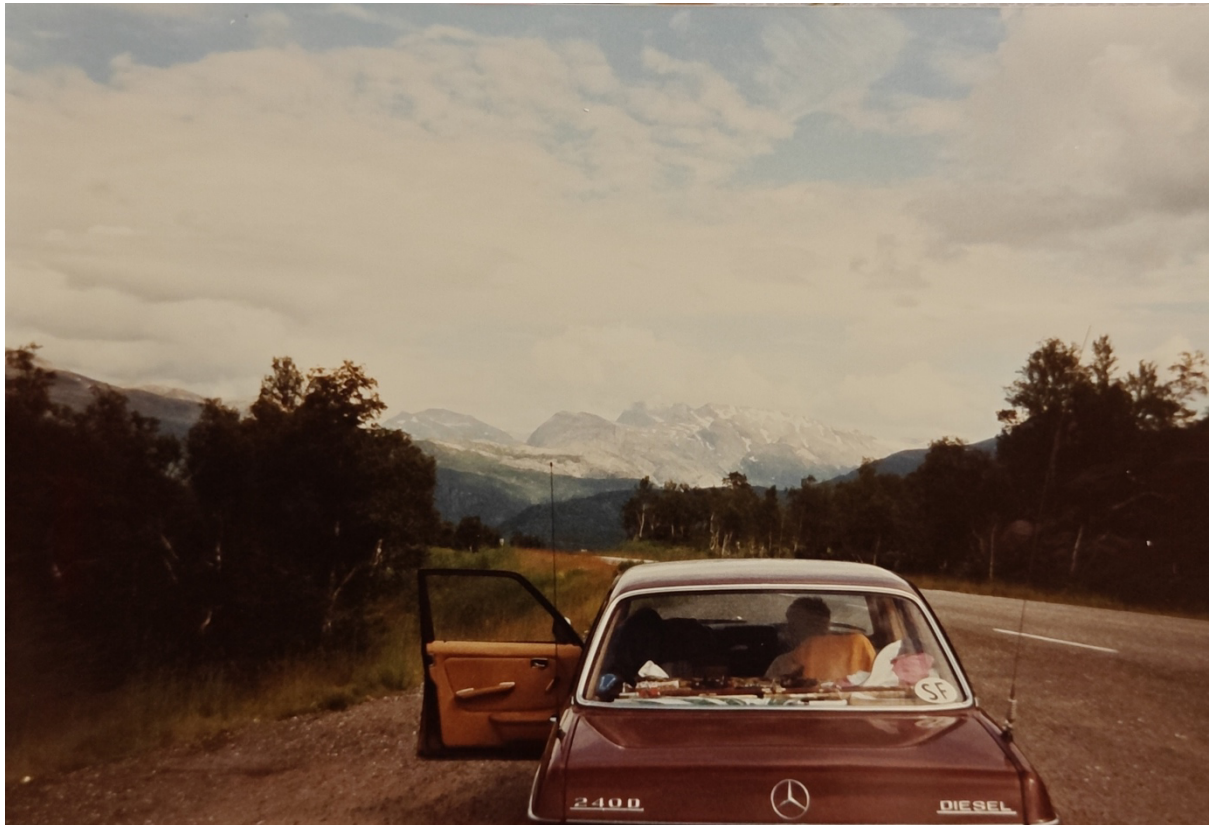
Kuva 3. Maisemakuvaa Ruijasta.

Äsken mainittujen hieman ahdistavien ja pelottavien olotilojen lisäksi mieleen on silti jäänyt hauskojakin muistoja. Huvittavana haastateltaville A ja B on jäänyt mieleen vanha pieni tila keskellä kaupunkia. Tilan tallissa oli hevonen ja sen selässä istui kissa. Heistä tuntui jännittävältä, että keskellä kaupunkia oli sellainen maalaispaikka.