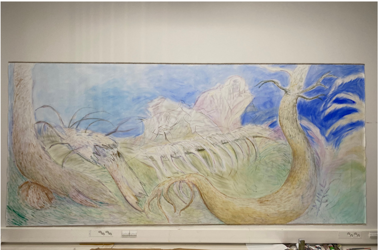
Metsänkehto tekovaiheessa. Kuvissa näkyy iso ero, kun maalia on lisätty, vaikka sävy on yhä haalea. studiolla, 2022.