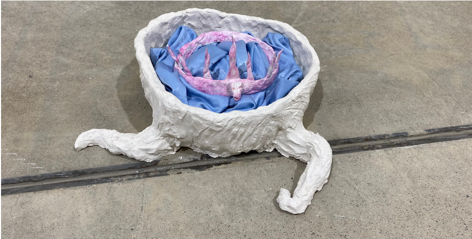
Venla Ekebom, Lähikuva kruunusta kannon sisällä, Metsänkehto teoskokonaisuus. Valokuva: Venla Ekebom, Kuva/Tila, 2022.

Project Roomissa luomaani outo satumetsä jatkoi kasvuaan Kuvan Keväessä. Päätin ottaa Project Roomissa lennelleet pahviset perhoset mukaan Kuvan Kevään ripustukseen, niin että ne ikään kuin kantaisivat suurta maalausta.