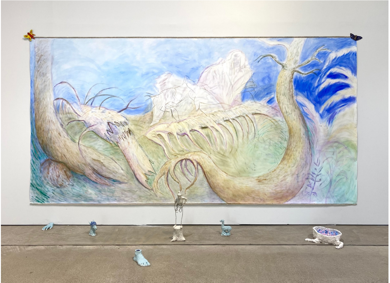
Metsänkehto -teoskokonaisuus ripustettuna Kuvan Keväällä 2022.