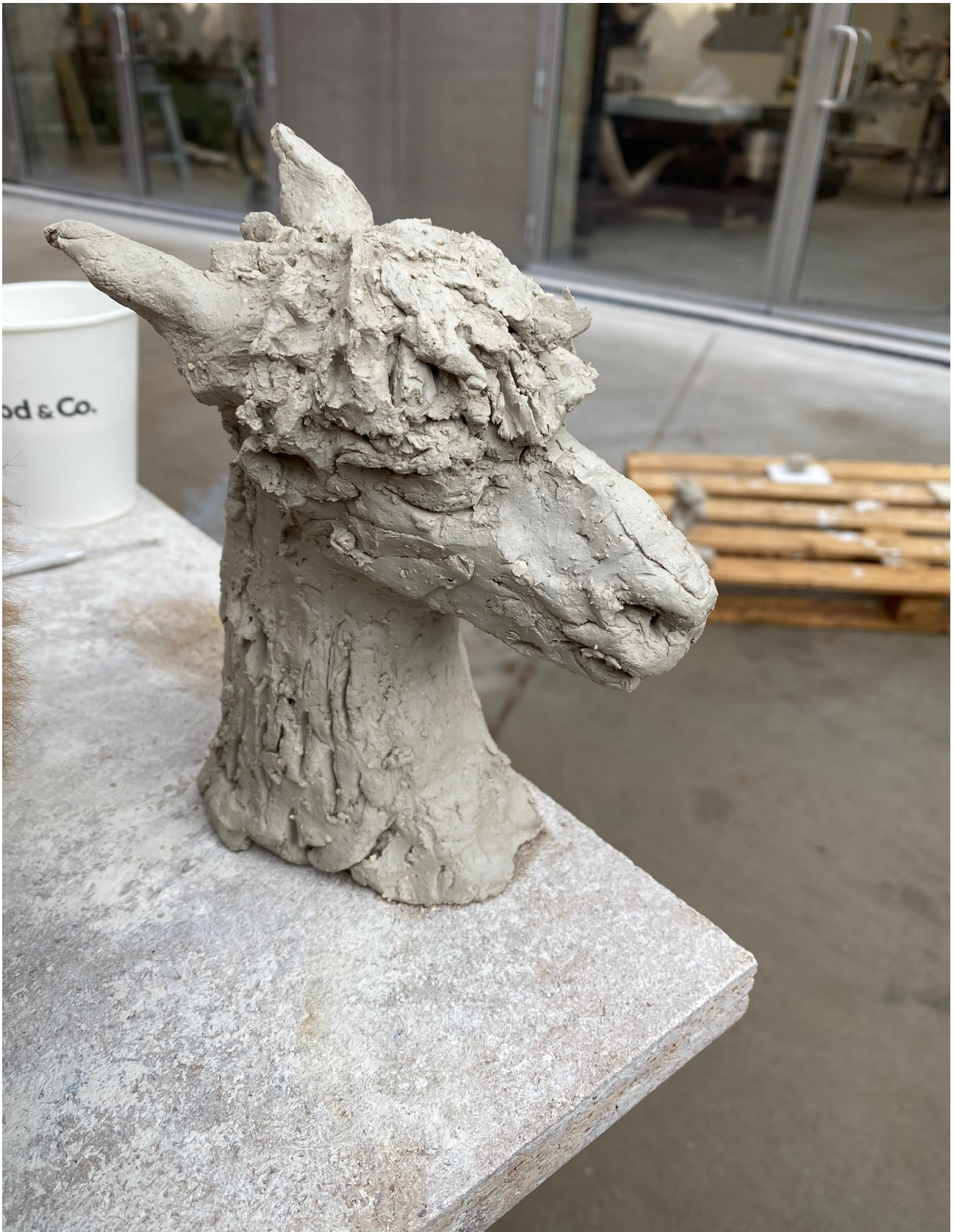
Alpakkamallit pihalla, pienten keramiikkaveistosten työstöä. Kuvataideakatemia takapiha, Figuratiivisen kuvanveiston kurssi, 2021.