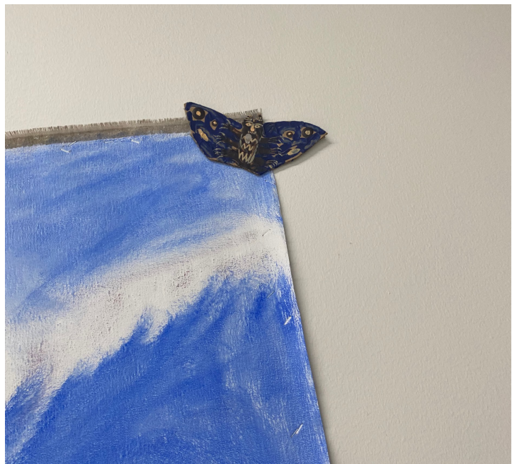
Perhonen I ja Perhonen II , akryylimaali pahville, lähikuvat teoskokonaisuudesta Metsänkehto . Valokuva: Venla Ekebom, Kuvan Kevät 2022.