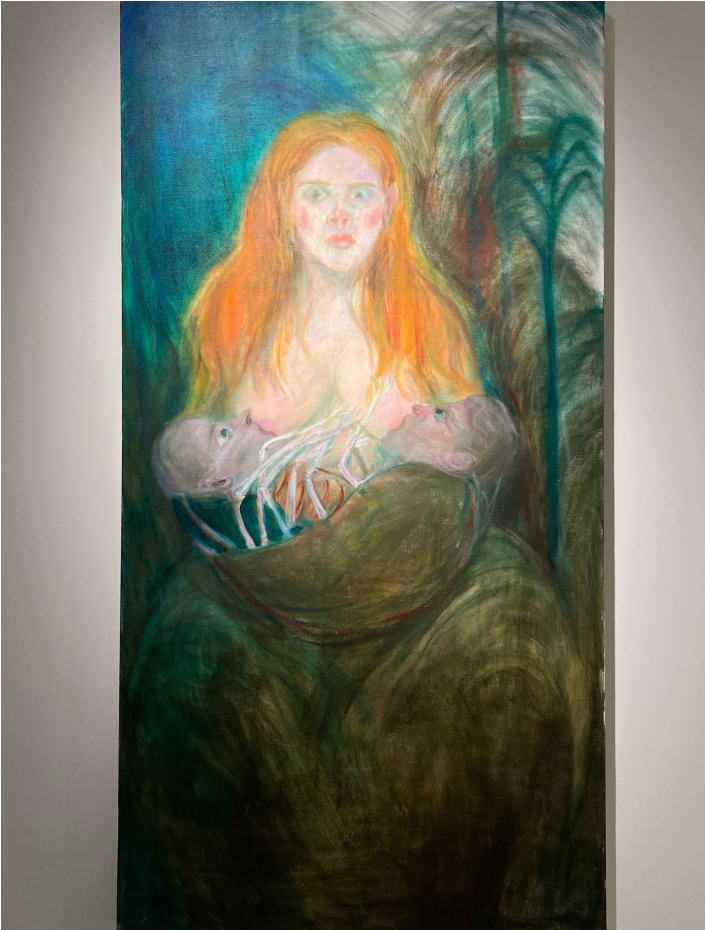
Emotional Vampires öljyvärimaalaus.