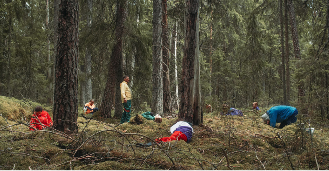
Kuva 19: Kela, Leena. 2022. If You Fall, We Will Fall Too .