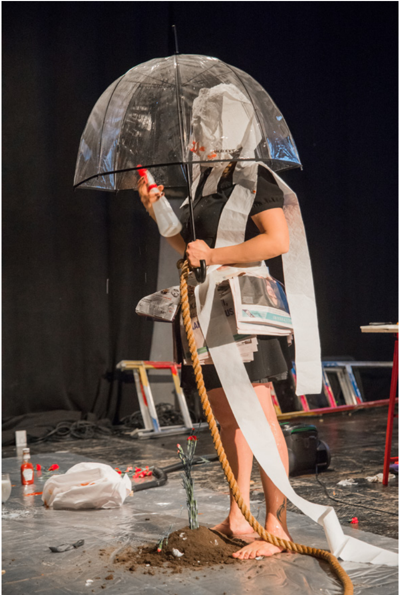
Kuva 6: Kela, Leena. 2016. Alphabet of Performance Art . Umbrella