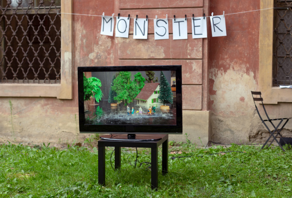
Kuva 2: Kela, Leena. 2021. Temptation of Destruction .

ohjaavat kohtauksia, ja lopulta ne yhdessä muodostavat sanan. Performanssi ei ainoastaan seuraa kirjainten scoreja, vaan performanssi kirjoittaa. Minä kirjoitan ja tutkin performanssilla. Performanssilla kirjoittaminen tarkoittaa, että performanssi toimii kirjoittamisen välineenä, työkaluna tai metodina. Kuten voi kirjoittaa kynällä tai tietokoneella, luomassani metodissa kirjoitetaan performanssilla. Performanssilla tutkiminen puolestaan viittaa tutkimukselliseen lähestymistapaan, jossa performanssi toimii sekä tutkimusmenetelmänä että ajattelun välineenä. 3