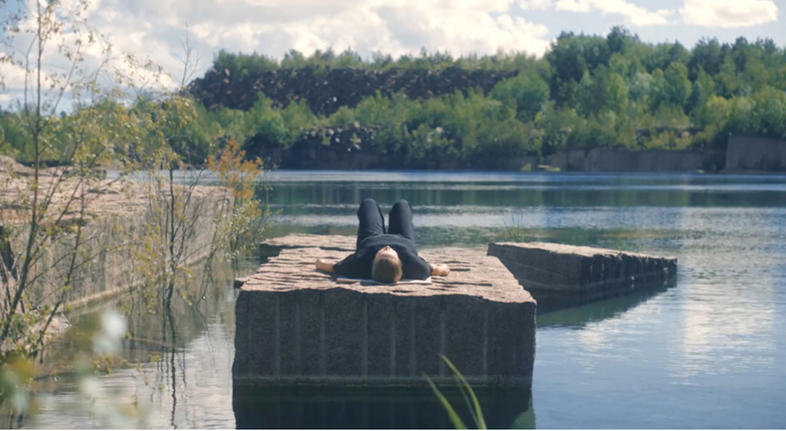
Kuva 17: Kela, Leena. 2021. Rest of Time .

on yhtä aikaa lumoava sekä kivuliaan historian kantaja, tuhottu maisema ja salainen nautinto. Päätin jo silloin, vuonna 2016, että teen paikassa jonkin performanssiteoksen, mutta meni vuosia, kunnes teosidea lopulta kristallisoitui.