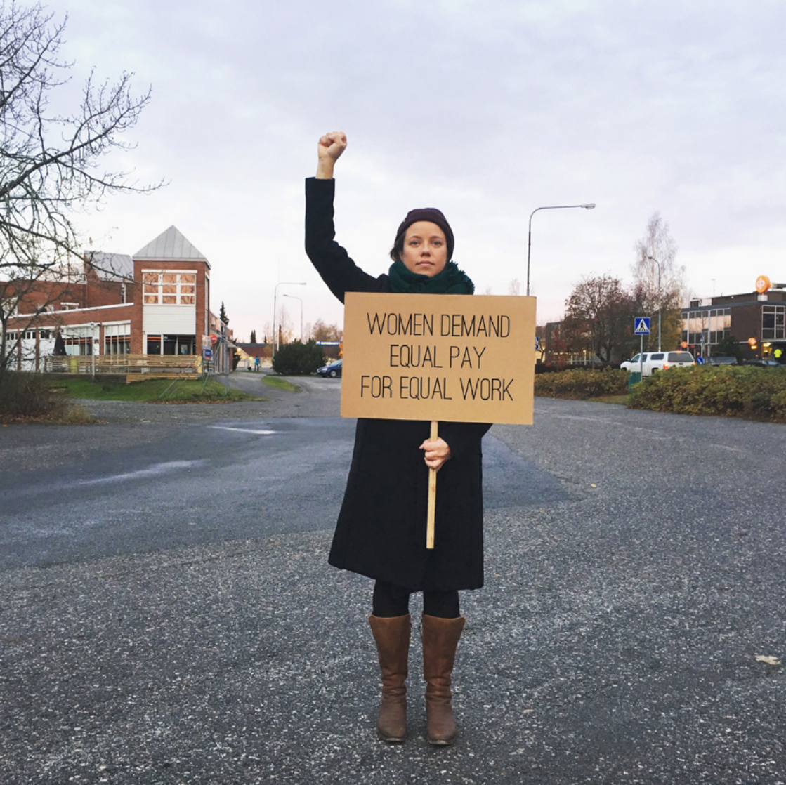
Kuva 12: Kela, Leena. 2017. One Year Demonstration . Women Demand Equal Pay for Equal Work.