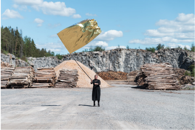
Kuva 16: Kela, Leena. 2020. There Is No Planet B .