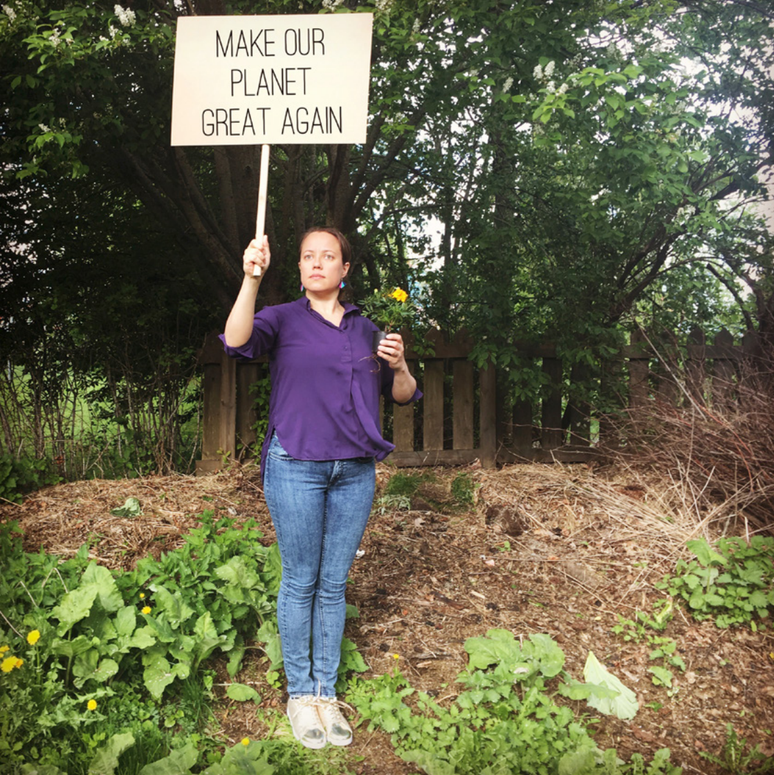
Kuva 9: Kela, Leena. 2017. One Year Demonstration . Make Our Planet Great Again.