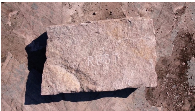
Kuva 18: Kela, Leena. 2021. Rest of Time . Kivi.

mölysammakon ja pikkusammakon risteymä. Suomessa ruokasammakoita tavataan erityisesti Turun seudulla, ja niiden on arvioitu päätyneen tänne joko laivaliikenteen mukana tai luontoon vapautettuina lemmikkeinä. 519 Kun käsikirjoitin teosta ja vierailin useaan otteeseen kaivoksella, huomasin sammakoiden kurnutuksen kaikuvaan uutena äänenä alueella. Se oli niin äänekkästä, ettei sitä voinut olla kuulematta, enkä ollut koskaan aiemmin havainnut sitä tässä paikassa. Kuvittelin, mitä tapahtuisi, jos kaivoslammesta tulisi ruokasammakoiden oma keidas, paikka, jossa niillä ei olisi luontaisia vihollisia. Villiintyessään tällainen paikka voisi alkaa muodostaa uudenlaisia lajiyhdistelmiä ja ekosysteemin, jotain, mitä emme vielä tunne.