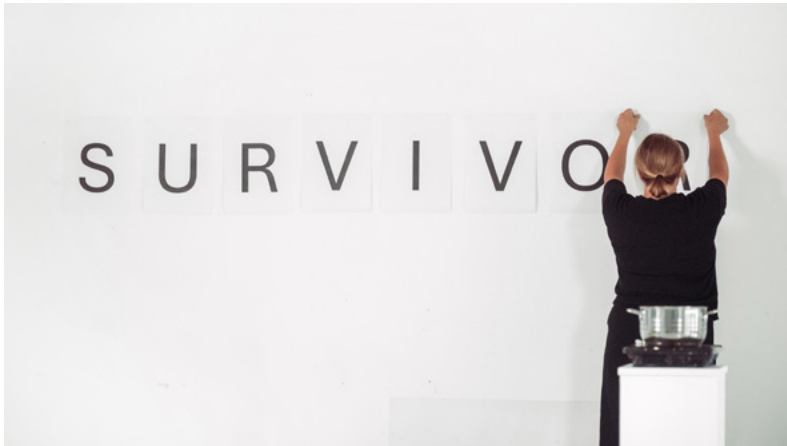
Kuva 22: Kela, Leena. 2025. End of Days .

R recognize (tunnustaa) Kysy tekoälyltä, mikä laji on paras selviytyjä ja miksi. Pyydä sitä tekemään laulu tästä lajista ja laita se soimaan. Kun laulu soi, pue karhukaispuku hitaasti päällesi. Poistu tilasta selviytyjänä.