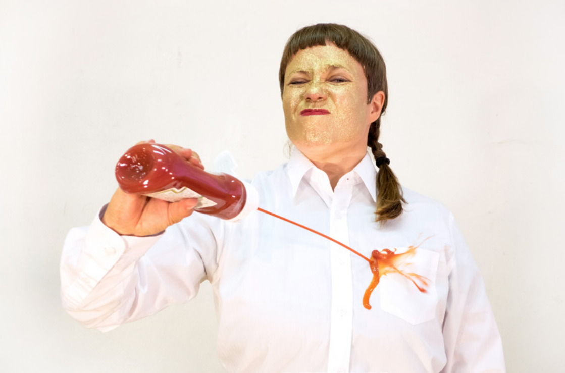
Kuva 5: Kela, Leena. 2016. Alphabet of Performance Art . Ketchup.