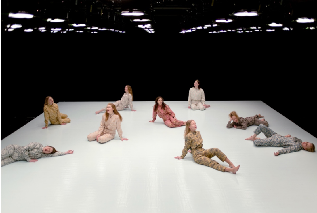
(Kosto I-IX)

syöksyy eteenpäin tasaisesti soiden ja ajoittain hajoillen, ruumiiden maatessa ja istuessa levollisesti koston minttuisella aavikolla. (Koskinen 2018)