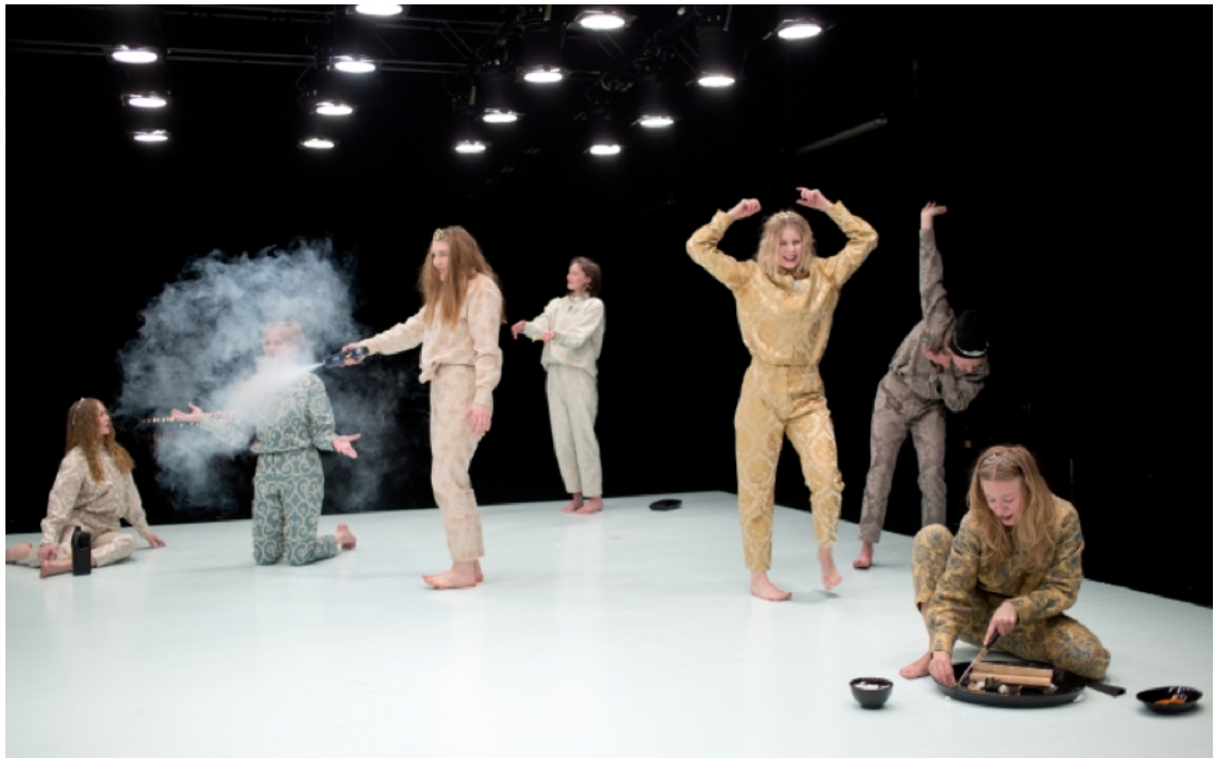
( Kosto I-IX)

Festivo-osio oli nautinnollinen osio teoksen kaarella, sillä se sisälsi suuren mutta rajatun esiintyjän vapauden alueen. Tämä oli myös se paikka, jossa monien muiden tunteiden lisäksi oli kohdattava omat pelot ja epävarmuudet. Samoin erilaisten ruumiin identiteettien esiin nouseminen osana jatkuvaa transformaatioita. Omalla kohdallani osio herätti paljon kysymyksiä, ristiriitoja sekä merkittäviä oivalluksia.