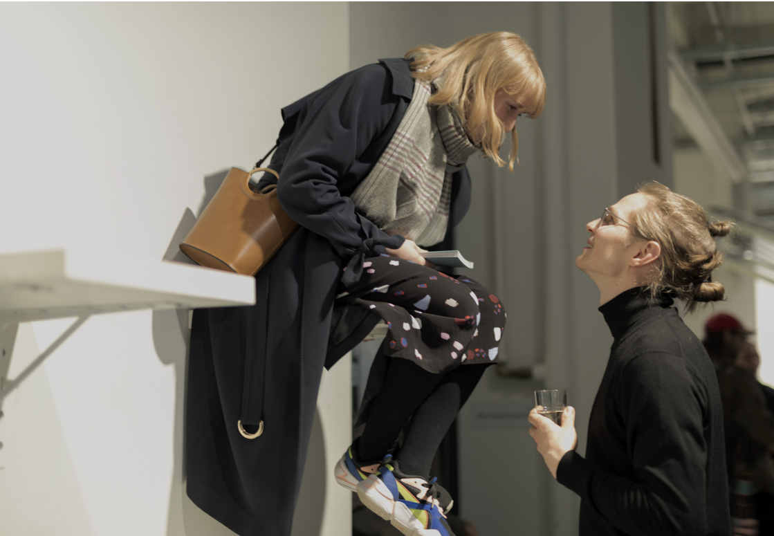
Ylempi kuva: Kuvan Kevät -seminaaripäivä 09.05.2019 ja taltioiden arvoiset sukat.