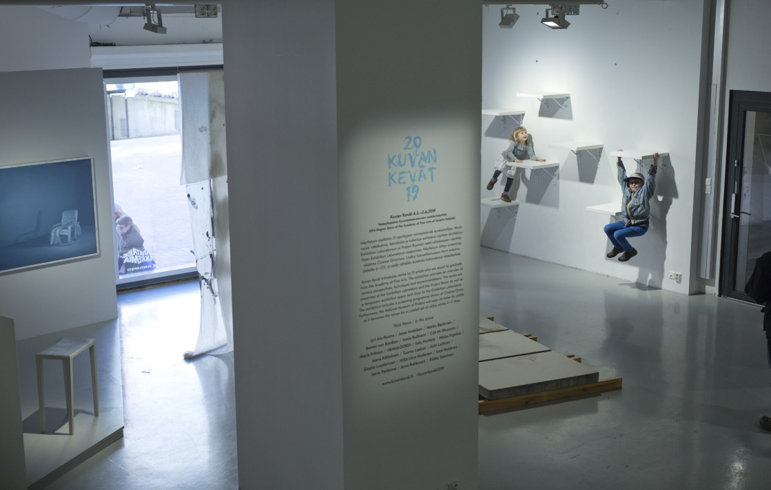
Teos oli monien lasten suosikki. Näyttelykävijöiden nuorempaa polvea roikkumassa ja kiipeilemässä Ihmishylly -teoksessa. Taustalla vasemmalla osia Marko Backmanin maalausinstallaatiosta. Kuvan Kevät , Exhibition Laboratory (Merimiehenkatu 36 C, sisäpiha), Helsinki, 2019.

Tämän kirjallisen opinnäytteen kuvat on ottanut tekijä itse paitsi, jos kuvan yhteydessä toisin mainitaan.