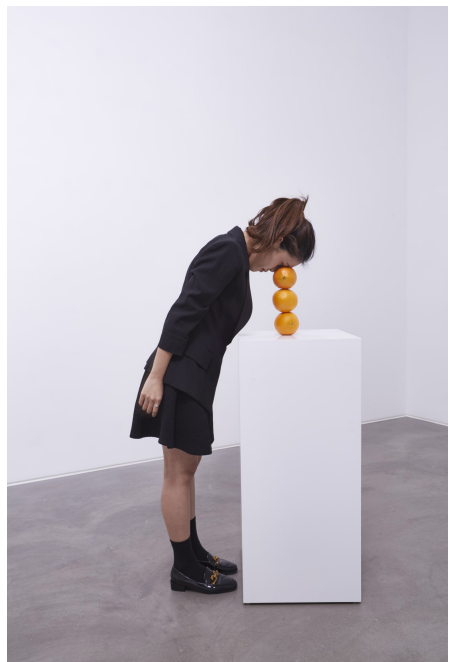
Erwin Wurm, Astronomical Purpose (2014/2019), One Minute Sculptures series, Stedelijk Museum & Lehmann Maupin, New York & Hong Kong