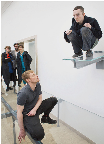
Anne Imhof, Faust (2017). Installaatio / performanssi. Venetsian biennaali 2017.

Jälkikäteen Faust -teoksen kuvia internetistä selattuani huomasin, että teokseen oli sisältynyt myös neliönmuotoisia, hieman eteenpäin kallistuvia lasisia hyllyjä, joiden päällä esiintyjät olivat olleet kyykyssä ja joita en ollut huomannut. Mielestäni kyseisissä hyllyissä on vahvaa yhtäläisyyttä teokseeni. Ainoan poikkeuksen muodostaa, että Ihmishyllyt sisältää monta hyllyä sisältävän sommitelmallisen kokonaisuuden, kun Faust -teoksessa hyllyt ovat olleet enemmän yksittäisiä.