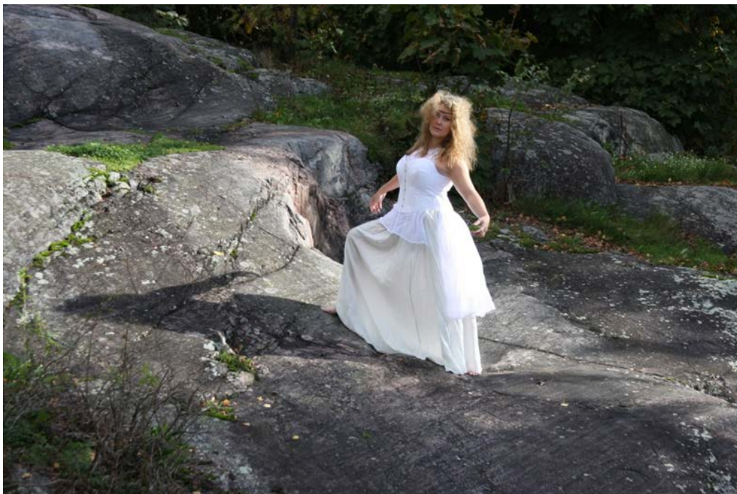
Voimauttava valokuva.

Tämän kurssin suhde kirjoittamaani kirjeeseen on näin jälkikäteen minulle ollut äärimmäisen selkeä. Koska olin kirjoittanut ylös omat tavoitteeni koulutuksen suhteen, pystyin sanallistamaan niitä tuntemuksia, mitkä olivat tavoitteitteni tiellä. Osasin myös nimetä kokemani tunteita ja näin ollen katsoa niitä ulkopuolelta. Koen, että on todella tärkeää, että tämä kurssi on opintojen alkupuolella. Ainakin minulle tämä oli voimakas alku omaan ammatti-identiteettiin tutustumiselle sekä sen vahvistumiselle.