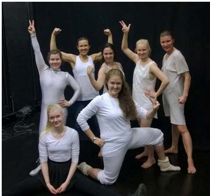
Soolotyöpajan sankarit.