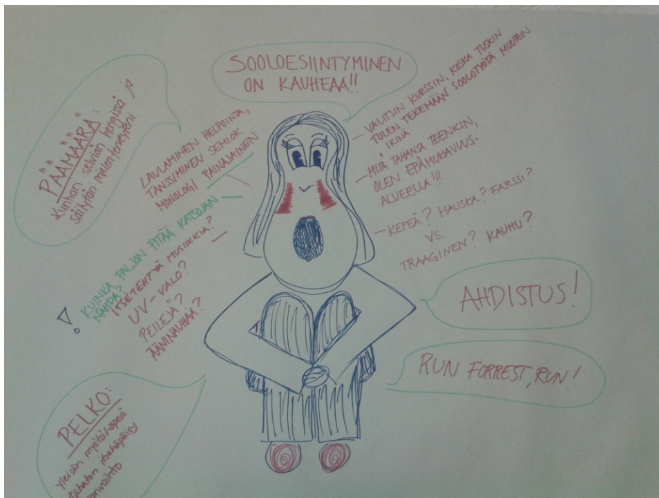
Oma piirustus soolotyöpajan aloituksessa 22.4.2014

Kurssin alku oli minulle todella jännittävä paikka. ”Mistä tämä epävarmuus kumpuaa? Kun odotan vuoroani puhua, en jännitä, mutta yhtäkkiä kesken puhumisen iskee paniikki ja alkaa itkettää. [--] Nyt tuntuu siltä, että minun on osattava olla itselleni armollinen. [--] Joten, nyt tässä soolotyöpajassa olen itselleni armollinen ja yritän vain parhaani. Täytyy muistaa, että epäonnistumiseen ei kuole, mutta siitä oppii paljon. Kyllä sinä osaat” (Päiväkirja 22.4.2014). Nämä tuntemukset olivat minulle lähes päivittäisiä.