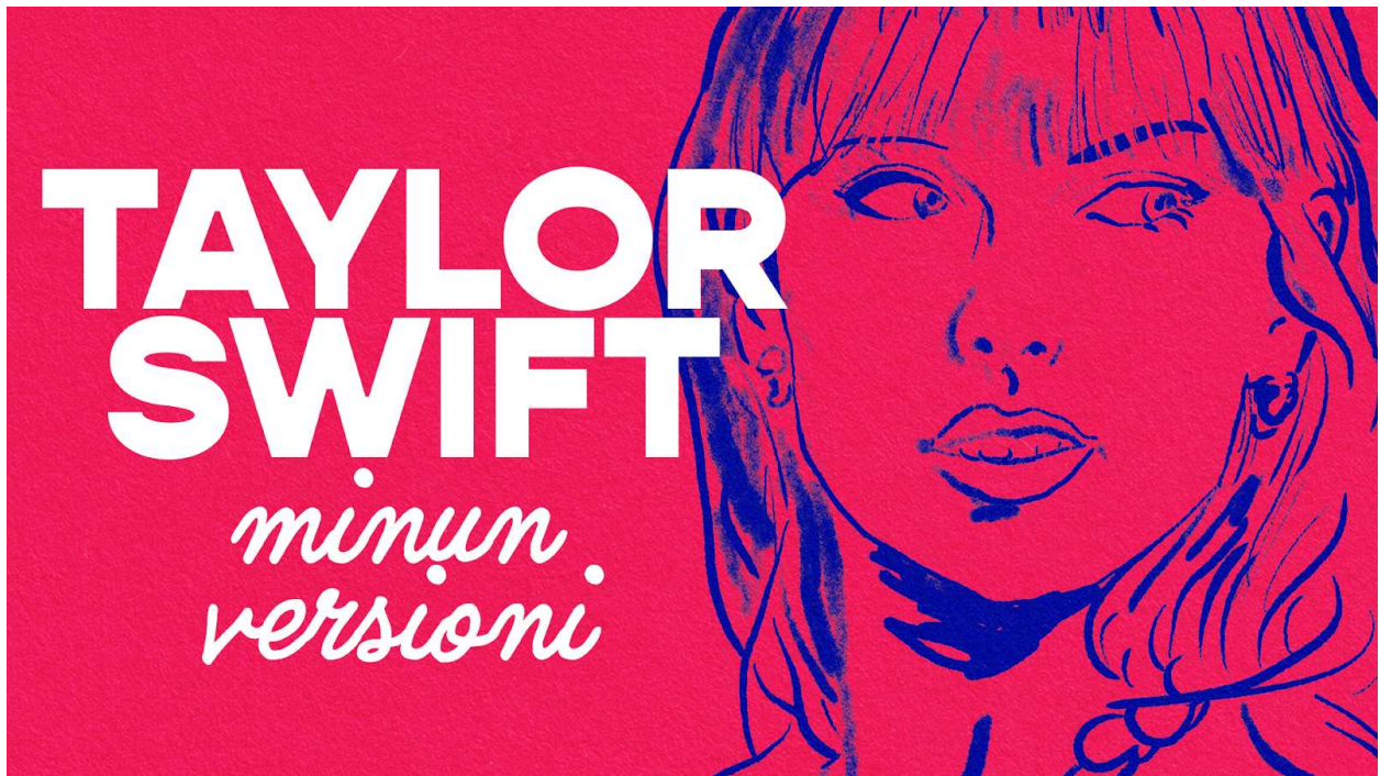
Taylor Swift, minun versioni -audiosarjan logo. 2024. Ili Marttinen, YLE.

Katkelma Taylor Swiftin kappaleesta Would've, Could've, Should've (2022).