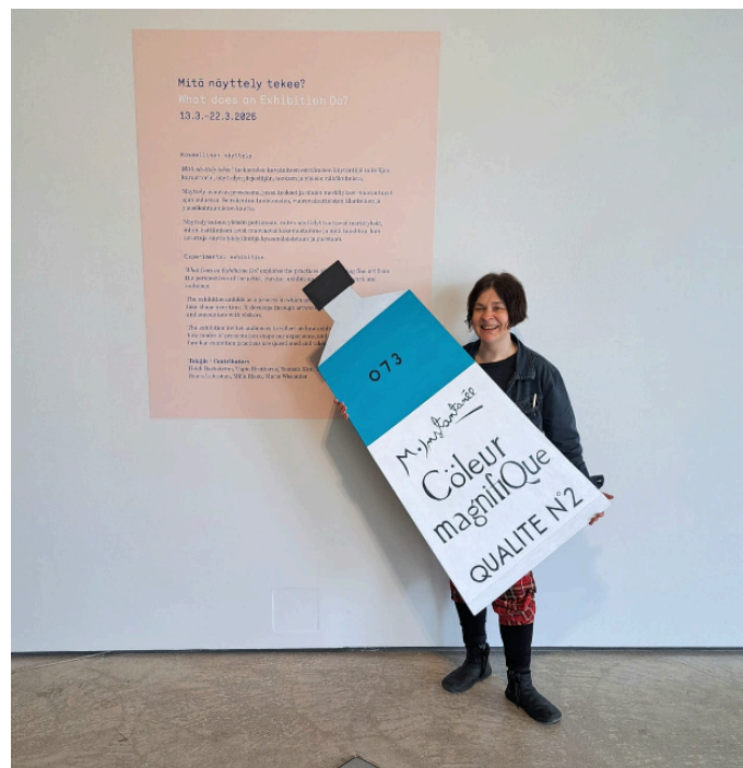
M. Instantanee ja litteä Cöleur magnifique -värituubi Kuvataideakatemian näyttelytilassa Mitä näyttely tekee? -näyttelyn esittelytekstin edessä.

Olen Cöleur magnifique- teosta toteuttaessani pohtinut sitä, mikä omasta näkökulmastani on taidepedagogisen tai taiteilijapedagogisen toiminnan ero. Tiiviisti kuvailtuna taidepedagogiikka on minulle sitä, että minä pedagogina mahdollistan taiteellisen toiminnan oppijoille oppimistilanteessa. Käytän sanaa oppimistilanne opetustilanteen sijaan, sillä en koe opettajana olevani muusta ryhmästä erillinen taho, vaan osa oppijaryhmää.