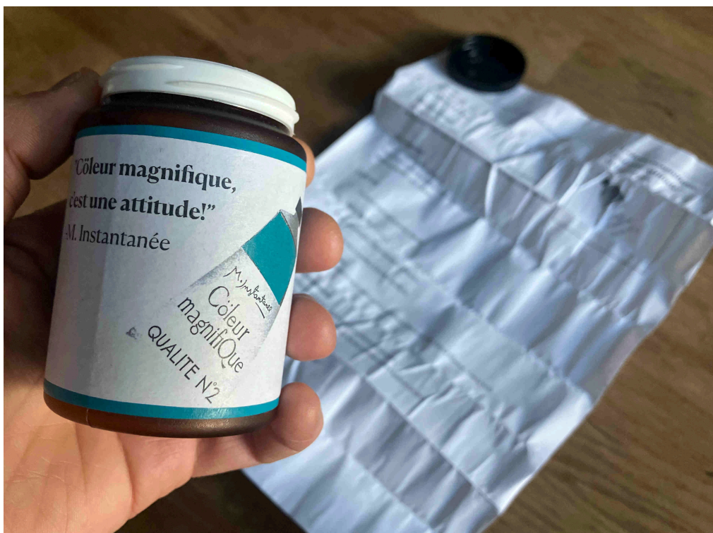
Cœur magnifique, c'est une attitude! -asennepurkki ja sen sisälle taiteltu ohjeistus.

Arpajaispalkinnoksi toteuttamani asennepurkki nojasi omiin käytäntöihini, mutta sittemmin totesin siinä olevan yhteneväisyyksiä Fluxus-taiteeseen. Fluxus oli löyhästi organisoitunut kansainvälisten taiteilijoiden ryhmä tai taideliike ilman kiinteää ohjelmaa tai yleisesti hyväksyttyä määritelmää. Edeltäjiensä dadaistien lailla myös Fluxus-taiteilijat kyseenalaistivat taiteen perinteitä ja ammattimaisuutta (Oxford reference, 2026). Aktiivisimmillaan Fluxus oli 1960-luvun alkuvuosista 1970-luvun loppupuolelle. Sen toiminnan ydinideana oli sekoittaa elämä ja taide ja se voidaan tulkita ennemminkin tekemisen asenteeksi, kuin visuaalisesti, sisällöllisesti tai merkityksellisesti kuvailtavissa olevaksi tyyliisuunaksi (Higgins, 2002, XIII). Fluxus-taiteilijat järjestivät mm. yleisöä osallistavia konsertteja, esityksiä ja ”happeningeja” (tapahtumia) sekä ohjeita taiteelliseen toimimiseen. Esimerkkinä tällaisesta mainittakoon Fluxus-taiteilijoiden Yoko Onon (s. 1933) ja George Maciunaksen (1931–1978) sekatekniikalla toteuttama teos nimeltä ”Mechanical for Do It Yourself Fluxfest Presents” (Yoko Ono & Dance Co. 1966). Teos sisältää ohjeita, kuten: ”Etsi apila. Lähetä meille mitat ja