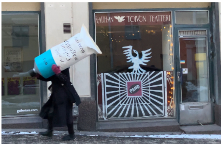
Kuvakaappaus videolta. Tuubin kantamista Kalliossa 26.2.2026.