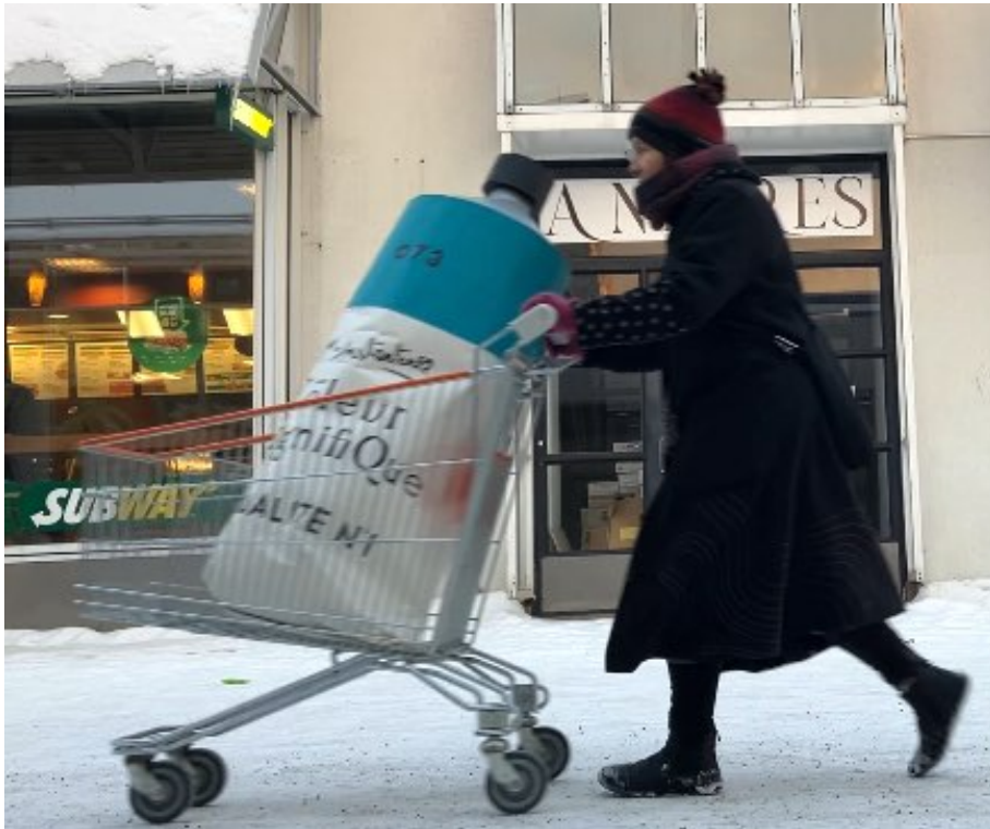
Kuvakaappaus videolta. Tuubin kuljettamista ostoskärryillä Kontulassa 26.2.2026.

Esittelen opinnäytetutkielmani aluksi työskentelyn taustat, tutkimuskysymykset, teoreettisen viitekehyksen ja tutkimusmetodini. Tämän jälkeen avaan teosprosessia, joka koostuu taiteellisen praktiikkani esittelemisestä sekä taiteellisen opinnäytetyöni taustoittamisesta ja käytännön toteuttamisesta. Lisäksi reflektoin taiteellista osaa ja liitän teoskokonaisuuden laajempaan keskusteluun. Työn viimeinen osa sisältää pohdintoja työskentelyn aikana saamistani oivalluksista ja mahdollisista jatkotutkimusaiheista.