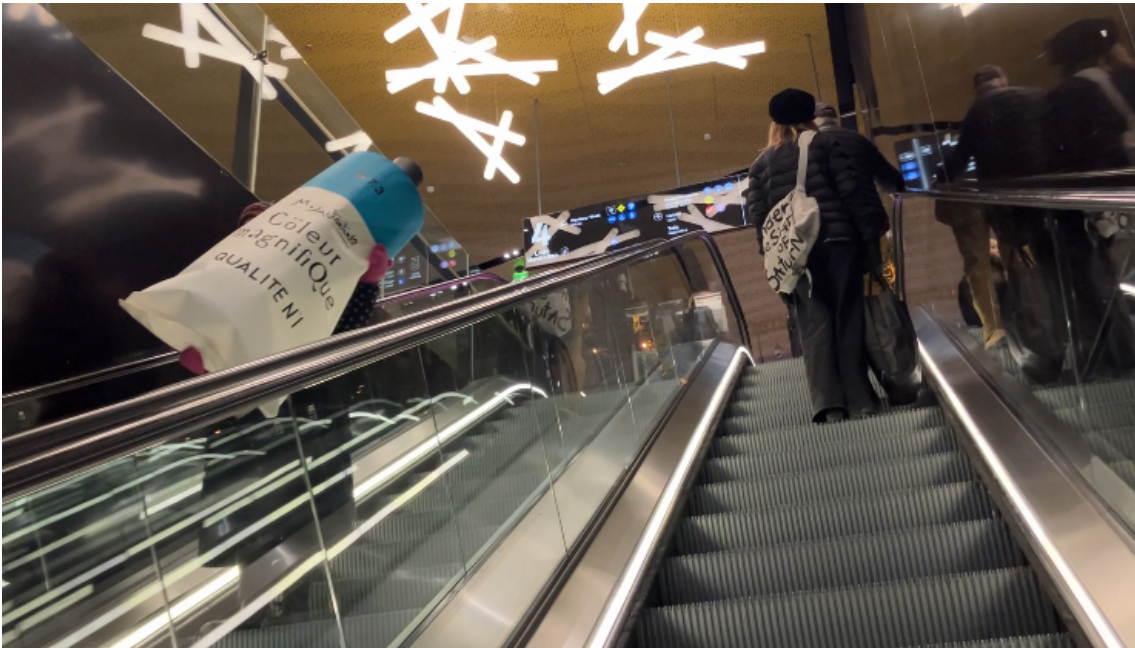
Kuvakaappaus videolta. Tuubin kuljettamista rullaportaissa Pasilassa 23.2.2026.

Jos minulla olisi ollut enemmän resursseja, olisin halunnut toteuttaa suuremman, jopa useita metrejä pitkän värituubin. Mukanani olisi kulkenut tutkimusavustajia, jotka olisivat haastatelleet vastaantuloja ja huolehtineet tutkimusluvista. Tähän ei kuitenkaan ollut mahdollisuutta. Päädyin siis toteuttamaan teoksen, jonka pystyin suunnittelemaan ja toteuttamaan omaehtoisesti.