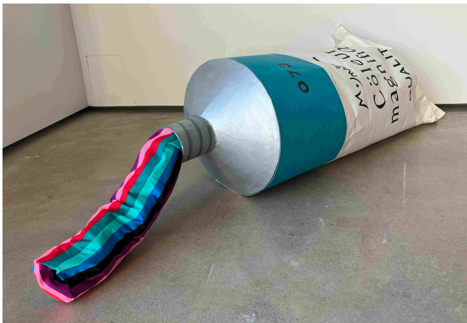
Yhdessä Eurokankaan työntekijän kanssa valitsemani monivärinen kangas.

Prosessin myötä minua on alkanut enenevässä määrin kiinnostaa sattuman mahdollisuus taidepedagogiikassa. Voisinko kenties hyödyntää enemmän sattumaa esimerkiksi sommittelussa ja liikekielellisissä harjoitteissa työskennellessäni lasten kanssa? Näin osallistujia voisi osaltaan vapauttaa ei osaamisen -ajatuksesta.