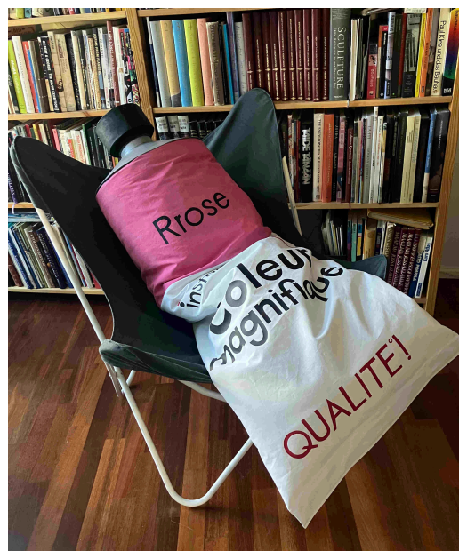
Rose-sävyinen Cöleur magnifique -tuubi rentoutuu lepakkotuolissa

Lopuksi kysyn: oliko teoskokonaisuus nimeltä Cöleur magnifique kaikkine siihen liittyvine aspekteineen onnistunut? Taidetta ja sen onnistumista on haastavaa ja usein turhaakin mitata. Koen taideteoksen kuitenkin onnistuneen, ainakin henkilökohtaisella tasolla. Seuraava lainaus kuvaa kokemustani hyvin: ”Taideteoksen onnistuessa siinä vaikuttavat voimat löytävät vastavaikutuksia taidetta laajemmista elämän yhteyksistä. Näin taiteellisen toimijan näkemisen tavassa voi tapahtua muutos: touhuaminen muuttuu tarkasteluksi, oma aktiivisuus pikemminkin aktiivisuuden vastaanottamiseksi, ja tulemme kiinnostuneiksi asioista omaa käyttöömmme laajemmalla tavalla” (Tuovinen, 2014. s. 48). Minua viehättää erityisesti sanavalinta touhuaminen . Olen aina ollut kova nimenomaan touhuamaan, siis tekemään! Arpajaisia! Naamioita! Taiteellisia ulostuloja ovista ja ikkunoista! Olen touhunnut innostuneesti ja hyvä niin, sillä se on ominta itseäni, mutta tarkastelu on jäänyt vähemmälle. Tämän prosessin myötä taiteellinen toimija on innostumisen lisäksi havahtunut myös tarkastelemaan, mikä on tuonut myös touhuamiselle uusia nyansseja. Koen, että puuhastelemalla, siis toteuttamalla taiteilijapedagogisen teoksen, olen löytänyt uusia näkökulmia taidepedagogiikkaan ja monitaiteinen asenteeni on muuttunut entistäkin monitaiteisemmaksi.