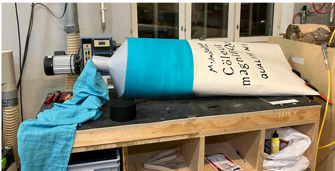
Tuubi tekeillä Teatterikorkeakoulun verstaalla joulukuussa 2025.

Värituubi pyrkii jäljittelemään markkinoilla olevia tehdasvalmisteisia värituubeja, mutta sen ulkoasu on itse suunnittelemani ja siten fiktiivinen. Tuubissa lukee: M. Instantané Cöleur magnifique QUALITE °1. Valitsin etiketin kieleksi ranskan, onhan Ranska eurooppalaisen kuvataideopetuksen edelläkävijämaa; Pariisissa sijaitsevan École des Beaux-Arts-taidekoulun juuret ulottuvat aina 1640-luvulle asti (Lehtoruusu, 2025).