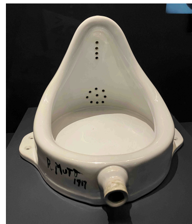
Marcel Duchampin Suihkukaivo-veistos