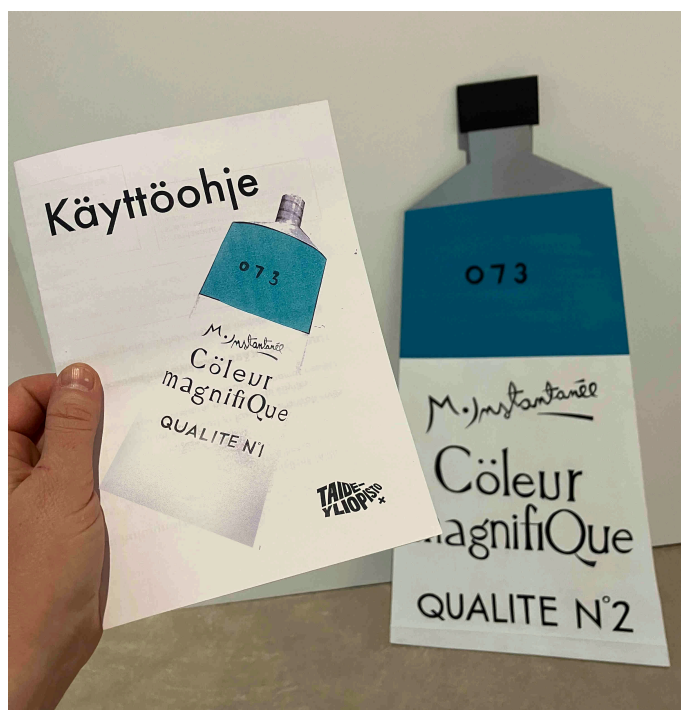
Näyttelyä varten toteuttamani litteä Cöleur magnifique -tuubi ja käyttöohje.

Kaiken kaikkiaan Mitä näyttely tekee? -kokonaisuudesta teki kiinnostavan se, että olin ensin vienyt epätyypillisen esineen ja vieläpä taiteeksi määrittelemäni esineen julkiseen kaupunkitilaan ja sitten tuonut sen taiteen esittelemistä ja esittämistä varten rakennettuun tilaan. Sekä urbaani ulkotila että näyttelytila edustivat molemmat julkisia tiloja, mutta niiden käytännöt tarkastella esineitä ovat hyvin erilaiset.