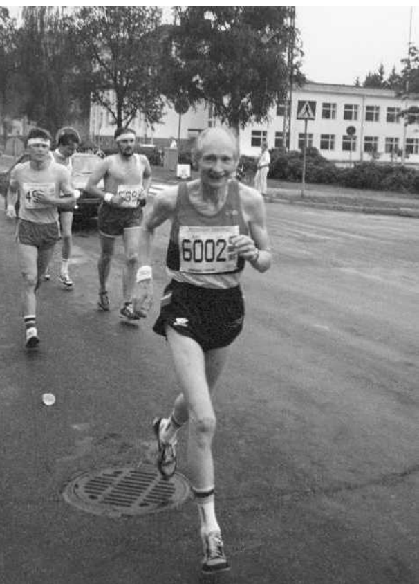
Alkumatkassa, vielä hymyssä suin Helsinki City Marathonilla vuonna 1985.

matkamittarilla uskon saaneeni myös varsin tarkat lukemat.