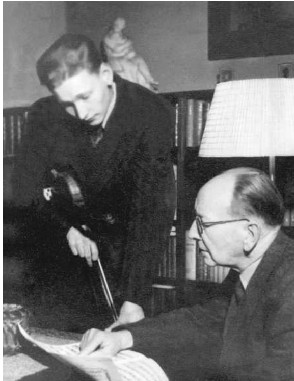
Isän kanssa nuorten arvoitusten äärellä 1949.

Sodan jälkeisen Suomen poliittinen ilmapiiri muuttui radikaalisti, ja yksi julkisyhteisö, jossa vaikutus selvästi näkyi, oli Yleisradio, eikä vähiten uuden pääjohtajansa Hella Wuolijoen ansiosta. Hänen suhtautumisensa Radio-orkesteriin ja klassiseen musiikkiin oli sinänsä kiitettävän positiivinen. Vuosina 1945–1947 orkesteriin perustettiin Wuolijoen myötävaikutuksella toistakymmentä uutta soittajan vakanssia, ja uusi pääjohtaja piti kansan sivistämistä klassisella musiikilla todella tärkeänä. Orkesteri alkoi myös pitää julkisia, niin