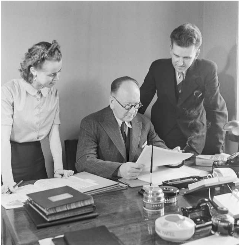
Radion musiikki- päällikkö toimis- tohenkilökuntansa kanssa 1939.