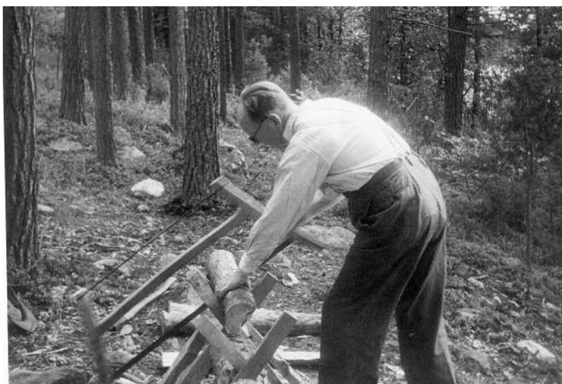
Isä nauttii maalaiselämästä Kaikupohjassa 1940-luvun loppupuolella.