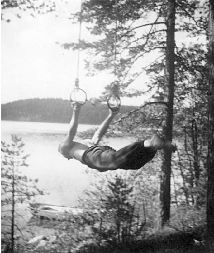
Takavaaka Kaikupohjan saunalla.

metristä oikein kauniisti, sainkin heti kimppuuni yhden valmentajan, joka houkutteli minua mukaan valmennukseen. Olisin mielelläni mennytkin, mutta juuri niihin aikoihin sain yhtäkkiä jotain outoja sydämen rytmihäiriitä. Uimahyppykoulutus sai jäädä, koska – ajan tavan mukaan – lääkäri kielsi harrastamasta minkäänlaista liikuntaa! Piti jättäytyä pois koulun liikuntatunneiltakin ja kulkea koulumatkat raitiovaunulla.