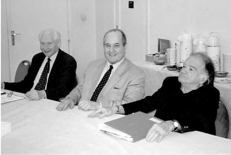
Brysselin Kuningatar Elisabet -kilpailun tuomaristoa kahvitaulla vuonna 2001. Seurassani Igor Oistrah ja Ruggiero Ricci.

Keskustelu kilpailusuorituksista johtaa helposti tuhoon. Olin muutamia kertoja Pariisin kamarimusiikkikilpailun lautakunnassa, ja siellä koettiin kerran tästä malliesimerkki. Kilpailu oli lopussa, ja lautakunta oli antanut pisteensä, joiden perusteella voittaja oli italialainen kamarimusiikkipari ja toiseksi tuli ranskalainen duo. Sitten avattiin keskustelu. Ensimmäisenä nousi yllä ranskalainen tuomariston jäsen, joka pitkässä puheenvuorossaan alkoi ylistää ranskalaista duoa ja seikkaperäisesti selostaa sen paremmuutta italialaiseen nähden. Tämän voimakkaan manipulaation jälkeen koko pistelasku suoritettiin uudestaan ja lopputulos muuttui!