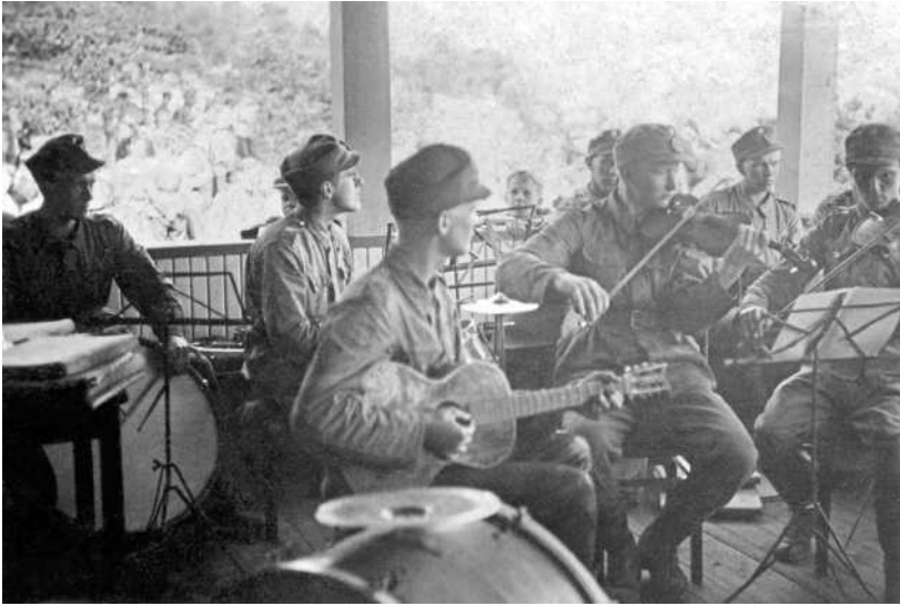
Karhulan alokasorkesteri soittamassa ohjelmistoaan.