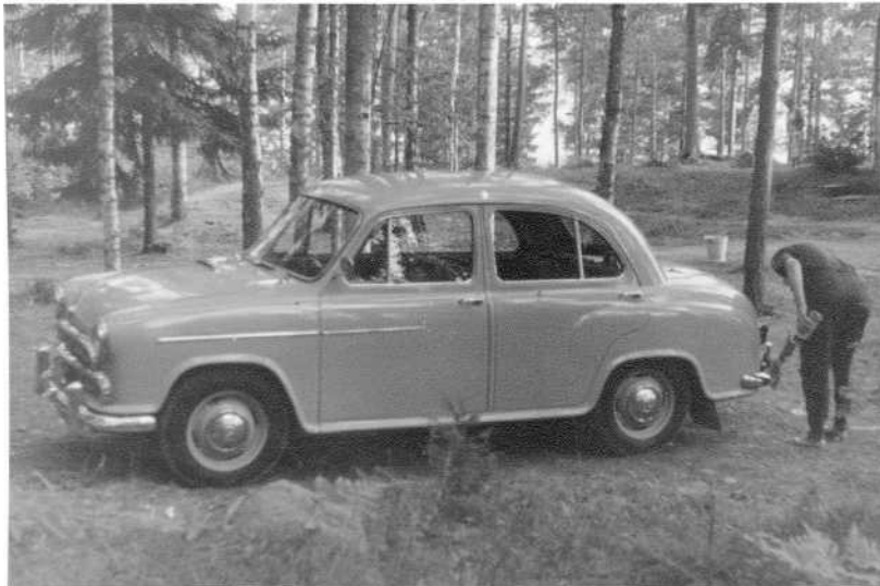
Ensimmäinen autoni pesussa Kai-kupohjan pihassa.

Lempieurheilua minulle niin tekijänä kuin kokijana on läpi elämäni ollut yleisurheilu. Helsingin olympialaisiin 1952 halusin ilman muuta mennä sitä katsomaan. Paikkani oli Olympiastadionin kaarteessa, maaliviivan lähellä ja paikan päällä näin kaikki kisojen yleisurheilun loppukilpailut. Emil Zátopek oli omassa suvereenissa ylivoimaisuudessaan kisojen varsinainen kruunu, voittaen kultaa