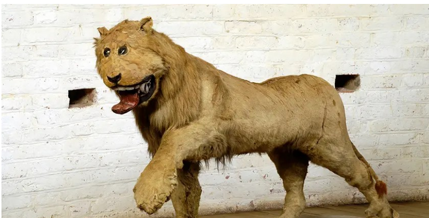
(Kungligaslotten. Lejonet Leo.)

Här har vi Leo som står på Gripsholms slott i Sverige.