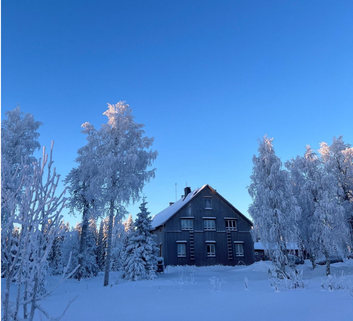
Kuva 1: Mustarindan residenssitilo Paljakanvaaran laella

Olen tutustunut ekologisen jälleenrakennuksen käsitteeseen Mustarindan residenssitilossa Kainuussa. Päädyin ensi kerran luonnontilaisen metsän ympäröimälle vanhalle kyläkoululle Teatterikorkeakoulun tarjoaman residenssin myötä ja nyt, pari vuotta myöhemmin, olen seuran jäsen. Ekologinen jälleenrakennus on Mustarindan keskeisin periaate, ja nykyisin työskentelen siellä kuukauden pätkissä residenssitalonmiehenä kolaten lunta, tyhjentäen paskahuussia, huoltaen vesifiltteriä,