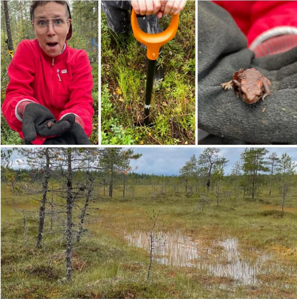
Kuva 13: Lajienvälisiä kohtaamisia Suo anteeksi -tapahtumassa.

kontekstissa? Miksi pienten keskustelevien, aisteja aktivoivien ja rituaalisten tehtävien lisääminen ennallistamisen joukkoon teki siitä niin syvän kokemuksen?