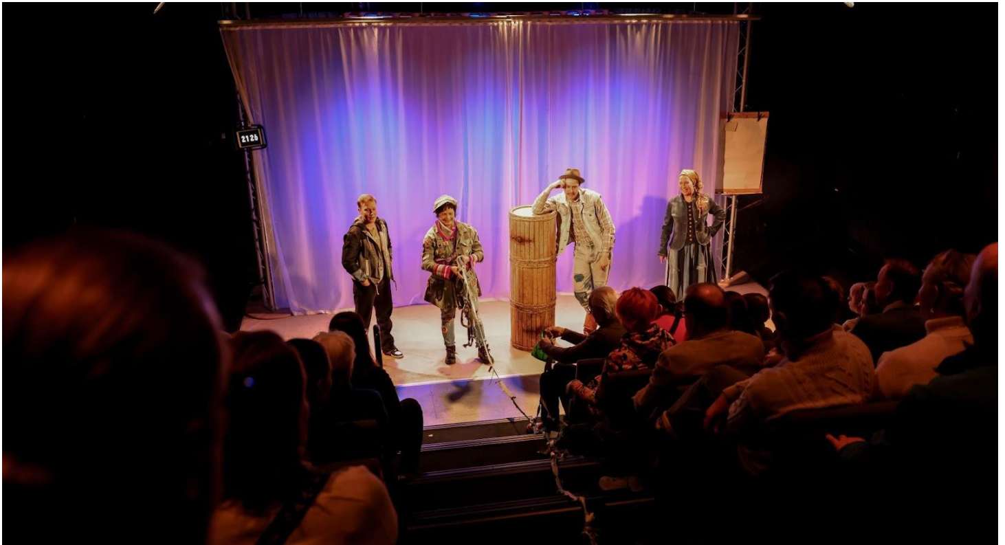
Kuva 10: Tervan tie : toimintatauko!

Tässä luvussa käsittelen taiteellista maisterin lopputyötäni, Tervan tie – onko meillä suunnitelma? -esitystä, yrityksenä jalkauttaa teatterikatsojia konkreettiseen yhteiskunnalliseen toimintaan teatteriesityksen kehyksessä. Käyn läpi lopputuloksen ja valmistusprosessin.