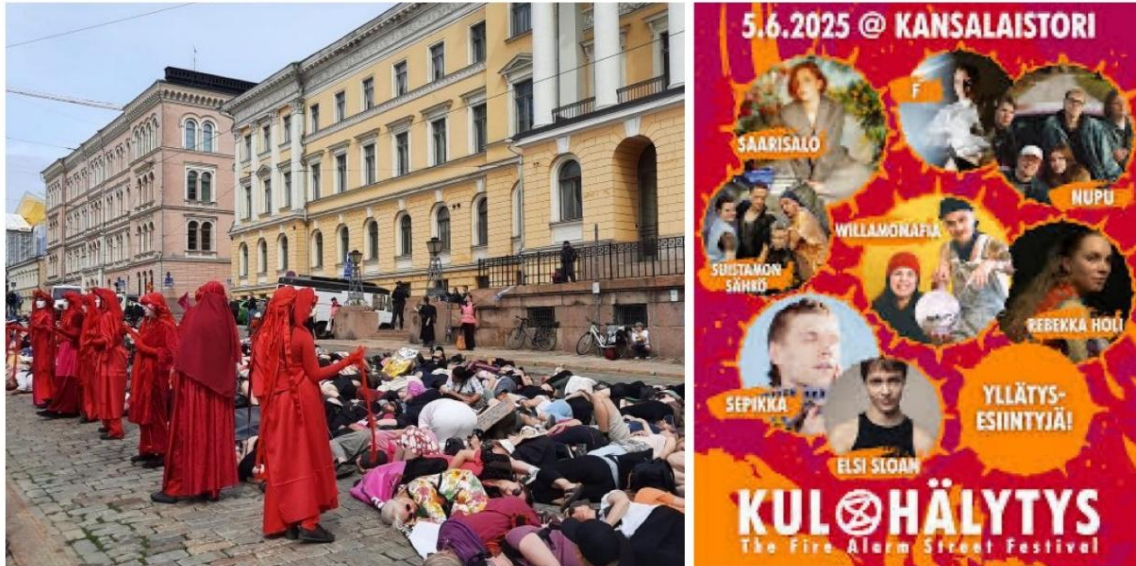
Kuva 4: Vas. Elokapinan Veriprikaati ja die-in. Oik. Kulohälytys -festarin juliste.