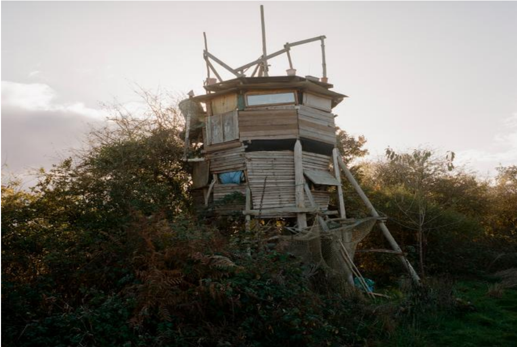
Kuva 15: Komentokeskuksen paikalle rakennettu majakka.

komentotornin paikalle vittuilumielessä rakennettu majakka, leipomo, pakolaiskeskus, panimo, traktorikorjaamo, räppistudio, hedelmäpuutarha ja sepän paja.