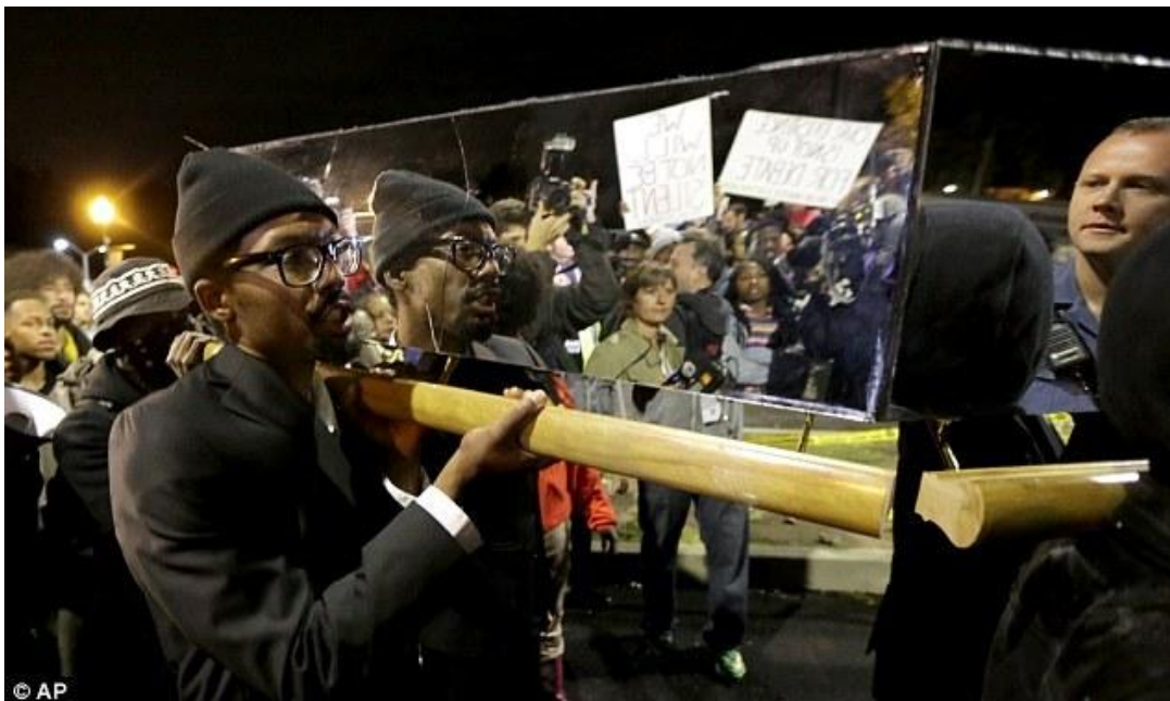
Kuva 3: Peiliarkku mielenilmauksessa.

Artivismi eli taideaktivismi on tapahtumasuunnittelija ja aktivisti De Nicholsin mukaan taidetta, joka ei tähtää museoihin tai pääsylippuihin. Käsikirjassaan Art of Protest – what a revolution looks like? De Nichols muotoilee: ”sijoittuipa protestitaide marssille,