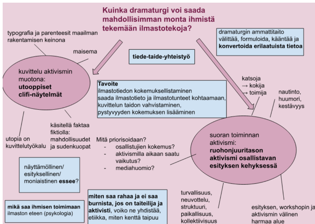
Kuva 5: Huuruinen kaavioni dramaturgian ja aktivismin yhteenkietomisestä kirjallisen opinnäyteprojektin alussa.

toisiinsa. (Ja tunnistaa myös hetket, joina ei kannata kysyä, ja hörpätä sen sijaan pitkä hörppy kahvikupista.) Dramaturgin työ tapahtuu yleensä esittävien taiteiden ja/tai kaunokirjallisen tekstin kontekstissa, mutta se voi tapahtua myös muualla. Työ voi olla yksin tehtävää, kuten romaanin dramatisointi näytelmäksi, tai tiiviisti yhteisön osana tapahtuvaa, kuten prosessimuotoisen esityksen dramaturgina toimiminen. Se voi pelata sanoilla, kuten muiden kirjoittajien näytelmien lukeminen ja palautteenanto, tai viisveisata niistä, kuten tanssidramaturgina toimiminen.