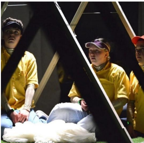
Kuva 8: Haavekuva , dystopia, maisema on kova.

Portfoliossani jäsenänkin, että mahdottomissa parenteseissani ei ole kyse ”kikkailusta”, vaan työryhmälle ja katsojalle osoitetusta pyynnöstä pysähtyä ja kutsusta kuvitella. Kirjoitan: ”Teksti, jonka näyttämöllinen ratkaiseminen vaatii alas istumista, yhdessä keskustelua ja kokeilemistä, on vastarintaa jatkuvan tuottamisen vaateeseen. Lisäksi en usko, että utopiaa on mahdollista luoda yksin. Kurotan kohti työryhmää, kutsun heidät maisemaan ja sanon: olkaa kuin kotonanne, en malta nähdä mitä kuvittelette!” (2023, 21.)