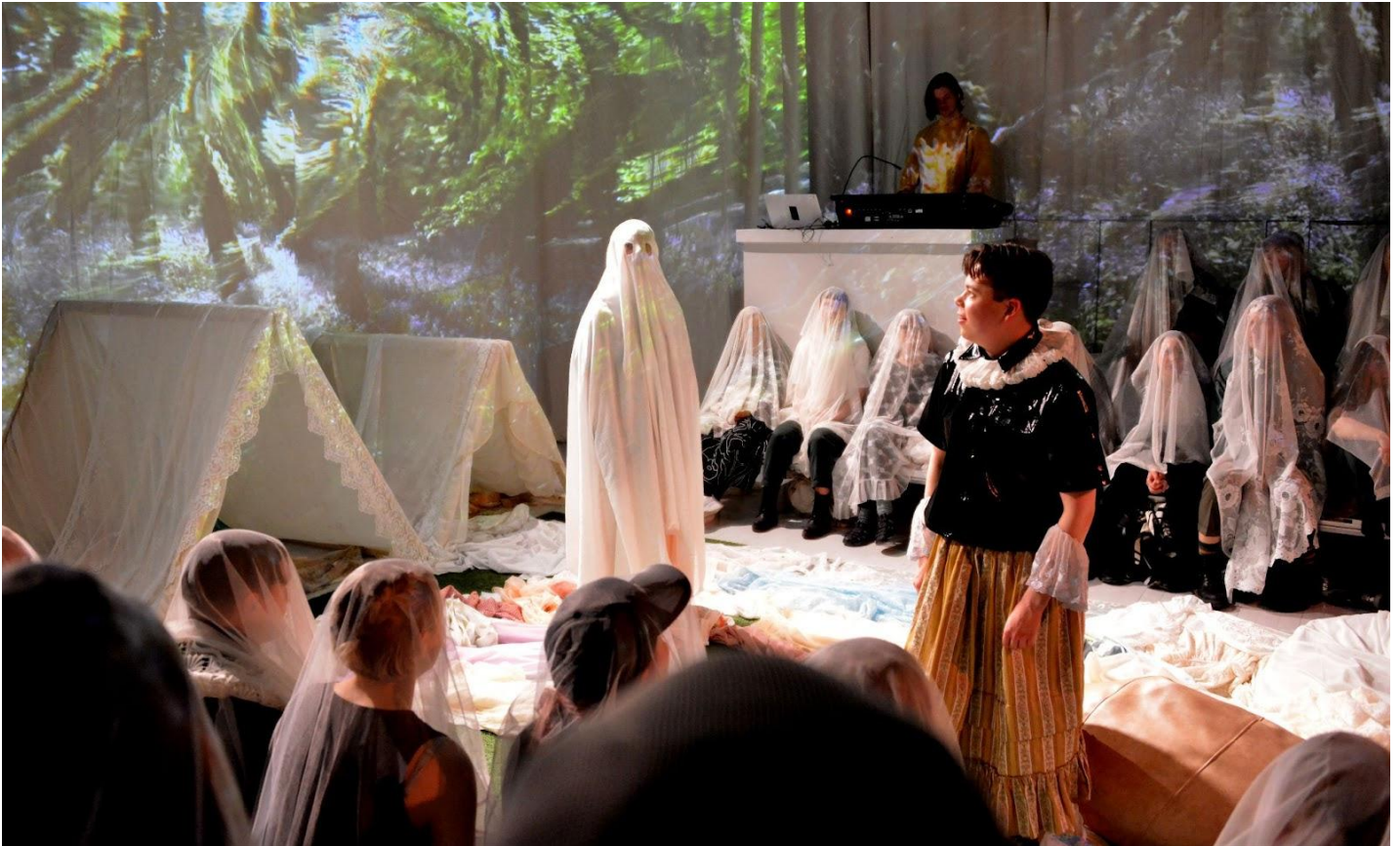
Kuva 6: Haavekuvan ensimmäinen puolisko, eli utooppinen osio.

Tässä osiossa esittelen kandidaatin lopputyöksi kirjoittamani näytelmän Haavekuva sekä kandidatifolioni Parenteesit utopian rakentamisen keinona keskeisimmät havainnot. Sen jälkeen pohdin kuvittelun mahdollista muutosvoimaa yleisemmällä tasolla.