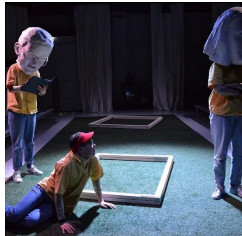
Kuva 9: Haavekuva , dystopia, aikuiset.