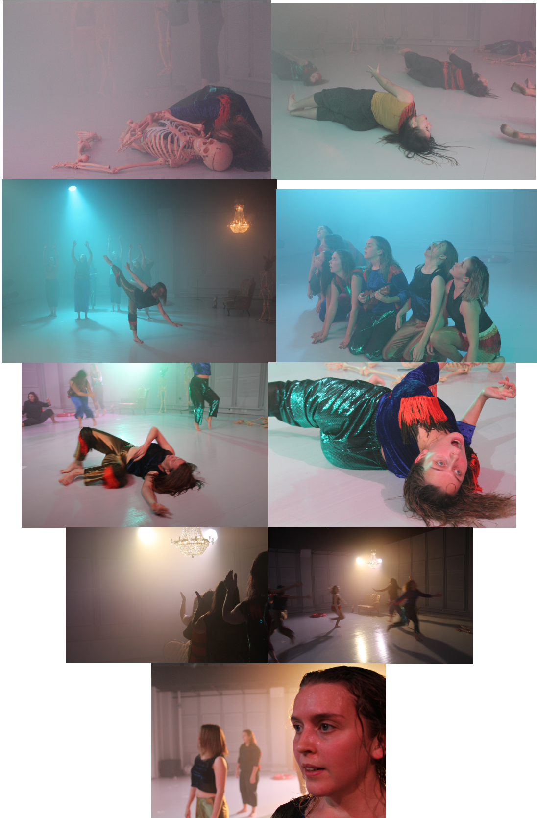
ALL I HAVE LEARNED 19.10.2016