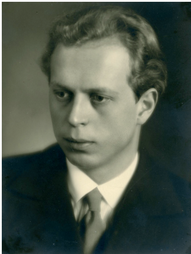
Kuva 7. Vakavaimainen nuorimies kuvattuna juuri ennen lähtöä Pariisiin.

tikin usein riittävän unen, ravitsevan ruoan ja tarpeeksi lämpimän vaatetuksen tärkeydestä. Olisiko parempaa äidinkorviketta voinut toivoa!