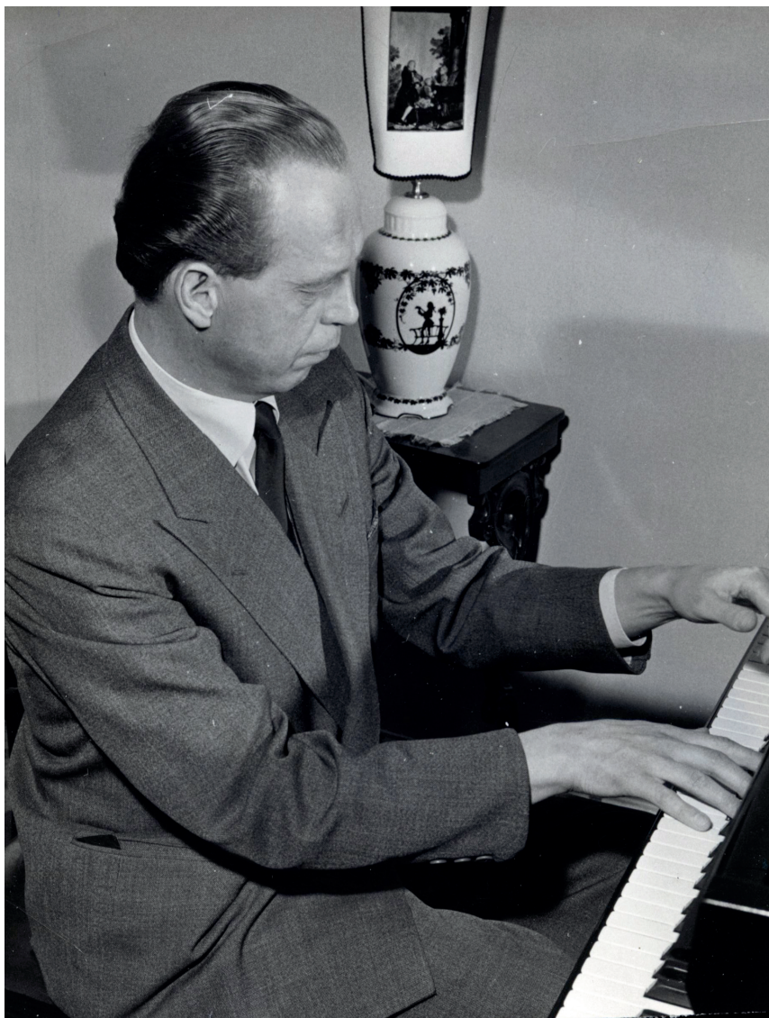
Kuva 15. Taiteilija työnsä ääressä.