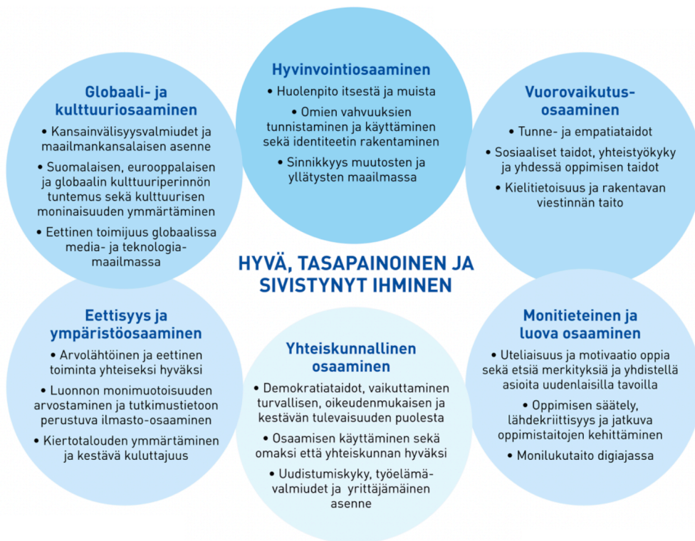
Kuvio 2. Lukion laaja-alaisen osaamisen osa-alueet (Opetushallitus 2019, 60).

Eettisyyden ja ympäristöosaamisen tavoitteiksi on määritelty muun muassa kestävä elämäntavan ekologisten, taloudellisten, sosiaalisten ja kulttuuristen ulottuvuuksien ymmärtäminen sekä tutustuminen tutkimustietoon ja käytäntöihin liittyen ilmastonmuutoksen hillitsemiseen ja luonnon monimuotoisuuden turvaamiseen. Myös Euroopan unionin tasolla koulutuksen yhdeksi tehtäväksi on määritelty sen varmistaminen, että kaikki oppilaat saavat kestävä kehityksen edistämiseen vaadittavaa tietoa (EU 2018, 3). Ekologisten kriisien uhatessa uudenlaisen luontosuhteen luominen ei ole siis ainoastaan poliittinen tehtävä, vaan myös pedagoginen. Kasvatuksella tulisi pyrkiä siirtymään vallitsevasta ekologisesti kestävästä maailmantilasta ja elämäntavoista kohti uudenlaista kestävämpää maailmaa. (Värri 2014, 89.)