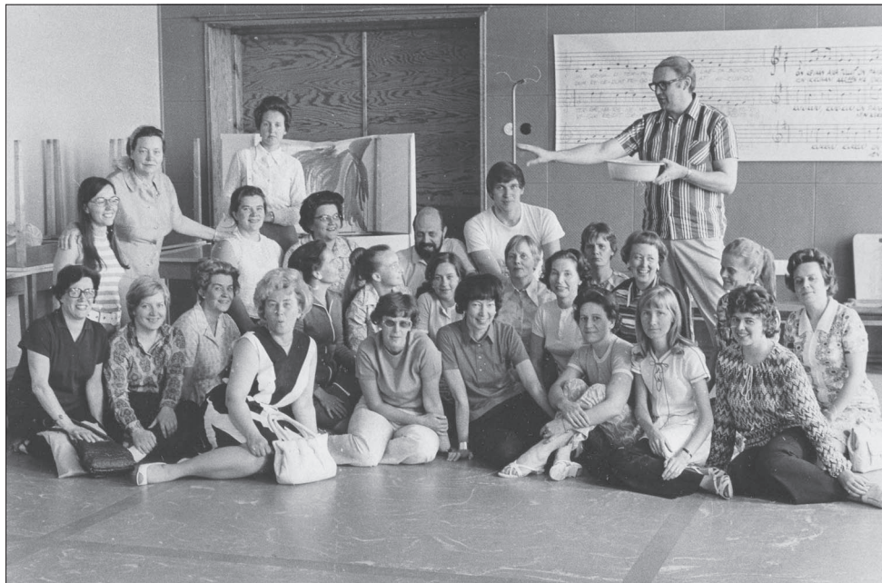
Klemetti-opiston luovan toiminnan kurssin osanottajat kesällä 1971 Orivedellä.