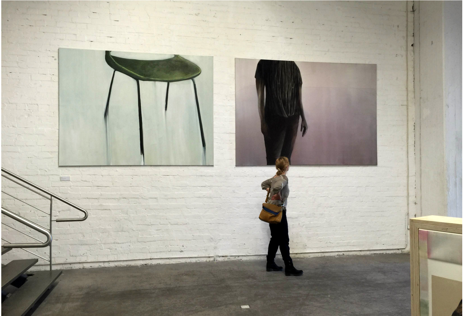
Kuvan Kevät 2016, Galleria Forum Box.