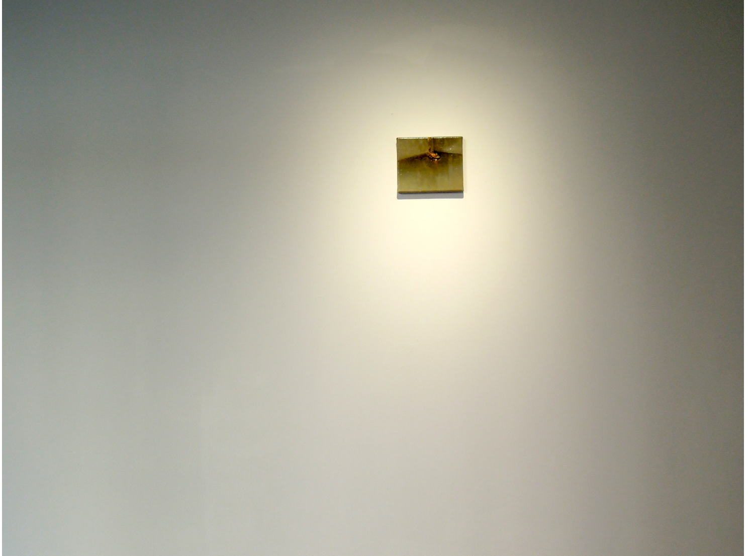
huone 10, 2016, öljy kankaalle, 16 × 19 cm