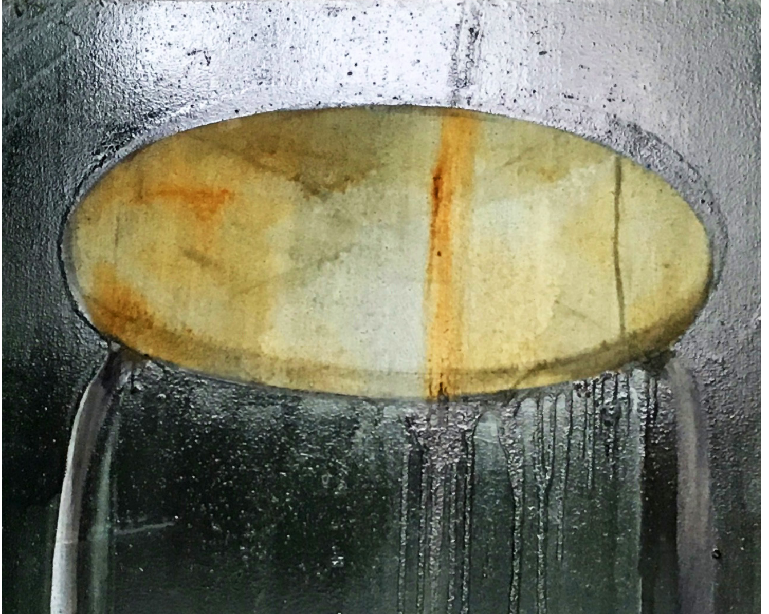
huone 8, yksityiskohta.