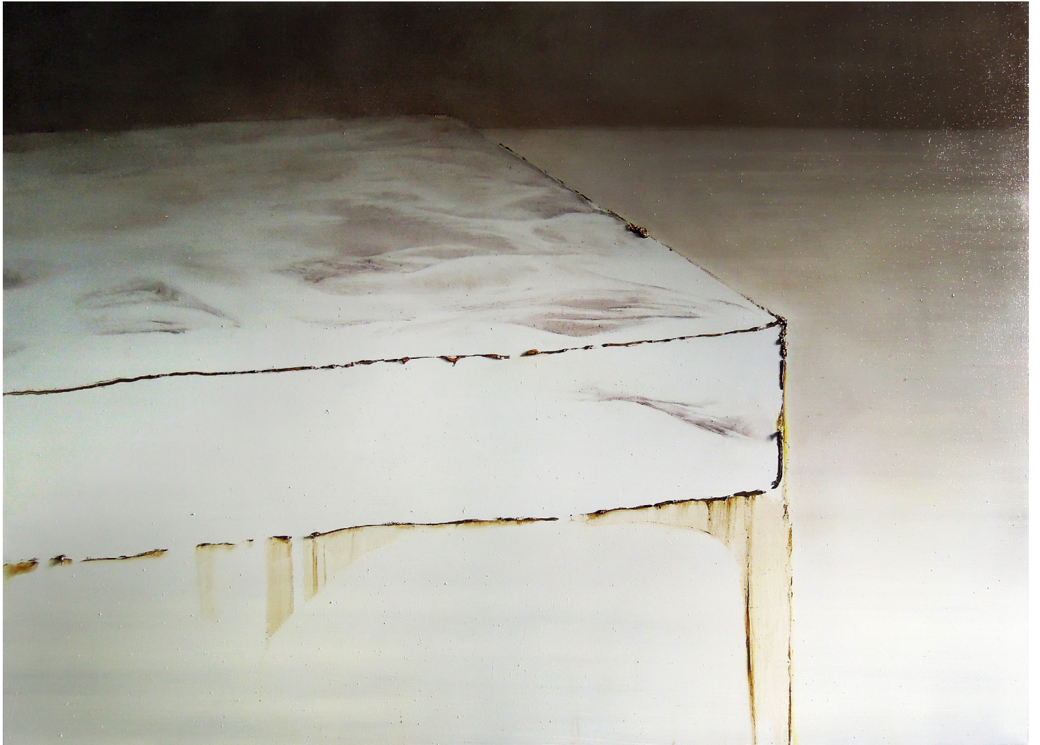
huone 9, 2016, öljy kankaalle, 175 × 240 cm