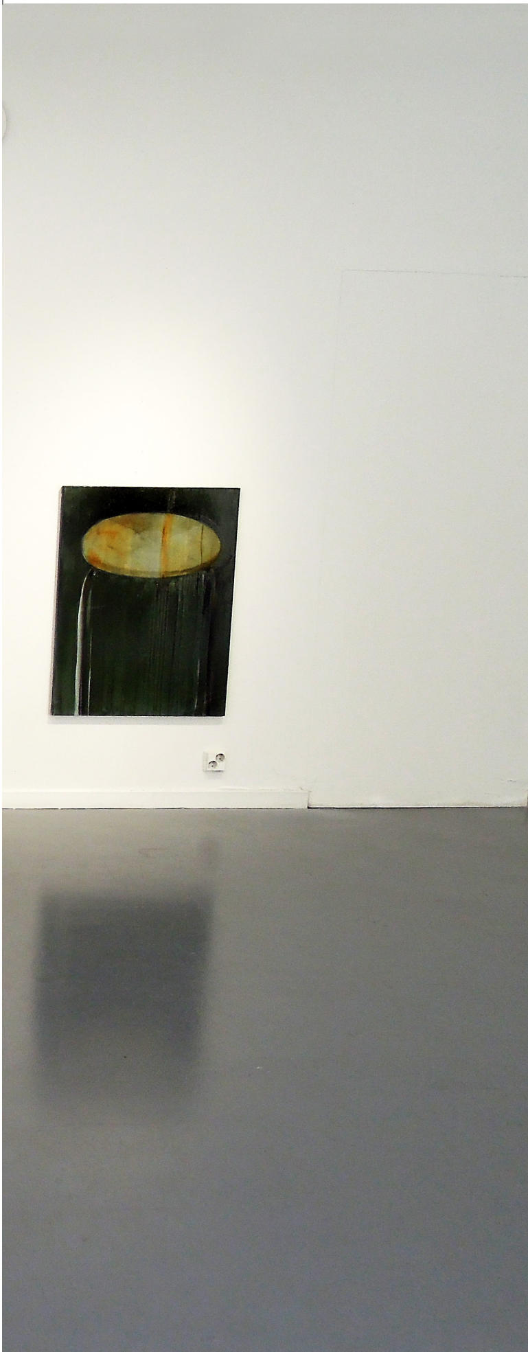
Exhibition Laboratory Project Room, huone 7 ja huone 8