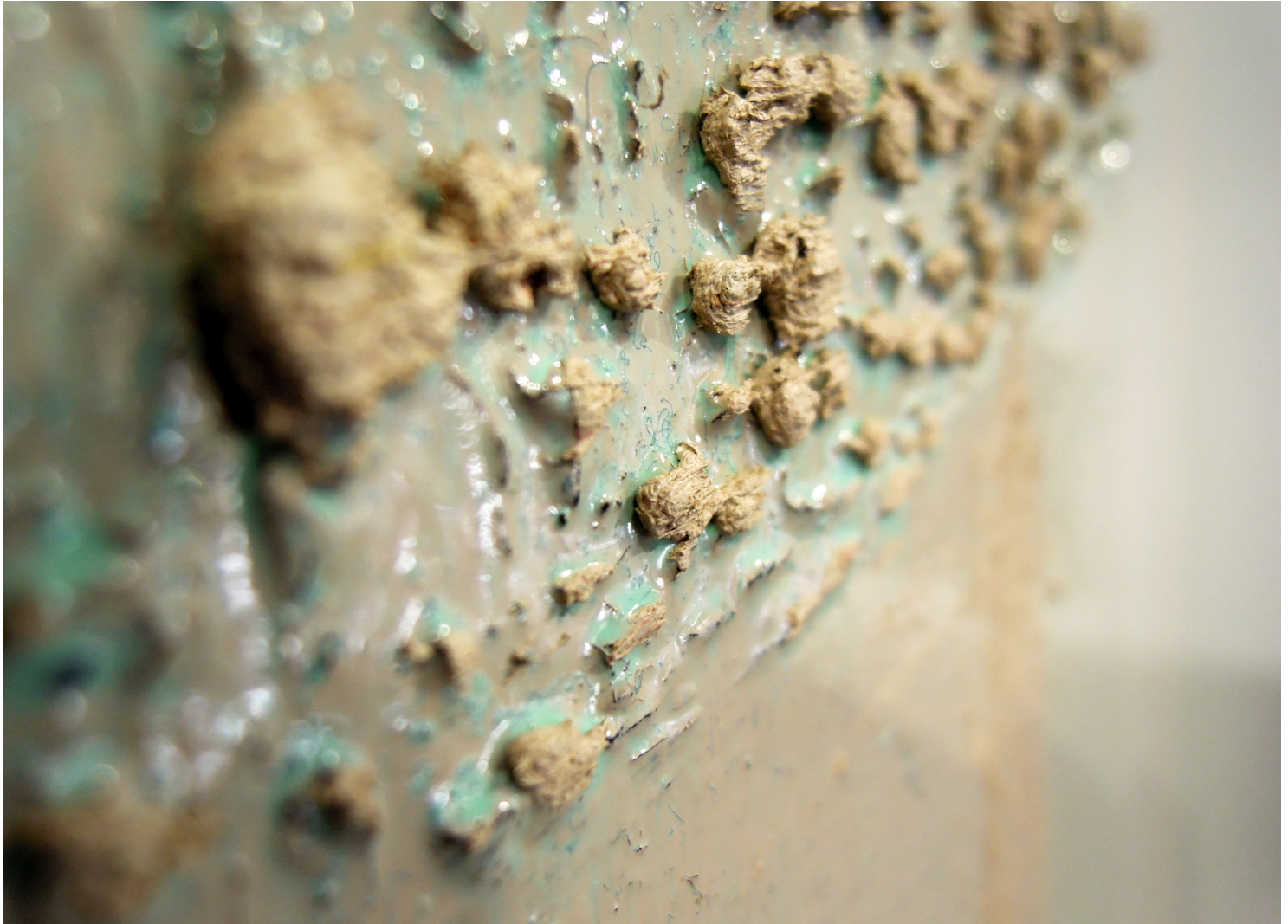
huone 7, yksityiskohta

sella, vaan kasvatan väriä lisäämällä värillisen lasuurin aina edellisen päälle ja maalaan ja maalaan, tulee tummaa. Tummaa en näe synkkänä. Värikerrokset ovat kuin peitto.