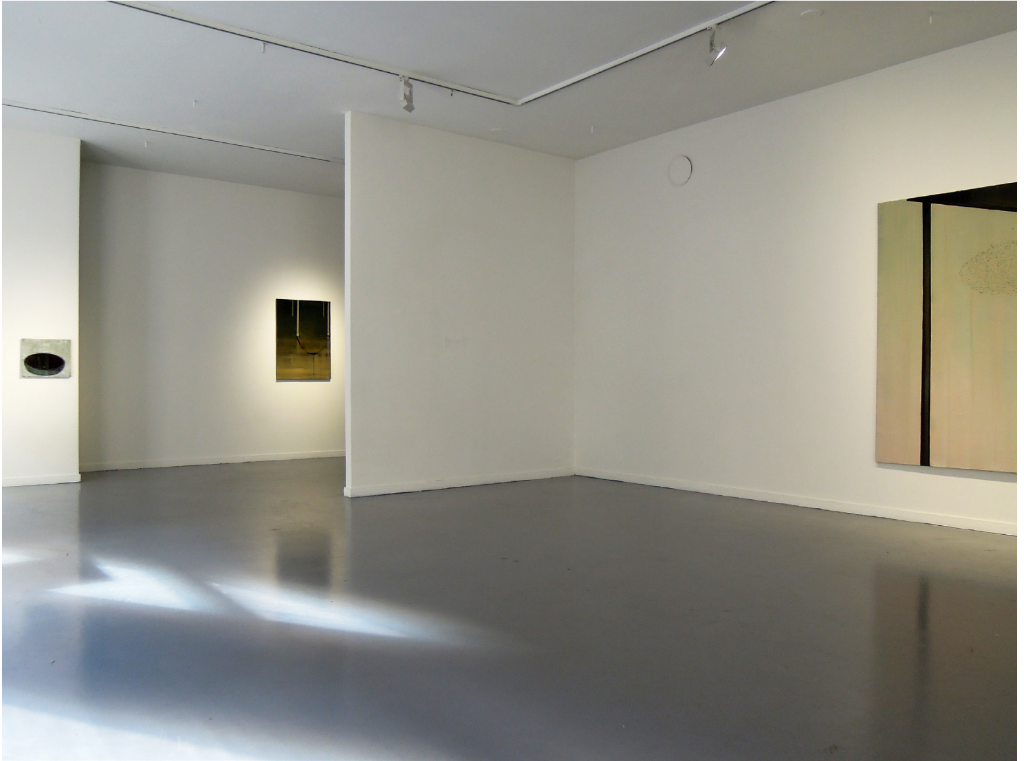
Exhibition Laboratory Project Room