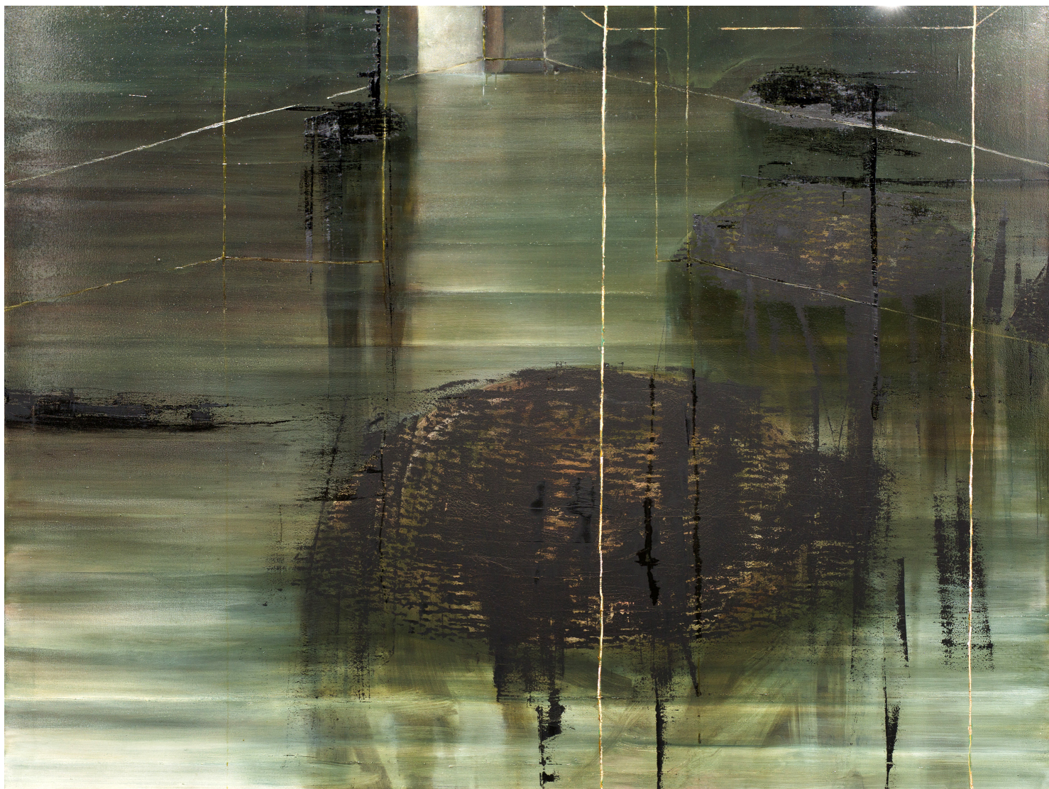
huone 1, 2015, öljy kankaalle, 175 × 230 cm.