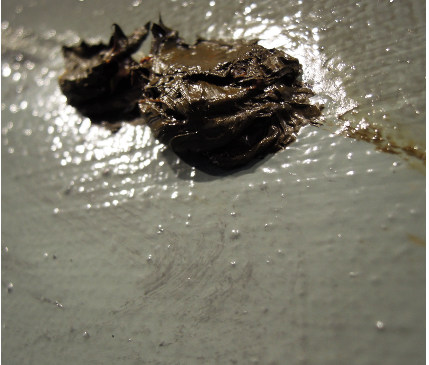
huone 9, yksityiskohta