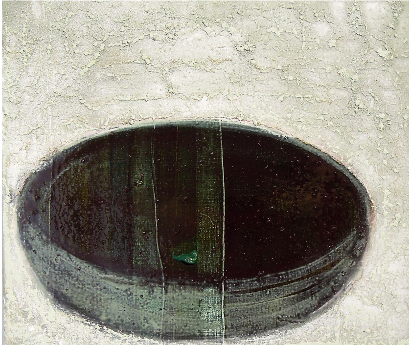
huone 6, 2016, öljy kankaalle, 23,5 × 38 cm