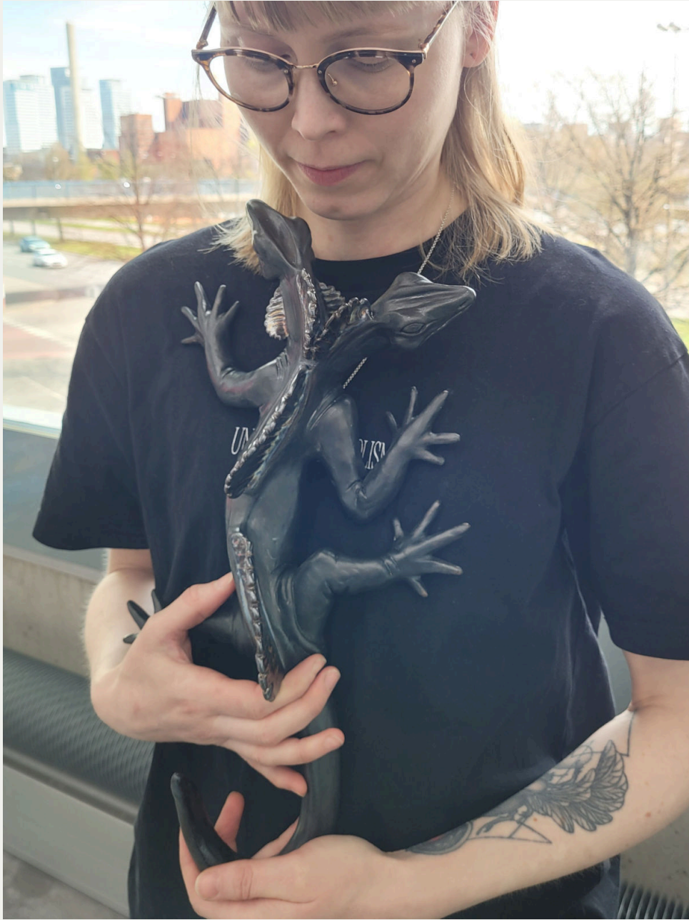
Creatures between worlds, viscusalamandra spectra -veistos näyttelyn ripustuksessa.