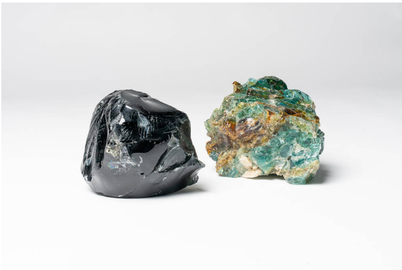
Esineeni kattalogia varten kuvasi Petri Summanen

Valitsemani esineet (kuvassa) ovat muistoesineitäni, ja vaikka ne eivät suoranaisesti liittyneet taiteelliseen prosessiin, on yhtäläisyyksiä tekstin ja taiteellisen opinnäyteprosessini väliltä löydettävissä. Siksi halusin liittää katalogitekstin myös tämän kirjallisen opinnäytteeni osaksi.