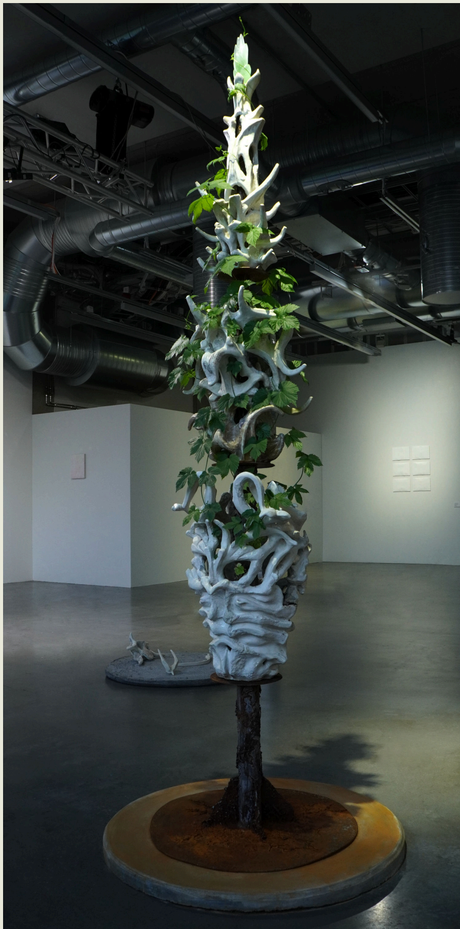
Humulus Anatomy of doubtful nature -veistoksessa kuukauden kestäneen näyttelyn lopussa.