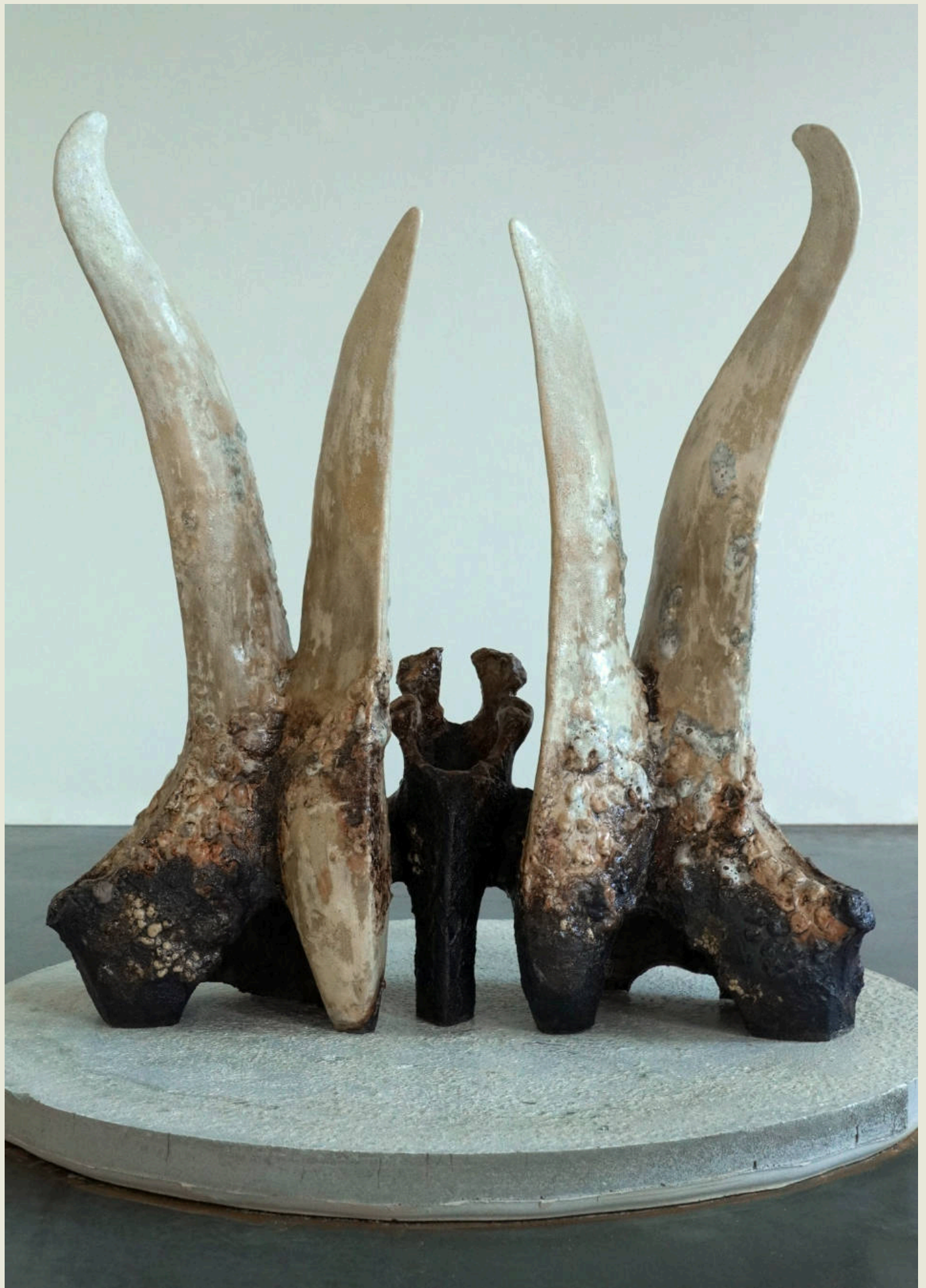
Remains from the Neoceratops , Neoceratops magnus