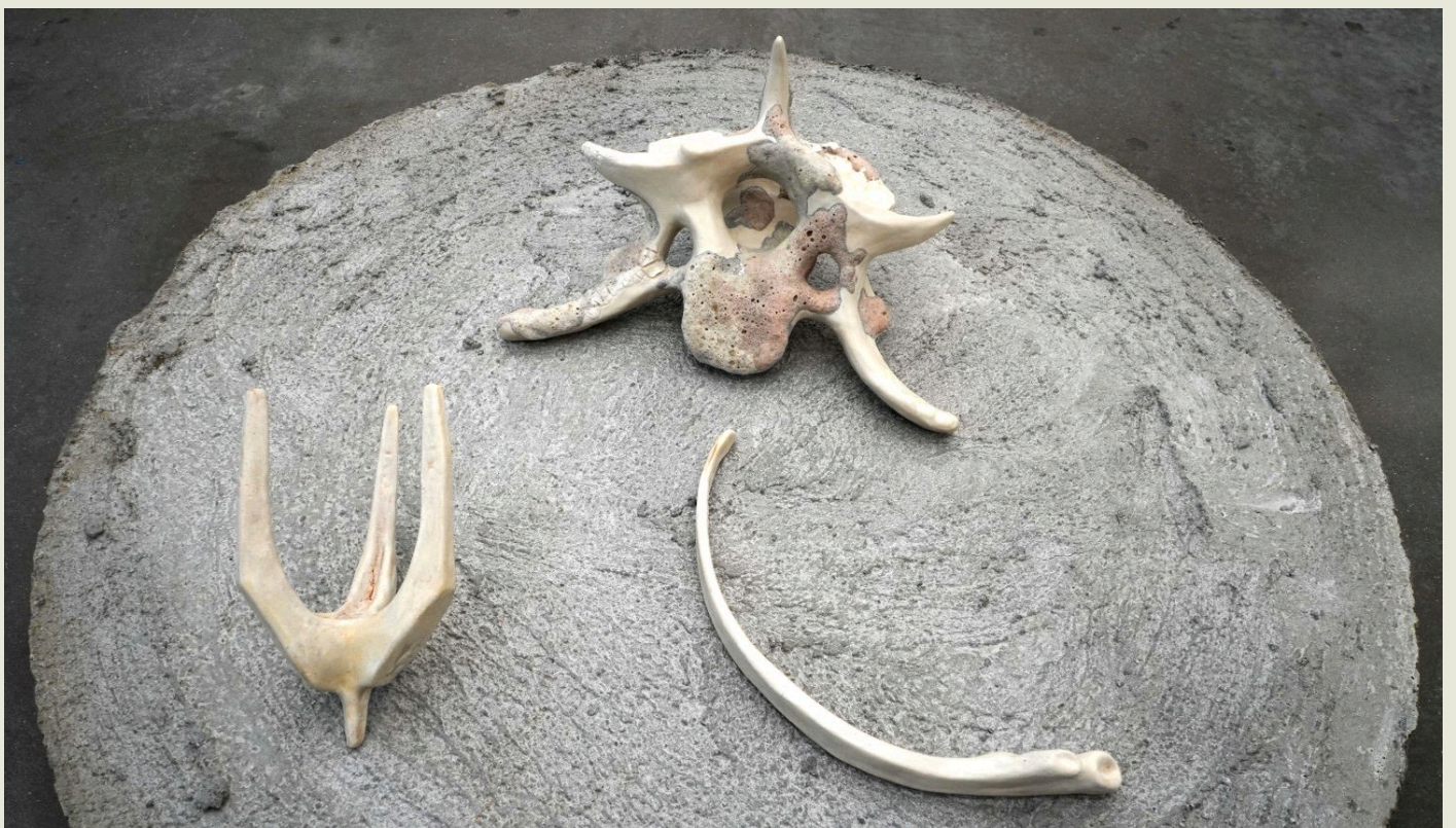
Remains from the \text{NO}\square\text{NO}\square\text{NO}\square , Fragmenta ossium incertorum