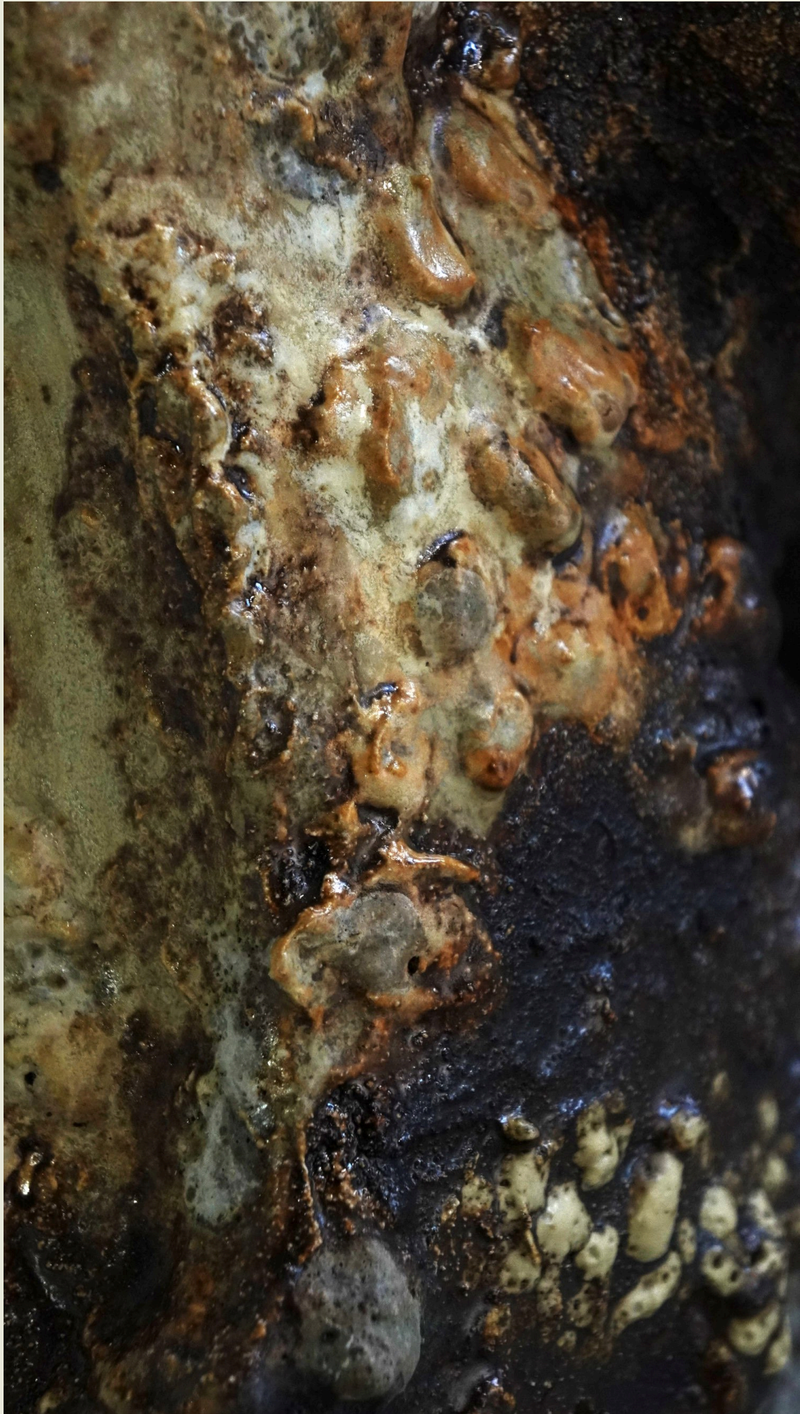
Lähikuvat veistosten lasitteista