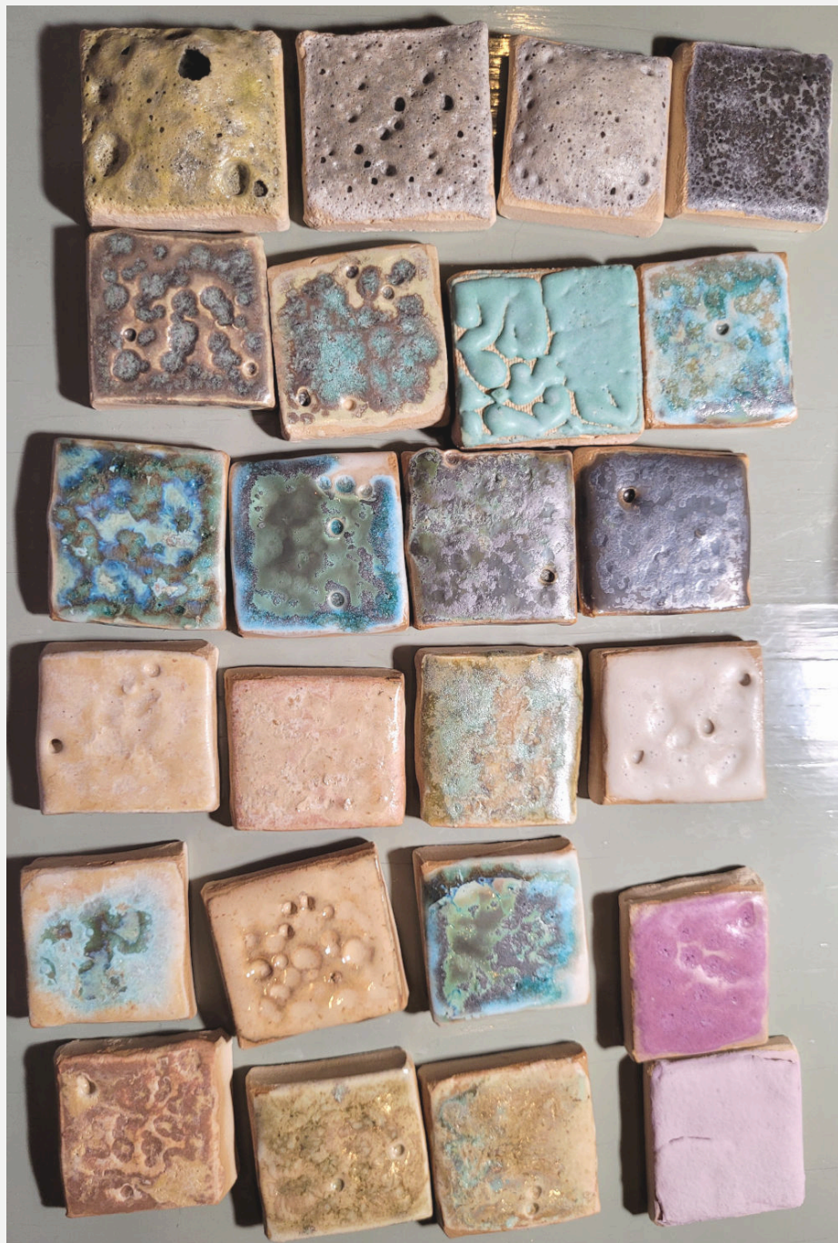
Pieni osa prosessin aikana tekemistäni lasitetestipaloista. Lasituspolton lämpötilana 1186°C.