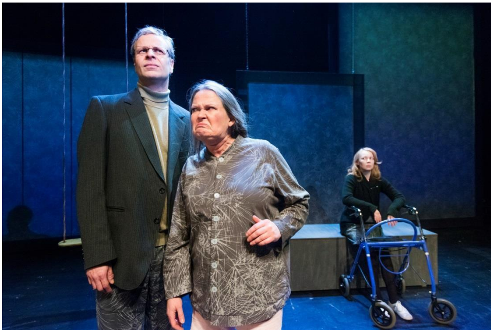
Kuva 7. Sairaala.

Arkut tarjosivat mahdollisuuden rakentaa sellaisia tilallisia ratkaisuja, joita näin useiden kohtausten vaativan. Näin kaikki miljööt rakennettiin arkuilla sairaalasta upseerikerholle ja luokkahuoneeseen asti. Ne mahdollistivat nopean leikkaamisen ja jättivät tilaa myös katsojien omille näyille ja näin korostivat tekstin rikasta monikerroksista maailmaa.