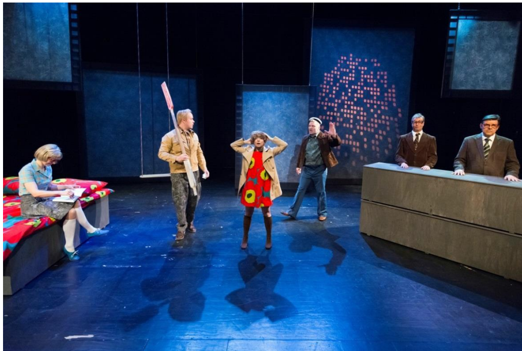
Kuva 9. Lottoarvonta.

työllistää lopulta juurikaan muita kuin lavastajan, vaikka sitä monesti ylevästi puhuu, että ”pelataan sitten elementtien kanssa kimpassa.” Toisaalta en tähän työhön olisi näyttelijöitä mukaan halunnutkaan, koska ei ole heidän tehtävä mahdollistaa työtään. Se on ohjaajan tehtävä.