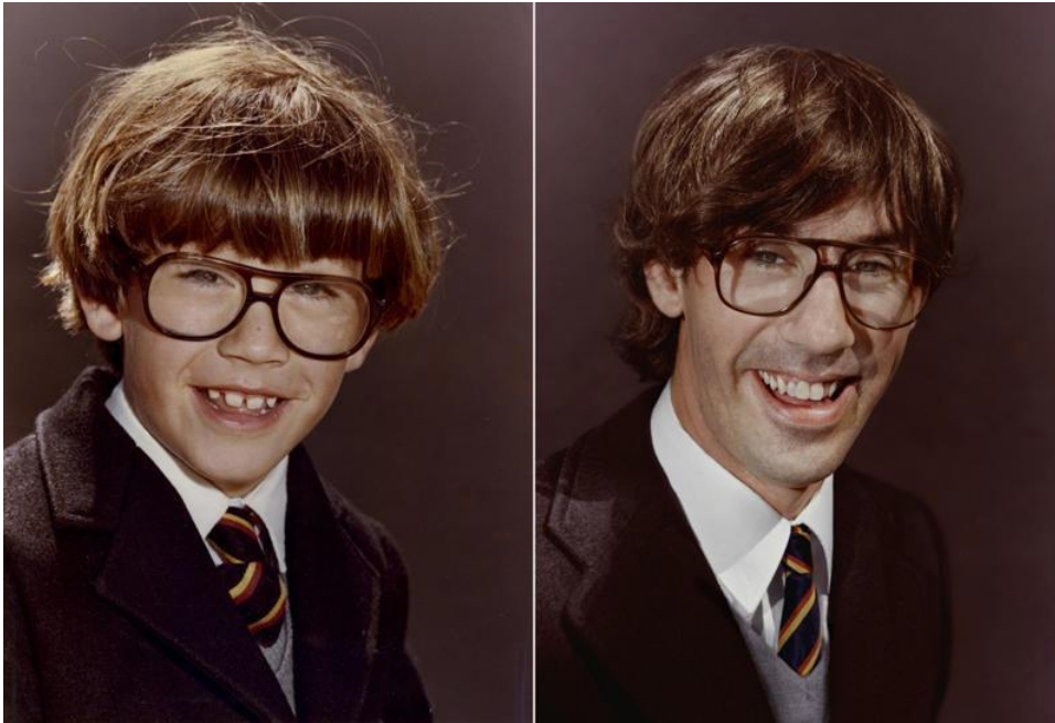
Kuva 3. Back to the future -kuvasarjasta. (Irina Werning)

asentoa ja ilmettä myöten, eli esimerkiksi koulukuva kuvataan samanlaista taustakangasta vasten samanlaisessa asussa, ihminen on vain vanhentunut tietyn määrän vuosia. Osassa näitä kuvia koin näkeväni sen, miltä näyttää, kun sisäinen lapsi, tai lapsi, joka olemme olleet, tai lapsi joka aina olemme, miten sen vain haluaa sanoa, on selvinnyt.