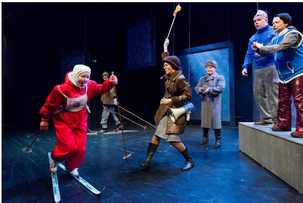
Kuva 8. Hiihtokilpailut.

Peter Brook korostaa hyvän lavastussuunnitelman olevan siinä mielessä epätäydellinen, että siinä on selkeyttä, muttei jäykkyyttä, ja että sitä voi sanoa avoimeksi, eikä suljetuksi. Tämä on hänen mukaansa teatteriajattelussa tärkeintä. Hän sanoo kunnan teatterilavastajan kuvittelevan ”luomustensa olevan koko ajan liikkeessä, toiminnassa, sidoksissa siihen mitä näyttelijä tuo kohtaukseen tekstin edetessä.” (Brook 1972, 110.)