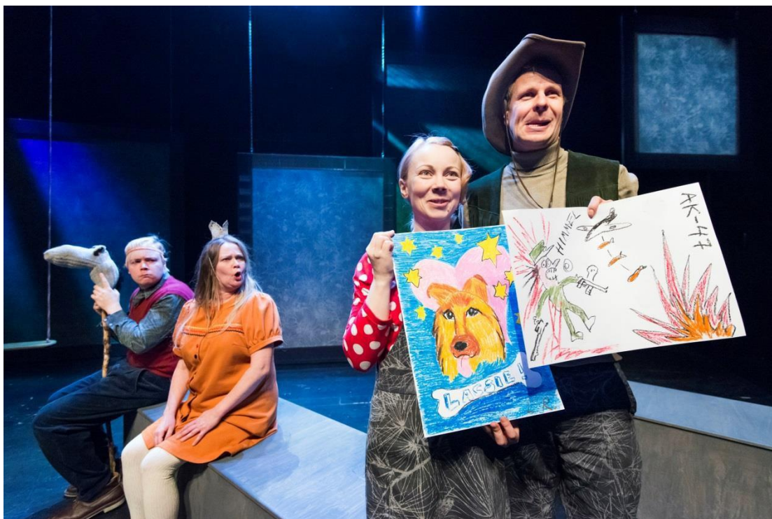
Kuva 5. Koululuokkakohaus.