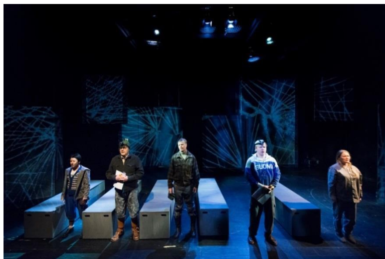
Kuva 6. Viides hauta.

Asemien luontia näyttämökuvallisena tarpeena tuottamaan ehdotin viittä arkkua Samulin aiemmin ehdottaman yhden ison sijaan. Ajatuksenani oli viidet näytelmän alussa olevat hautajaiset, joiden myötä arkut voisivat jäädä tuottamaan myös muuta maailmaa. Samulin huomauttaessa ”tanssin haudoilla” olevan raskas koko näytelmän kannalta päädyimme merkkamaan ne lelulaatikoiksi. Näin jälleen korostui se lapsuuden näkökulma. Ja vaikka koenkin yhden näytelmän peruskysymyksen olevan nimenomaan sukupolvien kierteessä, olin hyvin tyytyväinen kyseiseen ratkaisuun.