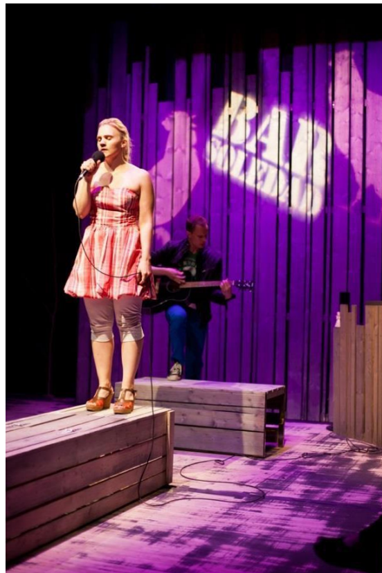
Kuva 2. Baari.

Kolme penkkiä hallitsi näyttämökuvaa ja antoi rajat sitoen ilmaisun niiden ympärille. Samalla ne vapauttivat, koska pelkkä suhde näihin elementteihin riitti ja luomamme keskeismetafora oli koko ajan läsnä. Yhdessä katsomoiden vastakkaisuuden ja yksinkertaisesti tuotettujen valolla rytmittyjen näyttämökuvien kanssa tämä kaikki alkoi tuottamaan omaa muotoaan.