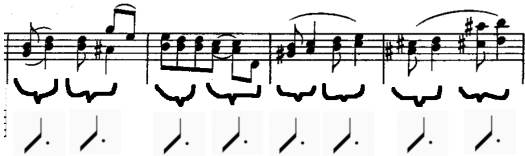
Kuva 3. "Pleasant Moments"-kappaleen motiivien polyrytmisen ilmiö. Tahdit 7–9.

Kappaleessa on "Bethenaan" verrattuna enemmän erilaisia synkopoivia melodisia motiiveja. Sävellyksen päämotiivin ensimmäinen tahti muistuttaa rytmisesti "Bethenan" melodiaa mutta toisen tahdin motiivi tarjoaa rytmisesti erilaisen vastauksen tälle (ks. Kuva 2). Mielenkiintoista on, että kappaleen kaikki synkopoivat motiivit perustuvat siihen, että \frac{3}{4} tahti jaetaan kahdeksasosien tasolla puoliksi. Melodian rytmit ikäänkuin muodostavat pisteellisistä neljäsosista koostuvan rytmin vasten säestyksen neljäsosapulssia. Riippuu tosin vahvasti esittäjän aksentoinnista ja dynamiikasta miten tämä polyrytmisen ilmiö välittyy (ks. Kuva 3).