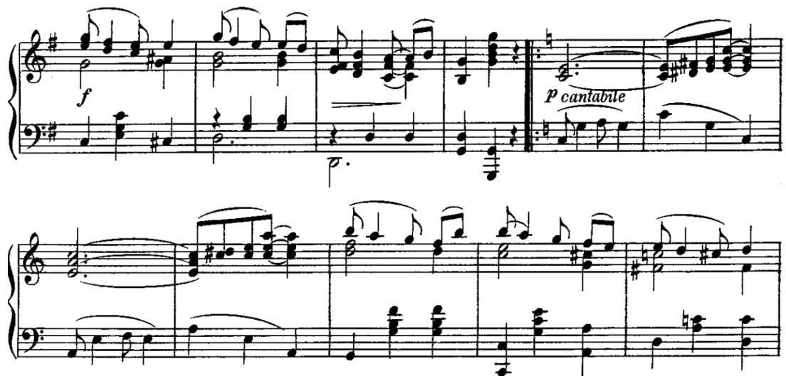
Kuva 5. Scott Joplin ”Pleasant Moments: Ragtime Waltz” tahtit 51–61.