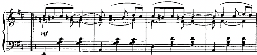
Kuva 4. Scott Joplin "Pleasant Moments: Ragtime Waltz" tahdit 21–24.

Kappaleen tahdista 21 alkavassa toisessa osassa esiintyy motiivi, jossa nuotteja on sidottu tahtiviivan ylitse (ks. Kuva 4). Tässäkin kuviossa rytmit muodostavat kahden tahdin sekvenssin, joka toistuu useasti. Voisi myös hahmottaa, että tahdin 22 rytmisen vastaus tahdin 21 melodian rytmille alkaa tahdin toiselta kahdeksasosalta. Valssin säestyskuvion ollessa hyvin iskupainotteinen, tällainen melodian rytmin "risteäminen" säestyksen kanssa on varsin harvinaislaatuinen ilmiö aikansa valssisävellyksille.